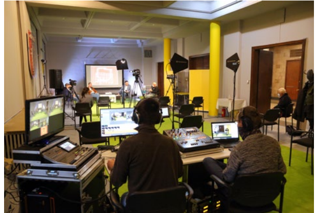
Debata online Remont. Robimy porządki małe i duże , Muzeum Nowej Huty, 16 października 2020 r.

Szkolenia dla przewodników to od lat stała część oferty Muzeum. Realizowane są na kilku poziomach: podstawowym – szkoleń dla zainteresowanych zapoznaniem się z wystawami i ofertą Muzeum, dla przewodników chcących uzyskać uprawnienia do oprowadzania po wystawach stałych Muzeum i wreszcie dla zaawansowanych, tj. dla przewodników chcących poszerzyć swoje kompetencje wiedzy o Kra-