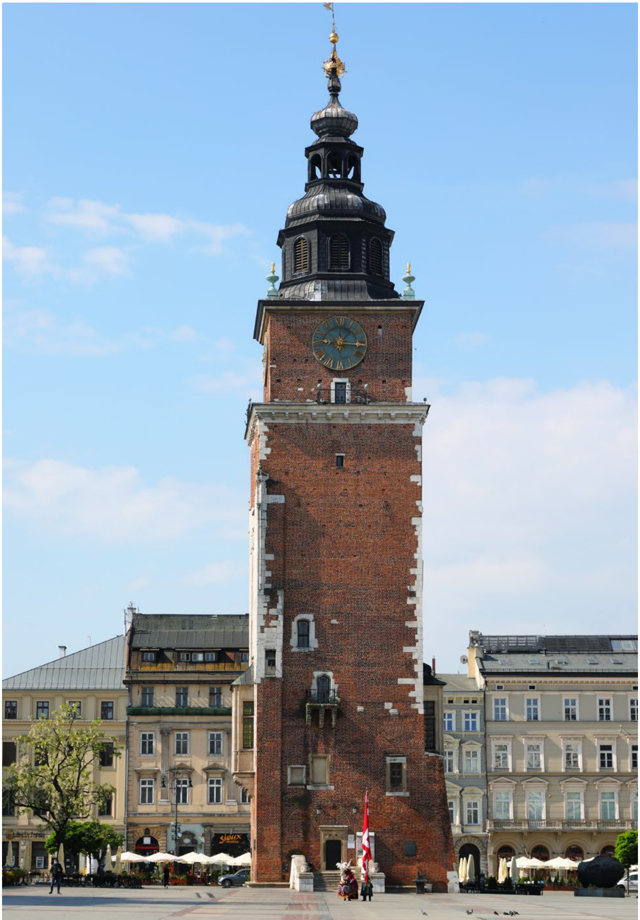
Lajkonik w czasach pandemii COVID-19, 1 czerwca 2020 r., fot. Andrzej Janikowski