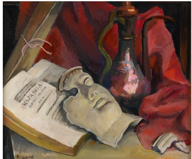
Eugeniusz Waniek, Martwa natura z maską , sygn. l.d. E. Waniek, 1993, olej, płótno, 36 × 45 cm, nr inw. MHK-137/IV