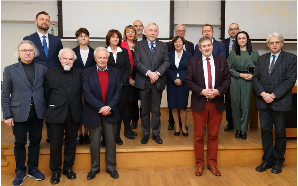
Posiedzenie Rady Muzeum Krakowa, sala Miedziana w pałacu Pod Krzysztofory, 21 stycznia 2020 r.

nowania. Odwołanie się do hasła jubileuszu 120-lecia Muzeum Jestem Kraków wskazuje na główny kierunek działania, na rozmowę o krakowskiej tożsamości i na zaproszenie do współpracy wokół tego hasła ludzi i środowisk chcących odkrywać i pogłębiać krakowską identyfikację. Centrum Działań Społecznościowych podejmowało w roku 2020 dopiero pierwsze działania i wypracowywało program na kolejne lata. Spektakularnym wydarzeniem było uruchomienie, po kilkudziesięciu latach przerwy, dzwonu gwałtownego na Wieży Ratuszowej jako miejskiego dzwonu o imieniu Bolesław.