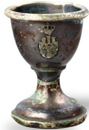
Jeden z dwóch kieliszków na jajka z herbem Krakowa, na podstawie znak M. Jarra , XX w., plater, nr inw. MHK-6262/III/1-2