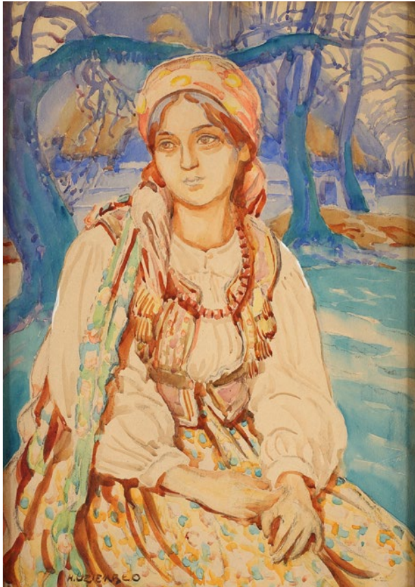
Henryk Uziembło, Portret wiejskiej dziewczyny (Krakowianka?) , sygn. l.d. H. UZIEMBŁO, 1. ćw. XX w. (?), akwarela, gwasz, papier, 49,5 × 35 cm, nr inw. MHK-6254/III