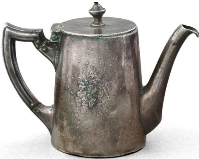
Jeden z sześciu mleczników z herbem Krakowa, XX w., plater, nr inw. MHK-6261/III/1-6