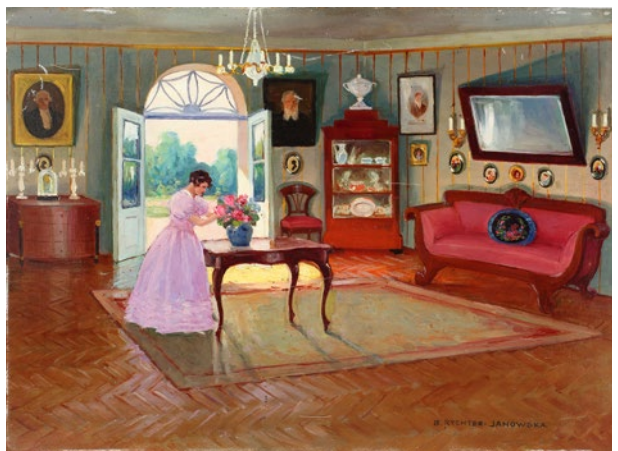
Bronisława Rychter-Janowska, W dworku , sygn. p.d. B. RYCHTER-JANOWSKA, pocz. XX w. (?), olej, tektura, 24 × 34 cm, nr inw. MHK-6234/III