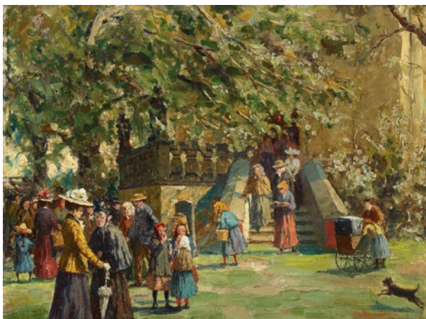
Wincenty Wodzinowski, Scena rodzajowa , sygn. p.d. W. WODZINOWSKI / MONACHIUM 1894, olej, płótno, 30,5 × 40,5 cm, nr inw. MHK-6230/III