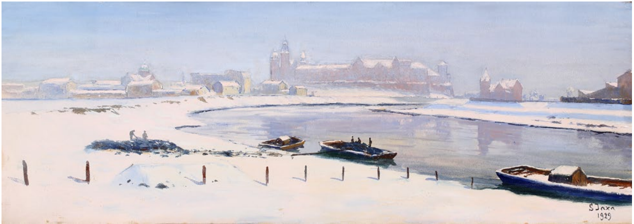
Soter Jaxa-Malachowski, Widok na Wawel , sygn. p.d. S. Jaxa / 1929, olej, tempera, tektura, 23,5 × 68,5 cm, nr inw. MHK-6215/III