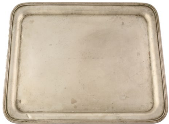
Taca prostokątna z napisem REST. POD OBRAZEM / W KRAKOWIE, znak firmy NORBLIN i SKA, XX w., nr inw. MHK-6259/III