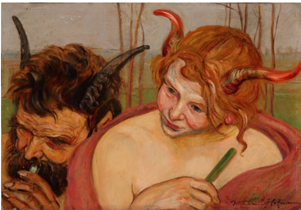
Wlastimil Hofman, Dwóch faunów (Satyr) , sygn. p.d. Wlastimil Hofman, lata 20.–30. XX w., olej, dykta, 33,5 × 48 cm, nr inw. MHK-6227/III