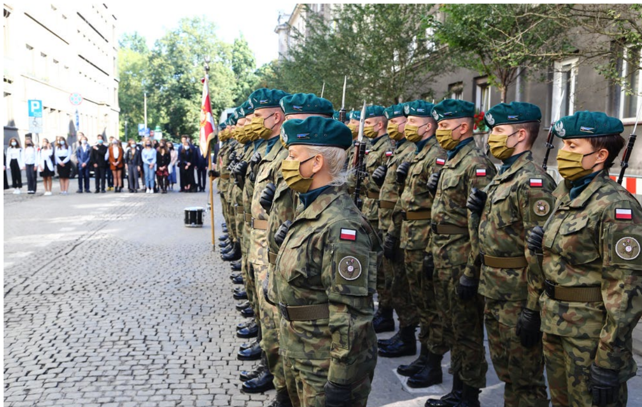
Uroczysty Apel Poległych w czasie Dni Pamięci Ofiar Gestapo , Ulica Pomorska, 11 września 2020 r.