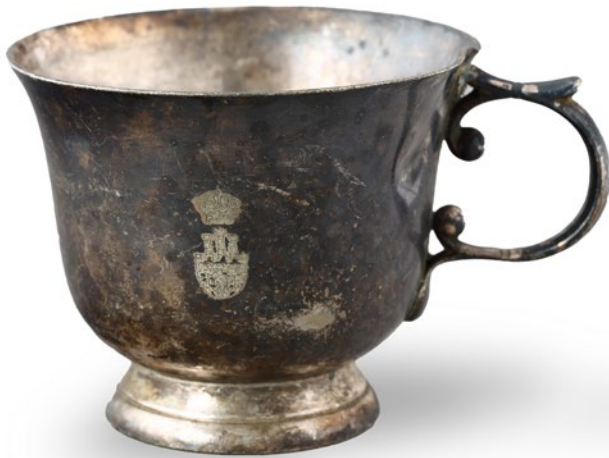
Jedna z trzech bulionówek z herbem Krakowa, na podstawie znak M. Jarra , XX w., plater, nr inw. MHK-6260/III/1-3