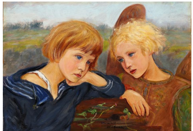
Wlastimil Hofman, Portret dzieci (Dziecko i anioł) , sygn. d.sr., Wlastimil / Hofman, lata 20.–30. XX w., olej, tektura, 25 × 35 cm, nr inw. MHK-6226/III