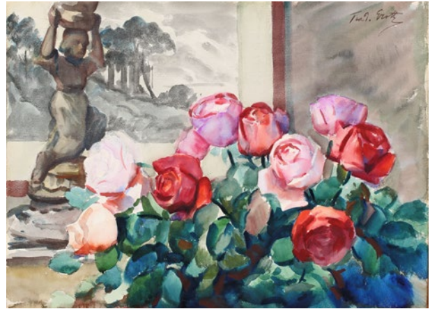
Teodor Grott, Martwa natura z różami , sygn. p.g. Teod. Grott, XX w., akwarela, 36 × 50 cm, nr inw. MHK-6229/III