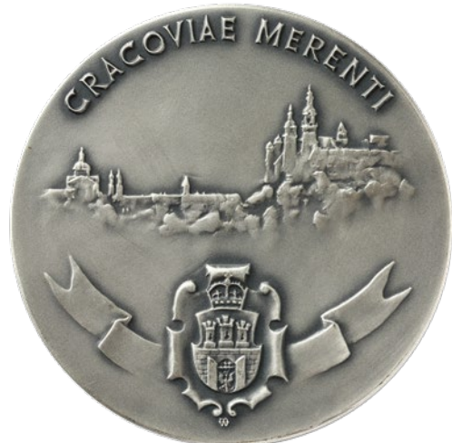
Medal Cracoviae Merenti, 2019, proj. Kazimierz Adamski, 1993, srebro, odlew, nr inw. MHK-4271/IIN/1-4, awers i rewers