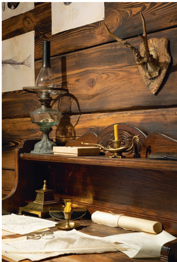
Gabinet badacza; fot. w zbiorach Muzeum Pamięci Sybiru

Ekspozycje w tej części ekspozycji stanowią głównie rzeczy codziennego użytku, przedmioty zabrane przez deporto-