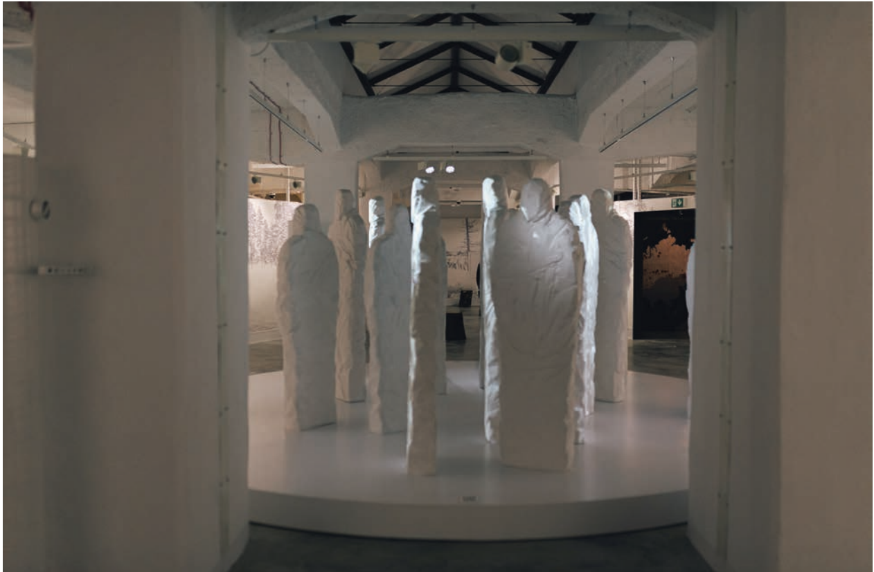
Ludzie z lodu ; fot. w zbiorach Muzeum Pamięci Sybiru

z deportacją stanowiły początek życia dramatycznie odmiennego od tego, które prowadziły wcześniej.