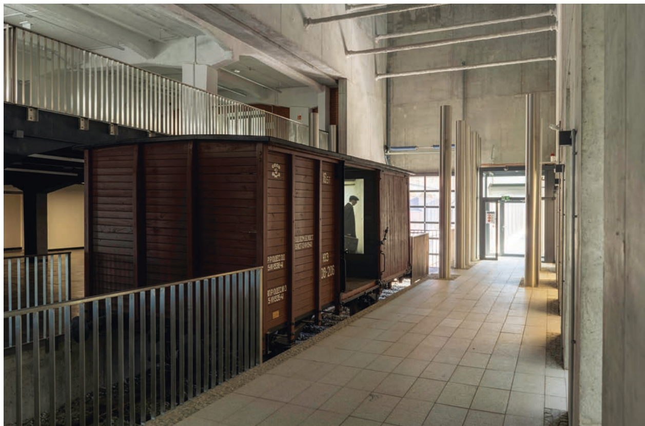
Oryginalny wagon towarowy, którym transportowano zesłanych na Syberię

Usytuowanie Muzeum Pamięci Sybiru umożliwia wykorzystanie realnego miejsca, czyli przestrzeni geograficznej, która jest historycznie powiązana z minionym przebiegiem zdarzeń. Przestrzeń wewnątrz budynku obejmuje również tory starej bocznicy. Stojący na nich odrestaurowany oryginalny wagon towarowy (tzw. ciepłuszka, ros. теплушка) pełni funkcję bramy dla wchodzących na wystawę.