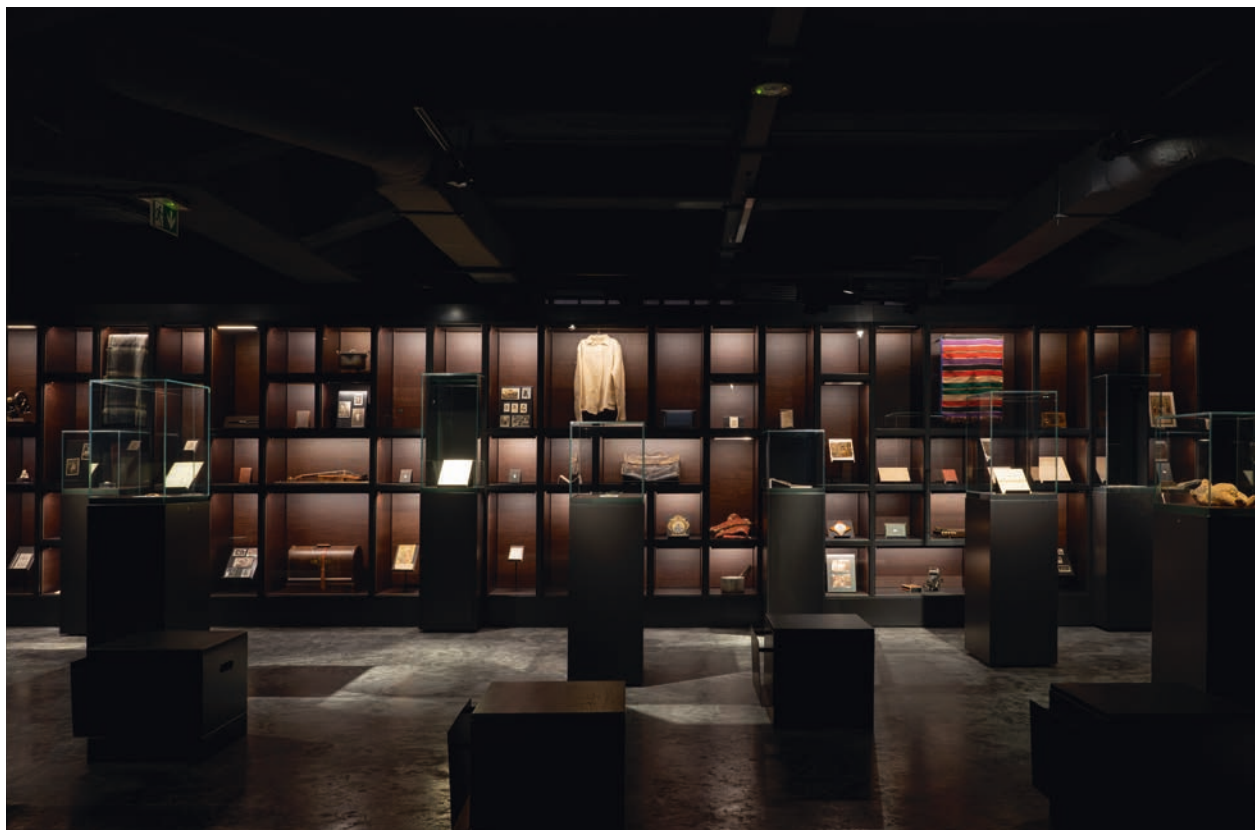
Przedmioty zabrane przez deportowanych

z bogatą fauną i florą. Ludy tajgi, czyli jej rdzenni mieszkańcy, są w wielu wymiarach jeszcze niezbadaną tajemnicą dla ludzi z zachodniego świata. Wystawa nie wspomina co prawda o innych aspektach kulturowych Syberii, jak unikatowa architektura drewniana (przepięknie zachowana w Irkucku) czy kulinaria, daje jednak widzom możliwość dojrzenia nieco innej niż martyrologiczna perspektywy.