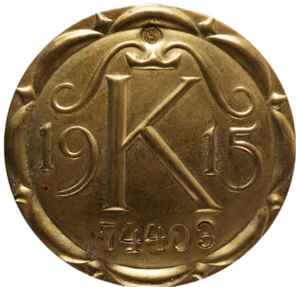
Odnaka upoważniająca do pozostania w twierdzy Kraków, 1915, blacha mosiężna; w zbiorach MK, nr inw. MHK-4618/III/11

stwierdzając, że od 15 lipca mają służyć jako zwyczajne pozwolenie na pobyt w mieście.