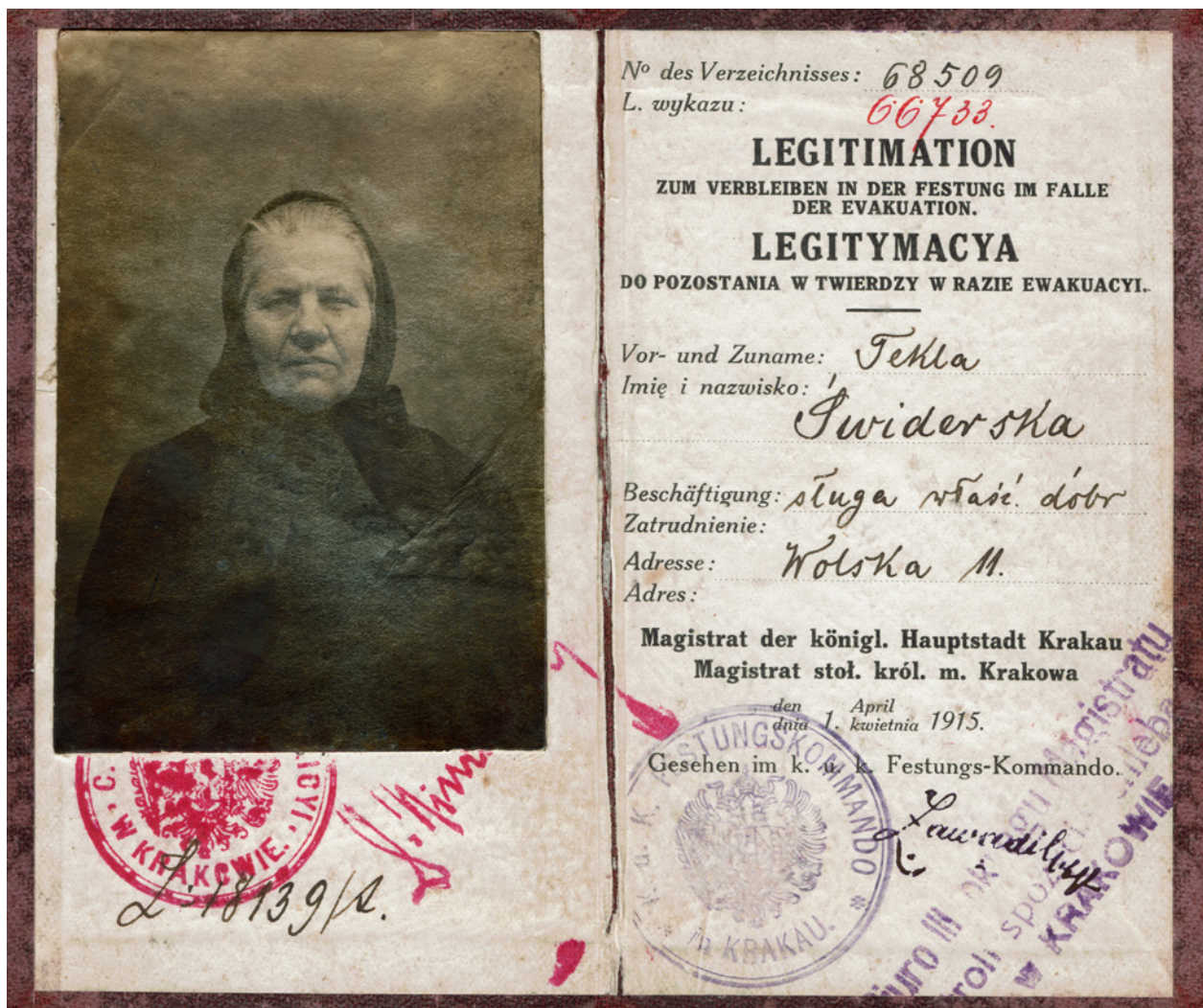
Przykładowe legitymacje uprawniające do pozostania w twierdzy Kraków w razie ewakuacji, wydane 1 kwietnia 1915 r. przez magistrat Krakowa; w zbiorach Jacka M. Majchrowskiego

Sytuacja Krakowa w latach wojny była skomplikowana. Z jednej strony, tak jak w całej Galicji, swobody polityczne były tu znacznie większe niż na pozostałych ziemiach polskich, z drugiej należy pamiętać, że Kraków był największą w tej części Europy twierdzą, ze wszystkimi płynącymi z tego faktu konsekwencjami. To tu mógł działać Naczelny Komitet Narodowy, a w końcówce wojny, od 28 października 1918 roku, Polska Komisja Likwidacyjna, będąca faktycznym rządem, nadto z kompetencjami ustawodawczymi. Z kolei status twierdzy generował liczne negatywne konsekwencje, zwłaszcza dla ludności cywilnej. Już bowiem od przełomu lipca i sierpnia 1915 roku sytuacja aprowizacyjna Krakowa była coraz gorsza. Wprowadzono limity jednorazowych zakupów towarów spożywczych, regulowane ceny, reglamentację, a po jakimś czasie także zajęcia wszelkich materiałów budowlanych na użytek komendy twierdzy. Rozprzestrzenił się pokątny handel i paskarstwo. Z przeznaczeniem na szpitale zajęto wszystkie szkoły i budynki publiczne. Zamarło życie kulturalne. Kraków stawał się coraz bardziej zamkniętym miastem – twierdzą. Prioritytety władz austriackich zawężyły się do trzech punktów: pozyskania jak największej liczby osób zdolnych do służby