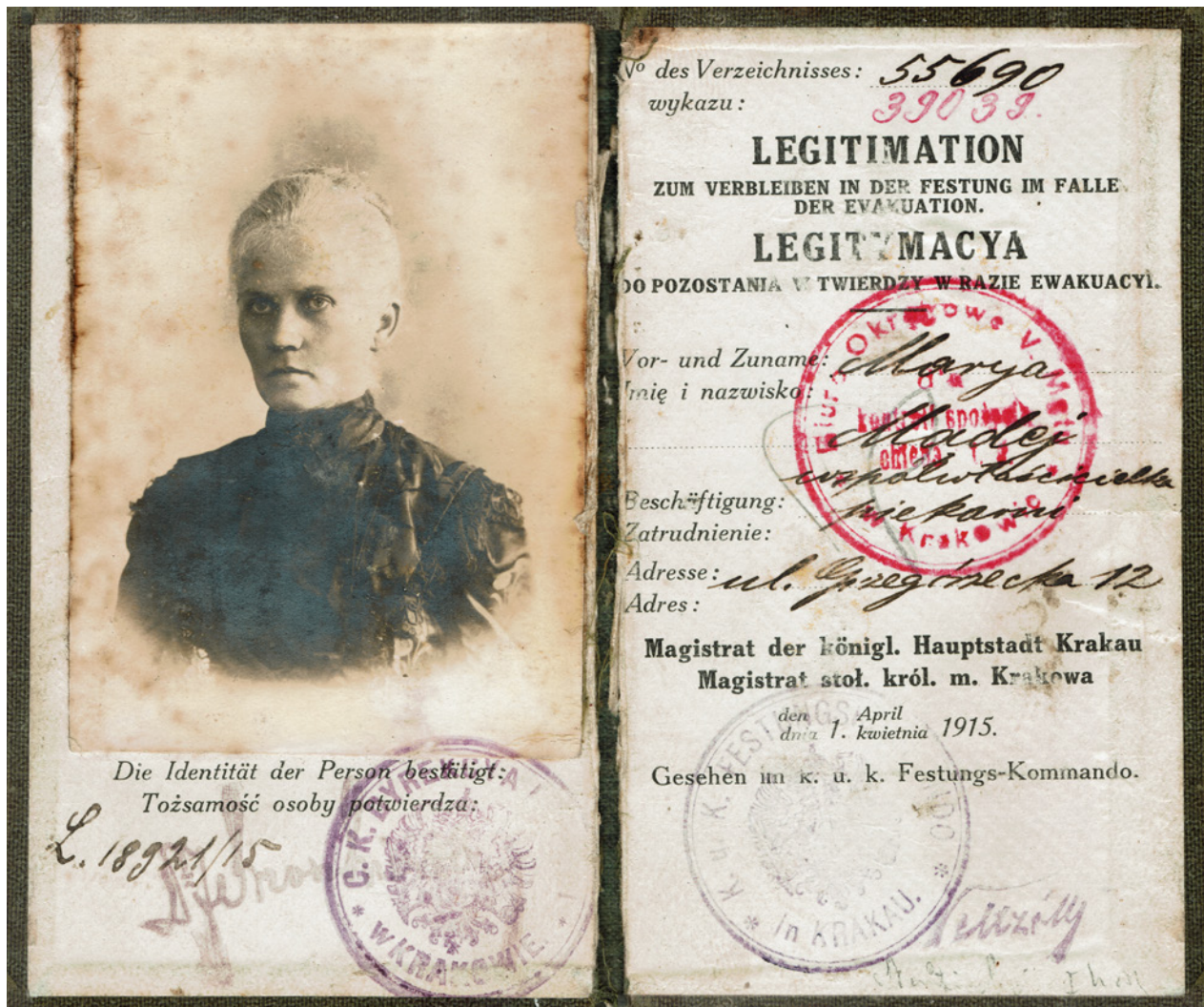
Przykładowe legitymacje uprawniające do pozostania w twierdzy Kraków w razie ewakuacji, wydane 1 kwietnia 1915 r. przez magistrat Krakowa; w zbiorach Jacka M. Majchrowskiego

was worn pinned onto an amaranthine ribbon with two white stripes on the sides.