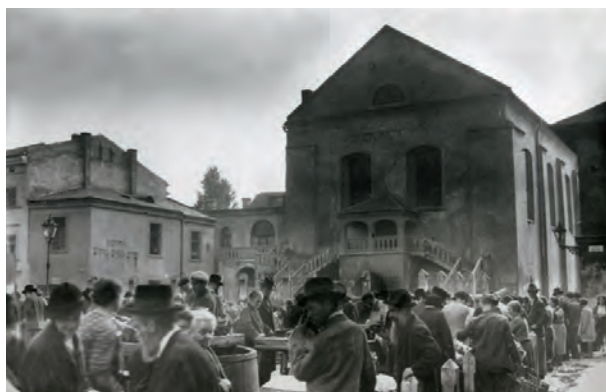
Targ rybny na pl. Izaaka w Krakowie, 1926