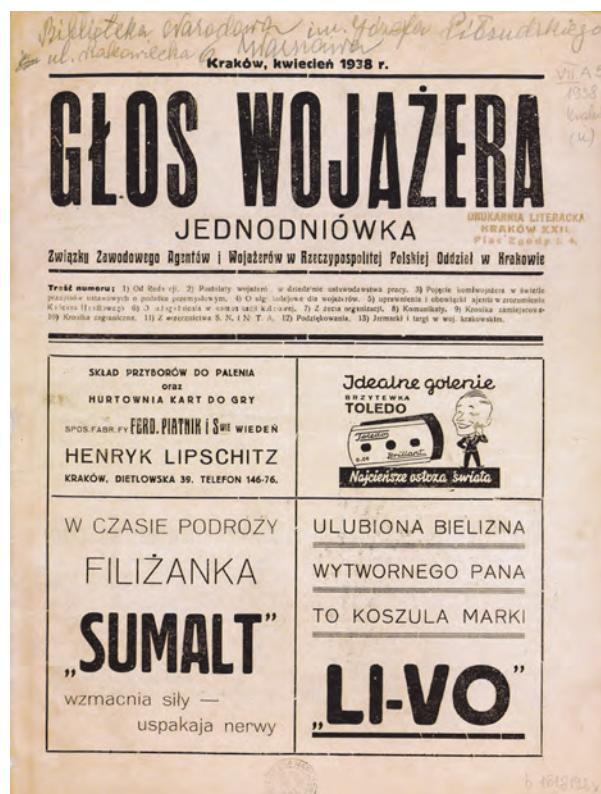
Strona tytułowa „Głosu Wojazera” jednodniówki Związku Zawodowego Agentów i Wojazerów Rzeczypospolitej Polskiej, Kraków, kwiecień 1938 r.