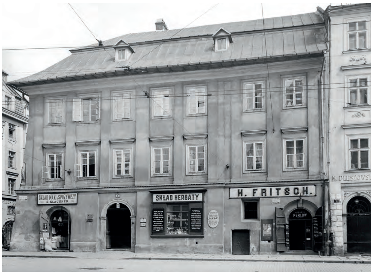
Przedsiębiorstwa prowadzone przez Żydów w kamienicy przy Małym Rynku 1 w Krakowie, okres międzywojenny