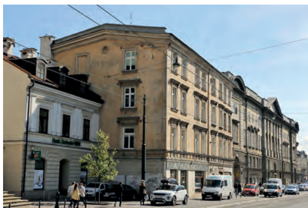
Współczesny widok budynku przy ul. Stradomskiej 10, w którym mieściła się Żydowska Koedukacyjna Średnia Szkoła Handlowa, fot. Dominik Lulewicz, 2017