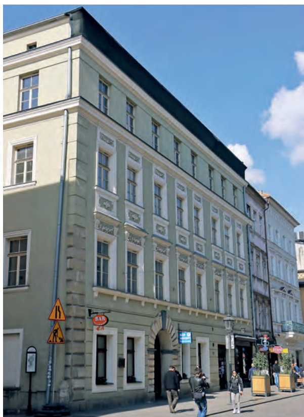
Obecny widok budynku, w którym mieściła się siedziba Krakowskiego Stowarzyszenia Kupców przy ul. Grodzkiej 43