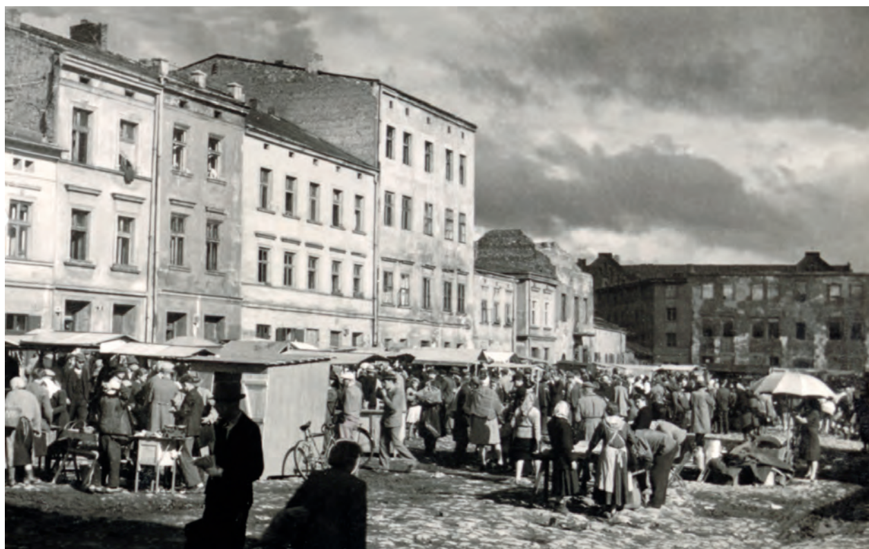
Targ przy ul. Szerokiej w Krakowie, ok. 1946 r.