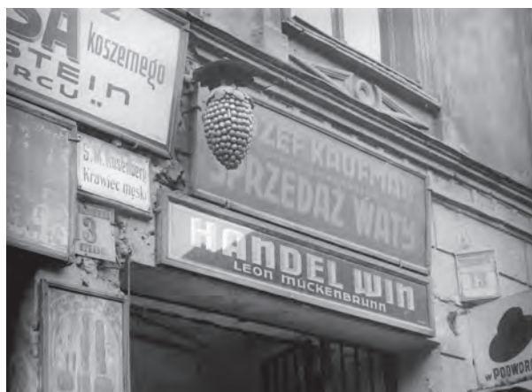
Szklady reklamowe sklepów żydowskich przy ul. Stradomskiej 13, pierwsze dwie dekady XX w.