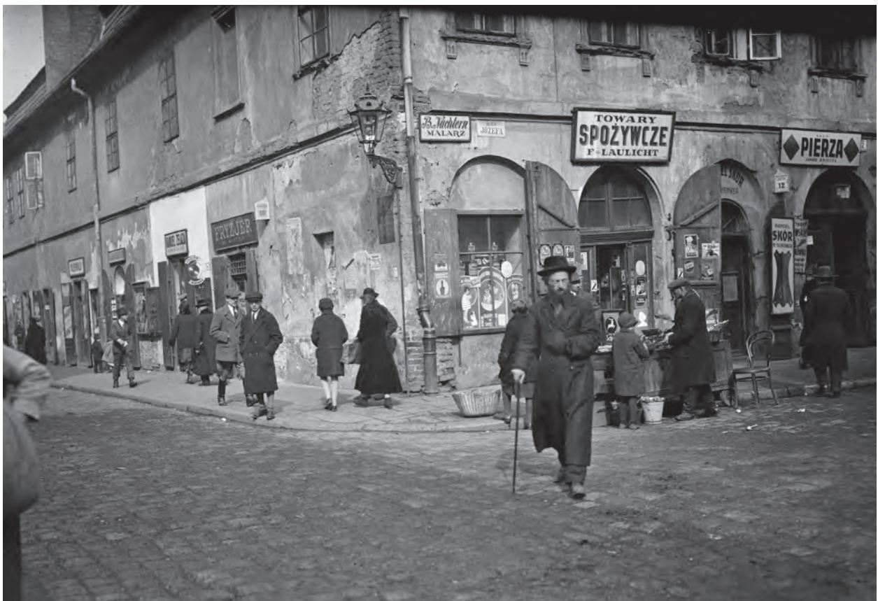
Sklepy w narożniku ulic Bożego Ciała i Józefa na Kazimierzu, ok. 1930 r., autor fot. nieznanymi; w zbiorach MHK, nr inw. MHK-449-N

ukazało się kilka numerów pisma „Głos Wojazera”, w którym poruszano aktualne problemy, z jakimi borykali się przedstawiciele handlowi 29 . W kolejnych latach pismo ukazywało się sporadycznie w formie jednodniówek 30 .