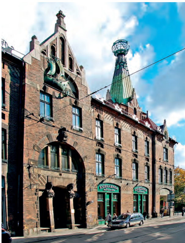
Współczesny widok gmachu Izby Przemysłowo-Handlowej w Krakowie przy ul. Długiej 1, tymczasowej siedziby Stowarzyszenia Drobnoego Handlu i Towarów Spożywczych w Krakowie, fot. Janusz Podlecki, 2003; w zbiorach MHK, nr inw. MHK-Fs17607/IX

6 W publikacji zaprezentowano zrzeszenia, których założycielami byli Żydzi, a skład mógł być mieszany, gdyż w statutach nie zawsze określano jednoznacznie wyznanie członków. Nawet najważniejsze zrzeszenie, takie jak Krakowskie Stowarzyszenie Kupców, zaznańczyło, że członkiem mógł być każdy samodzielny przemysłowiec lub kupiec bez różnicy wyznania. Rzadko zdarzało się jednak, aby do stowarzyszenia żydowskiego należeli katolicy.