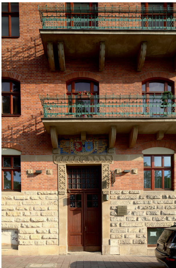
Dom Małachowskich przy ul. Piłsudskiego 36, 2012

widniejsze sygnatura: proj. H. Uziembło. Wykonał Zakład S.G. Żeleńskich R.P. 1908 . Projekt tej mozaiki został pokazany na wystawie prac Henryka Uziembły zorganizowanej w Pałacu Sztuki w Krakowie w 1909 roku 28 .