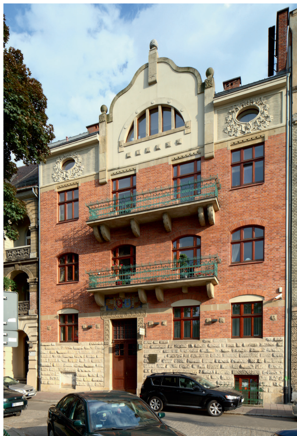
Dom Małachowskich przy ul. Piłsudskiego 36 według projektu Sławomira Odrzywolskiego, 1907–1908, fot. Tomasz Kalarus, 2012

Po roku 1905 budownictwo w Krakowie odrodziło się w szczególny sposób. Na przyłączonych do miasta nowych terenach budowano domy na tamte czasy nowoczesne, stosując nowe materiały, w tym coraz częściej żelbet. Dominowali architekci wykształceni w Berlinie, wśród nich Sławomir Odrzywolski, który studiował w latach 1860–1866 w krakowskim Instytucie Technicznym u Władysława Łuszczkiewicza i Filipa Pokutyńskiego, a następnie w latach 1866–1969 w Berlinie. Po kilku latach pracy w tym mieście pod koniec 1878 roku wrócił do Krakowa. Wkrótce został profesorem Instytutu Techniczno-Przemysłowego, z którym był związany do emerytury w 1909 roku. Przyczynił się do powstania w 1911 roku katedry architektury na krakowskiej Akademii Sztuk Pięknych, której głównymi zadaniami miało być „wytworzenie i utrzymywanie ścisłego związku pomiędzy sztukami plastycznymi oraz stworzenie wyższego kursu kompozycji architektonicznej” 3 . W 1895 roku wystąpił do Wydziału Krajowego Królestwa Galicji, który