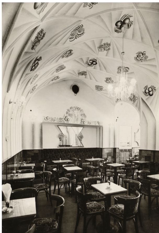
Wnętrze drugiej sali cukierni Europejskiej z 1929 r., fot. Agencja Fotograficzna „Światowid”; w zbiorach MHK, nr inw. Fs 15207/IX

Cukiernia zajmowała trzy sale konsumpcyjne oraz niezbyt duże zaplecze kuchenne w głębi lokalu i garderobę, mieszczącą się w części specjalnie w tym celu zabudowanej