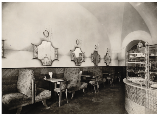
Wnętrze pierwszej sali cukierni Europejskiej z 1929 r.