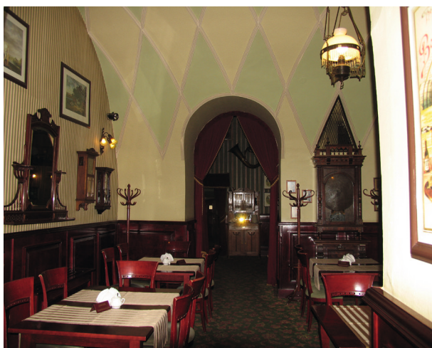
Współczesne wnętrza kawiarni Europejskiej

Nowy właściciel – firma Gastronomika s.c. Kawiarnia Europejska, miał utrzymać zabytkowy, historyczny wystrój wnętrza z zachowaniem elementów pozostawionych w lokalu, takich jak dekoracja stiukowa czy kratki wentylacyjne oraz odkupić od GTSS Spółem zabytkowe elementy wyposażenia, tj. lustra, kinkiety, żyrandole oraz barek, a także na swój koszt zlikwidować szatnię zajmującą część sieni oraz przeprowadzić remont zajmowanych piwnic 50 .