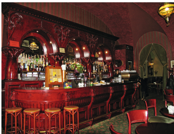
Kawiarnia Europejska dzisiaj