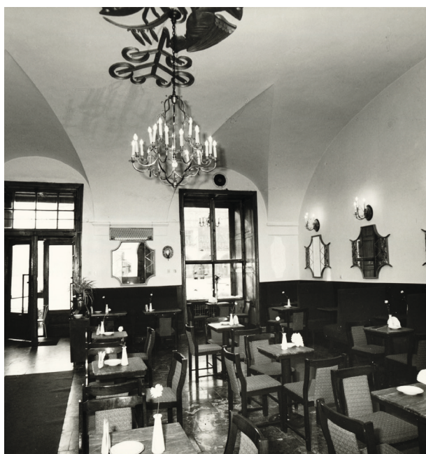
Wnętrze kawiarni Europejska, ok. 1987, fot. A. Wierzbicki; w zbiorach MHK, nr inw. MHK-Fs 18595/IX

Kawiarnia Europejska, zajmująca w pałacu Pod Krzysztoforą lokal na parterze po lewej stronie sieni, istnieje już od przeszło 80 lat. Przez ten czas zmieniała zarówno właścicieli, jak i wystrój – z kawiarni-cukierni w stylu art déco stała się kawiarnią-restauracją w stylu wiedeńskich lokali z początku XX wieku. Nadal funkcjonuje w tym samym miejscu, kultywując kawiarniano-restauracyjne tradycje pałacu, sięgające lat siedemdziesiątych XIX stulecia.