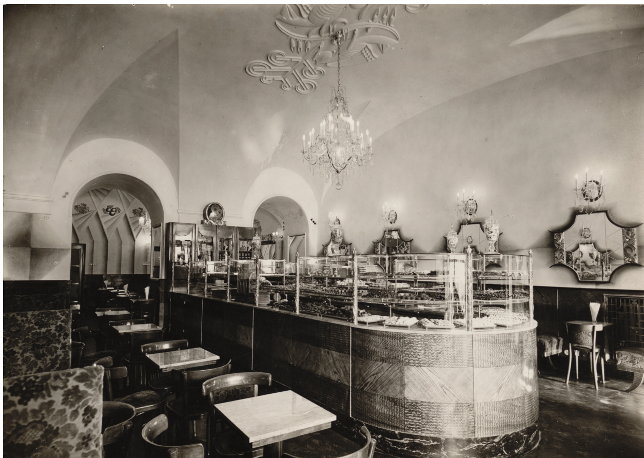
Wnętrze pierwszej sali cukierni Europejskiej z 1929 r., fot. Agencja Fotograficzna „Światowid”; w zbiorach MHK, nr inw. MHK-Fs 7808/IX

W 1913 roku żywo zaangażowany w akcję wyburzenia Krzysztoforów Gustaw Gerson Bazes, po 41 latach istnienia dobrze prosperującego sklepu postanowił go zamknąć, ogłaszając na łamach prasy całkowitą wyprzedaż towarów 12 .