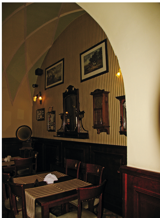
Współczesne wnętrza kawiarni Europejskiej