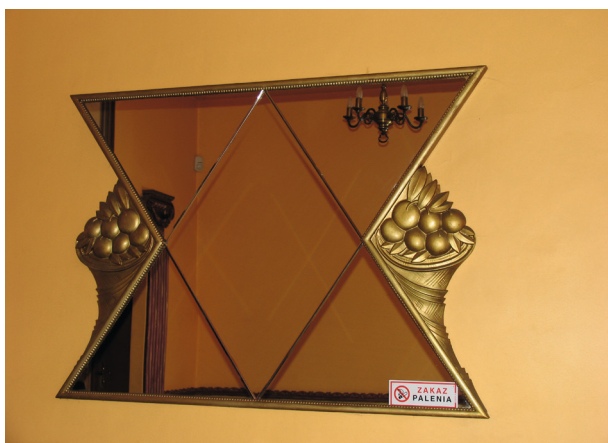
Oryginalne lustro z rogami obfitości z cukierni Europejskiej znajdujące się w restauracji Ermitaż