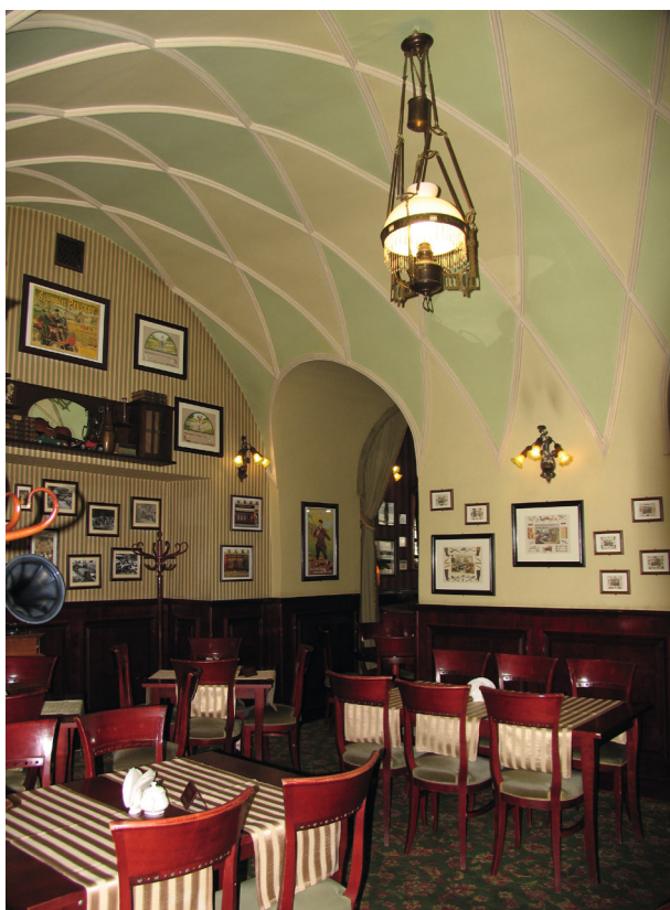
Współczesne wnętrza kawiarni Europejskiej