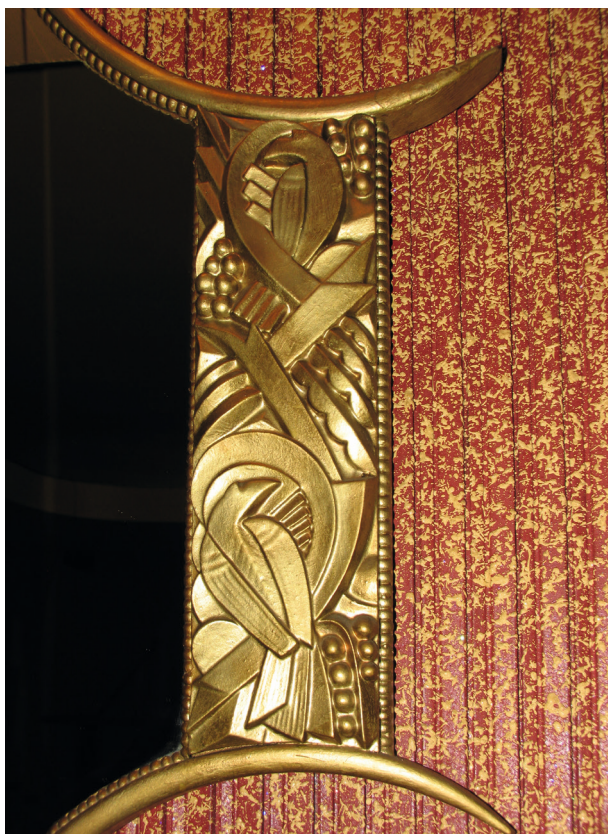
Detal lustra z cukierni Europejskiej, fot. K. Biecuszek