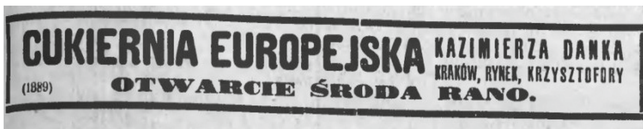
Ogłoszenie w „Czasie” z 5 września 1929 r.