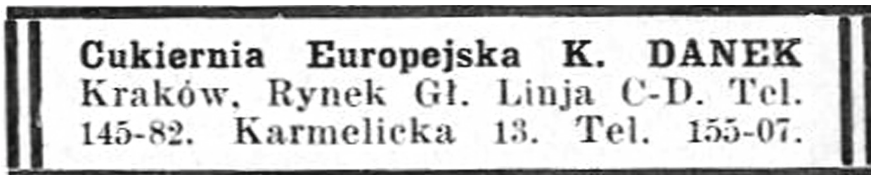
Reklama cukierni w „Księdze adresowej” z lat 1933–1934

ścian ustawione były kanapy na drewnianych, wygiętych nogach 18 i o obiciach wykonanych z jasnej tkaniny wytłaczanej w ciemniejszy, kwiecisty wzór. Pomiędzy kanapami stały prostokątne stoliki o podwójnej nodze, nakryte marmurowymi blatami – po pięć przy każdej ze ścian, a przy nich po jednym krzesła. Ponadto po lewej stronie bufetu, wzdłuż kanap, znajdował się rząd pięciu kwadratowych stolików na pojedynczej nodze, przy których stały po trzy krzesła.