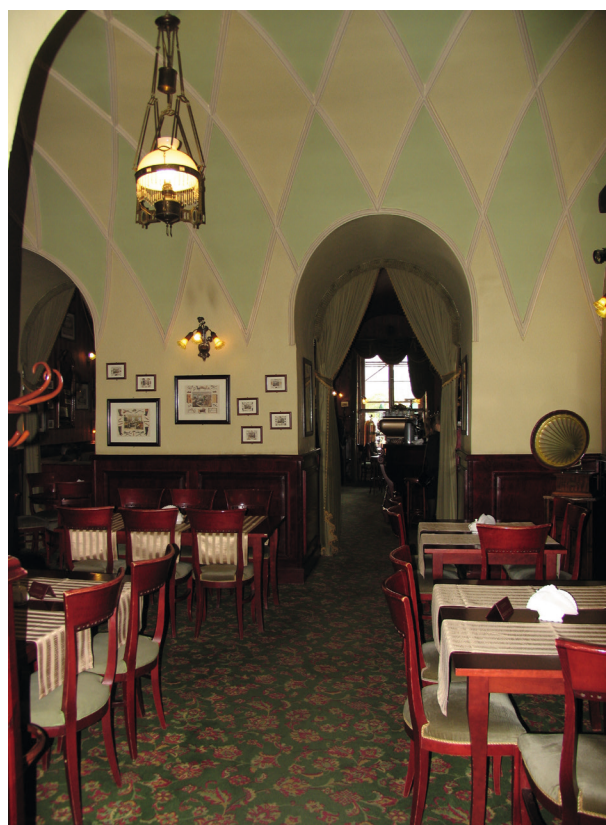
Współczesne wnętrza kawiarni Europejskiej

Zmiana ustroju w Polsce przyniosła kolejne zmiany w kawiarni Europejskiej, która jako jeden z ostatnich, ważniejszych lokali gastronomicznych Krakowa przeszedł spod zarządu Gastronomiczno Turystycznej Spółdzielni Spożywców Spółem w ręce firmy prywatnej. Muzeum Historyczne Miasta Krakowa z 31 stycznia 1997 roku wypowiedziało umowę najmu dotychczasowemu użytkownikowi lokalu 47 i tym samym zamknął się kolejny rozdział w dziejach kawiarni.