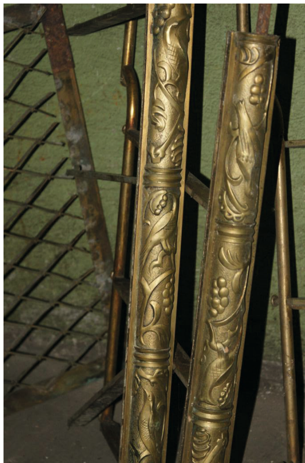
Fragmety mosiężnych elementów gabloty, dekorowanych ptakami oraz winoroślą

Krakowa Śródmieścia, który to stwierdził, że nie widzi możliwości likwidacji kawiarni Europejskiej ani jej przeniesienia w inne miejsce „ze względu na swoją specyficzną lokalizację w Rynku Głównym oraz jej długoletnią tradycję” 39 . W ten sposób sprawa została przynajmniej na pewien czas zamknięta, a program użytkowania Krzysztoforów zmieniono w zakresie pomieszczeń zajmowanych przez kawiarnię. Jedynie nadal projektowano likwidację szatni, która dysharmonijnie wciniała się w sieni, zniekształcając jej pierwotny kształt; tak powstały otwór zamierzano zamurować, zrównując z licem ściany.