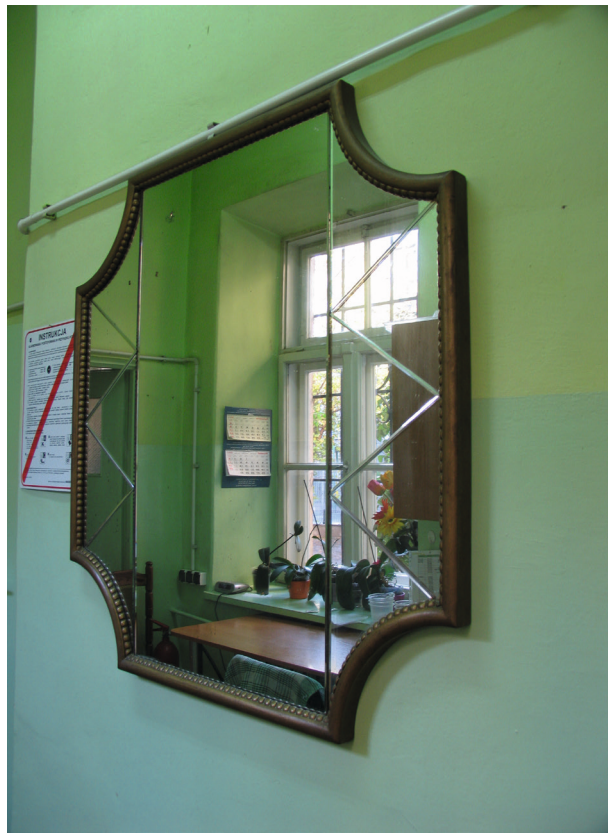
Oryginalne lustro z cukierni Europejskiej znajdujące się na zapleczu baru Krakus

Otwarcie cukierni Europejskiej nastąpiło 11 września 1929 r. „we środę rano”, o czym informowało krótkie ogłoszenie na pierwszej stronie „Czasu” z 5 września 20 .