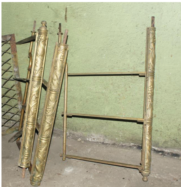
Pozostałość bufetu cukierni Europejska, fot. J. Łaszczuk

światową mieściła się restauracja Hawelka 36 . Propozycja ta spotkała się ze sprzeciwem ze strony Muzeum, prawnego użytkownika pałacu, które pragnęło, aby kawiarnia została całkowicie wyprowadzona w budynku 37 . W „Programie użytkowania zabytkowego pałacu Pod Krzysztoforą” z 1975 roku czytamy, że planowano wyburzyć prowizoryczne ściany kawiarnianej szatni znajdującej się w sieni i zgodnie z postulatami Miejskiego Konserwatora Zabytków połączyć sieni z największą salą Europejskiej otwartym przejściem, uzyskując w ten sposób pomieszczenie na ekspozycję muzealną powozów, karoc, dorożek itp. Pozostałe sale po kawiarni zamierzano przeznaczyć na zejścia do kondygnacji podziemnej, szatni, węzła sanitarnego oraz zaplecza dla klubu Teatru Lokatora 38 .