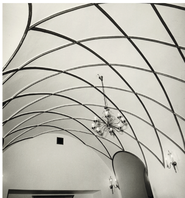
Fragment sklepienia kawiarni Europejska, ok. 1987