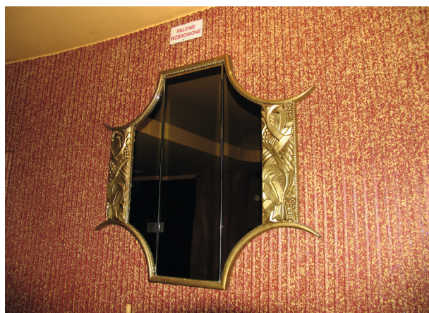
Oryginalne lustro z rajsłkimi ptakami wśród winorośli z cukierni Europejskiej znajdujące się w restauracji Ermitaż