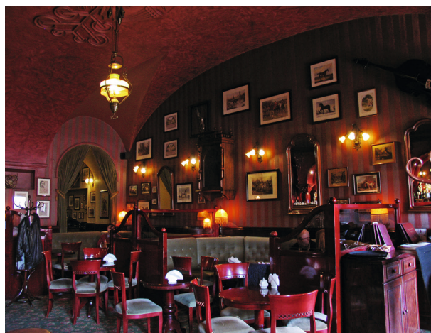
Kawiarnia Europejska dzisiaj

secesyjne, nowe meble stylizowane oraz meble wykonane na zamówienie (jak bar, którego tylną ścianę tworzą trzy arkady wsparte na kolumnach). Uzupełnieniem wystroju są stylizowane na secesyjne żyrandole i kinkiety oraz liczne stare instrumenty muzyczne oraz kolorowe grafiki i rysunki.