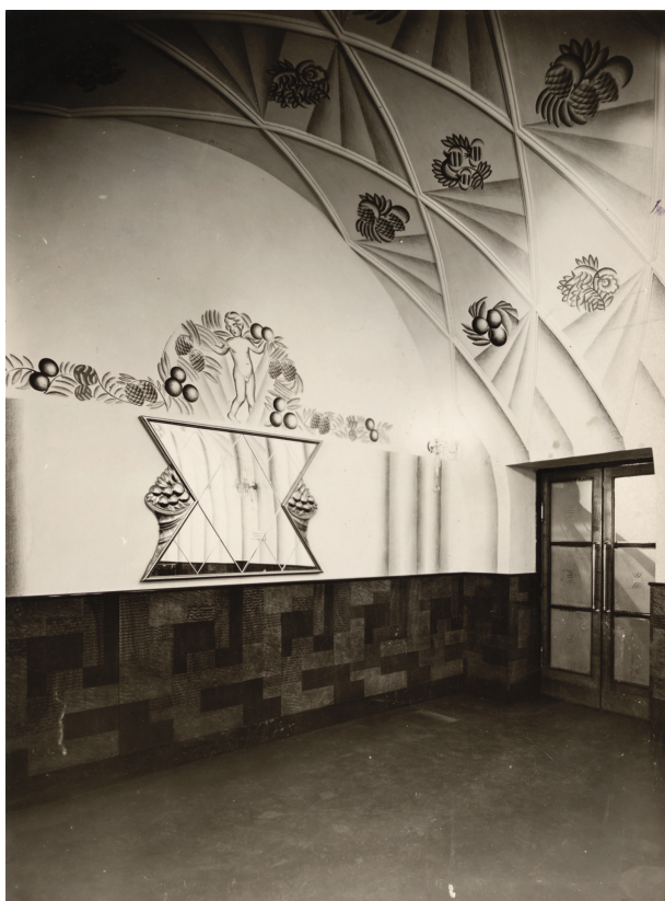
Wnętrze drugiej sali cukierni Europejskiej z 1929 r., nr inw. MHK-Fs 7806-1/IX

datą 16 lutego 1928 roku. Projekt zakładał zlikwidowanie drewnianej witryny po sklepie Bazesa i wykonanie profilowanych, kamiennych obramień wokół otworów okiennego i drzwiowego. Po przeanalizowaniu sprawy został ostatecznie zatwierdzony 13 lipca 1929 roku i w niecałe dwa miesiące zrealizowany, gdyż kontrola komisji policyjno-budowlanej przeprowadzona 5 września orzekła, że „przebudowa portalu sklepowego wykonana została zgodnie z planami zatwierdzonymi rozporządzeniem Magistratu z 15 kwietnia 1929 roku” i 26 września został wydany „konsens” na jego użytkowanie 16 .