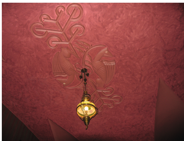
Oryginalna, stiukowa dekoracja sklepienia w pierwszej sali kawiarni, w postaci zgeometryzowanych gryfów i motywów roślinnych

ne wykonane były bowiem prowizorycznie w ścianach kuchni z wyprowadzeniem ich do sieni oraz na klatkę schodową, co skutkowało zawilgoceniem murów (para wodna z kuchni) oraz było źródłem uciążliwych, kuchennych zapachów 42 .