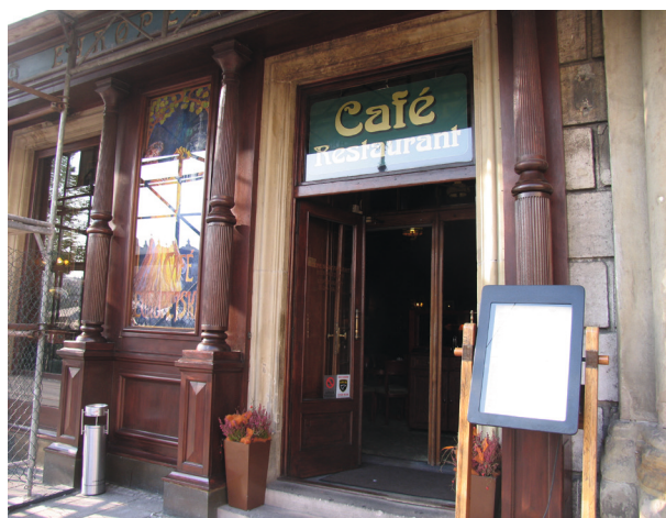
Wejście do kawiarni Europejskiej

Do naszych czasów pierwotny, artdecowski wystrój eleganckiej krakowskiej cukierni Europejskiej przetrwał tylko na kilku fotografiach „Ilustrowanego Kuriera Codziennego” z 1929 roku i w paru scenach 10. odcinka Stawki większej niż życie z 1968 roku. In situ z bogatego wyposażenia wnętrza, projektowanego indywidualnie, z dużym wyczuciem smaku i niezwykłą dbałością o szczegóły, pozostały jedynie sztukaterie na sklepieniach, cztery kratki wentylacyjne oraz stolarka okienna i drzwiowa. Lustra, będące charakterystycznym elementem wystroju tego lokalu ocalały tylko trzy – po jednym z każdego rodzaju. Dwa z nich, jedno z rogami obfitości a drugie z ptakami wśród winorośli, o odnowionych ramach i wymienionych lustrzanych taflach, można podziwiać w restauracji Ermitaż przy ulicy Lubicz 15, a trzecie z ramą zdobioną ornamentem perełkowym, zachowało się