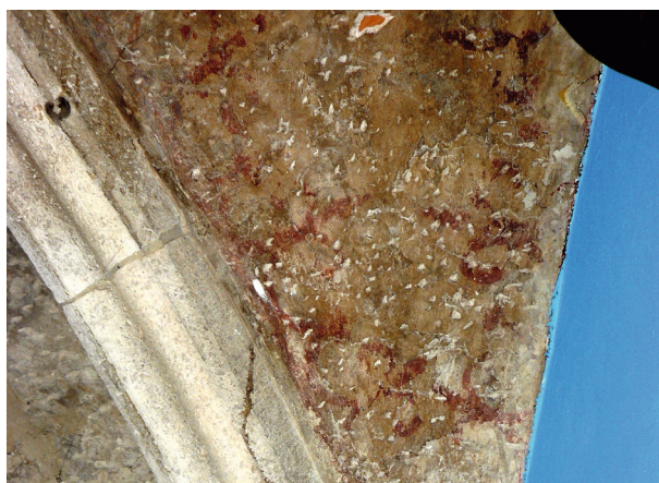
Rynek Główny 23, fragment późnogotyckiej dekoracji malarskiej z końca XIV w., fot. I. Palca

fragment sceny figuralnej w drugiej kondygnacji oficyny domu przy ulicy Mikołajskiej 4 z przełomu XIV i XV wieku 14 . W trakcie prac konserwatorskich prowadzonych w latach sześćdziesiątych XX wieku odsłonięto, także szcążkowo zachowaną, późnogotycką polichromię o motywach roślinno-architektonicznych z przełomu XV i XVI wieku, znajdującą się w górnej części ścian przedostatniego pomieszczenia na parterze kamienicy przy Ryнку Głównym 15 . Również slyn-