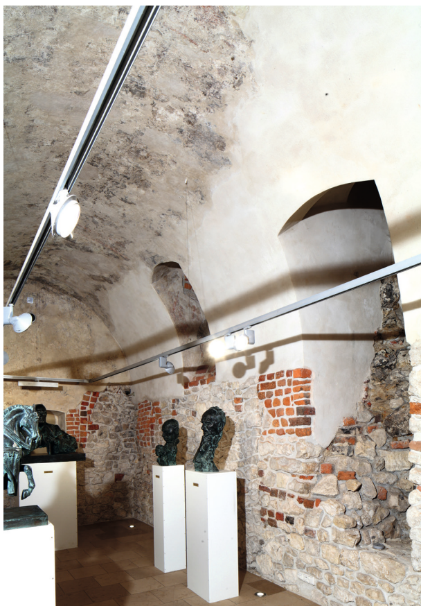
Rynek Główny 35, widok komory piwnicznej z polichromią, strona północno-zachodnia, fot. T. Kalarus