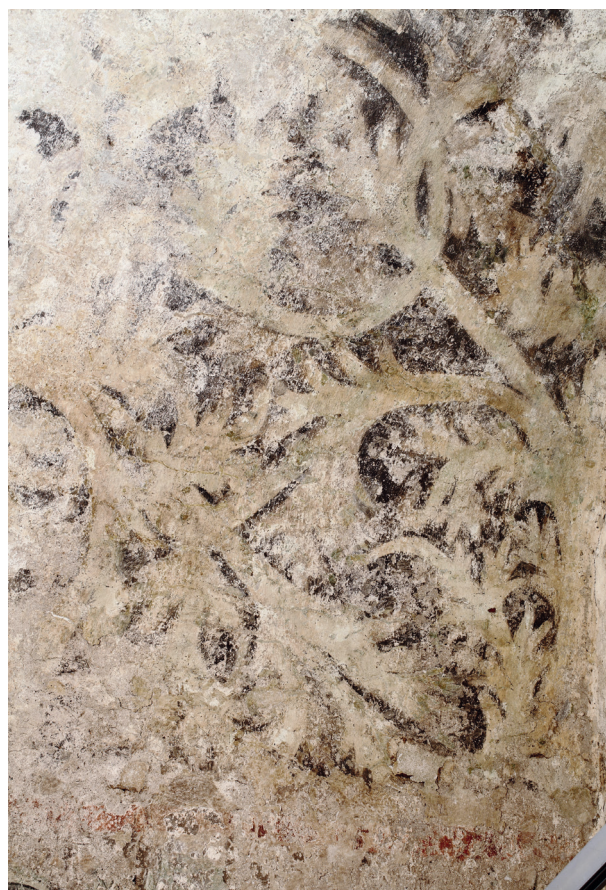
Rynek Główny 35, fragment polichromii z motywami roślinnymi na sklepieniu od strony południowo-zachodniej, XV/XVI w.

Sklepienie. Tynkiem pokryte było całe sklepienie, największe ubytki są na sklepieniu kolebkowym. Kompozycja malarska jest miejscami dobrze zachowana i czytelna, jest według innej zasady niż na fryzie. Tła są ciemne, prawdopodobnie pierwotnie błękitne, wypełnione wicią roślinną z elementami akantowymi, malowane w inny sposób niż na fryzie. Całe sklepienie pokrywa sieć splotów grubych łodyg z licznymi, niekiedy spiralnymi odgałęzieniami. Od nich rozchodzą się liście stylizowanego akantu o bogatych, głęboko wycinanych formach, czasem z wyraźnie zaznaczoną linią nerwu dzielącego liść na dwie symetryczne połowy i podobnie większe odgałęzienia. Liście obwiedzione są czarną linią, malowane w ciepłym odcieniu zieleni łączonym z barwą jasnożółtą, również w ciepłej tonacji. Niestety