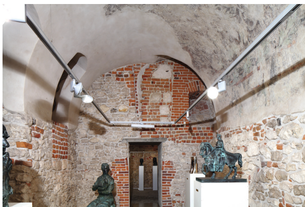
Rynek Główny 35, widok komory piwnicznej z polichromią, strona wschodnia