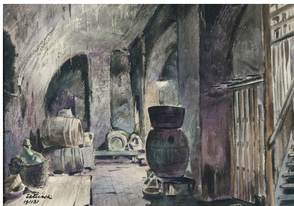
Franciszek Turek, Wnętrze piwnicy domu przy ulicy Sławkowskiej 26; w zbiorach MHK, nr inw. MHK-2978/III

Jak pisał Adam Chmiel, „(...) wiadomo, że piwnice frontowe kamienicy krakowskich były dawniej zamieszkałe, a najczęściej używane na sklepy, w których sprzedawano i szykowano wino, wódkę itp. Miały te piwnice wejścia z ulicy” 5 . Stąd zapewne bogate sklepienie piwnicy i rzeźbione zworniki przy Rynku Głównym 23, które Tadeusz Dobrowolski datował na około 1385 rok 6 , zaś Jerzy Gadomski wymienił piwnicę jako przykład stuby inferior – sali dolnej, która w XIV i XV wieku była pomieszczeniem usytuowa-