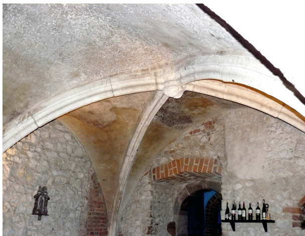
Rynek Główny 23, piwnica ze sklepieniem żebrowym z końca XIV w.

Prowadzone w okresie międzywojennym, a szczególnie po II wojnie światowej, prace badawcze architektoniczne i konserwatorskie ujawniły interesujące odkrycia w kamienicach krakowskich i przyniosły zdecydowany postęp w poznaniu historii dawnej zabudowy Krakowa, także przyrynkowej 10 . Nie wszystkie wyniki badań zostały opublikowane, wiele cennych informacji znajduje się w dokumentacjach architektonicznych zgromadzonych w archiwum Wojewódzkiego Urzędu Ochrony Zabytków w Krakowie w Krakowie.