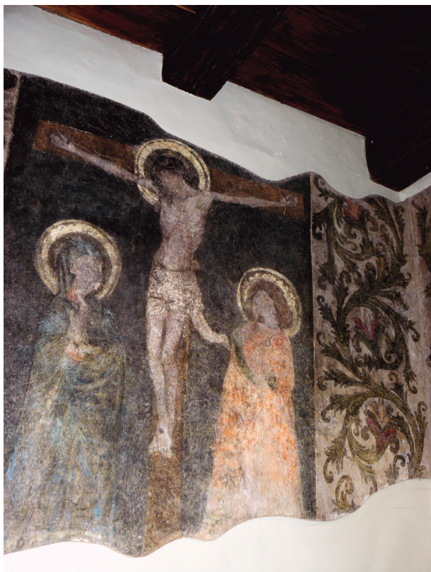
Ulica Mikołajska 2, Ukrzyżowanie, ok. 1420–1430, parter, ściana wschodnia, fot. I. Palca

Przypomnijmy, że w wyniku prowadzonych prac odsłonięto zamurowane wyjście z przedproży do Rynku zlikwidowane