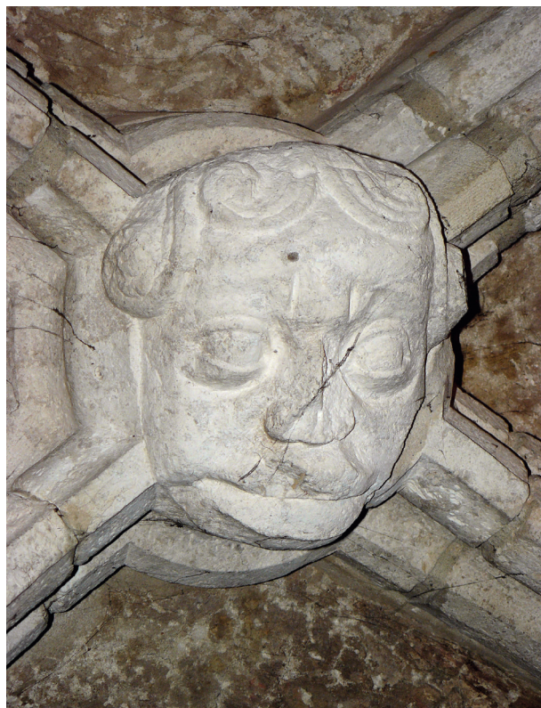
Rynek Główny 23, maska na zworniku sklepienia w piwnicy z ok. 1385 r.

Dowodem na to są fragmenty XIV-wiecznej dekoracji malarskiej odsłoniętej podczas prac konserwatorskich prowadzonych w latach dziewięćdziesiątych XX wieku na sklepieniu piwnicy w trakcie frontowym wspomnianej wcześniej kamienicy przy Rynku Głównym 23. Zidentyfikowano motyw połączonych lilii w kolorze czerwieni na jasnym tle, a szare tło pola środkowego wypełniały elementy roślinne w kolorach ugrowych, zielonych i czarnych 11 .