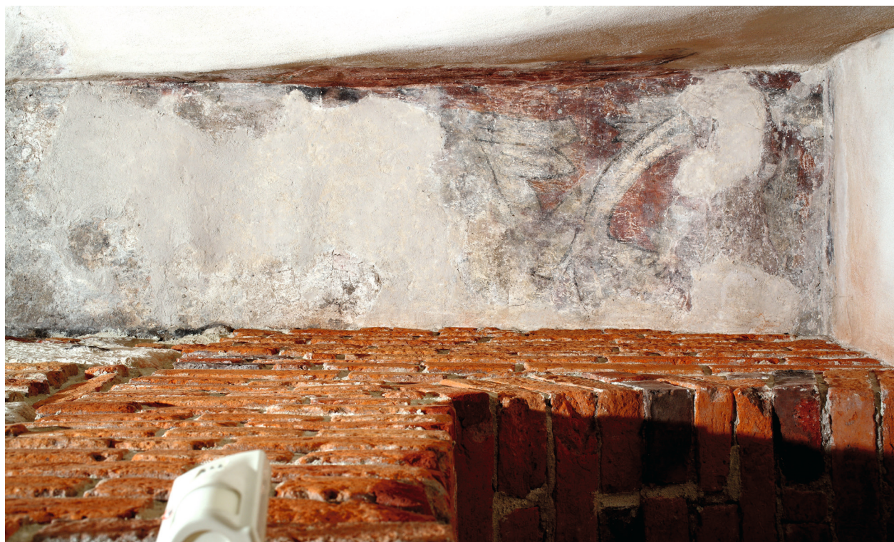
Rynek Główny 35, fragment polichromii na sklepieniu od strony wschodniej, XV/XVI w.

„Altanowe” wnętrza ze stylizowaną wicią roślinną z liśćmi to typowa dekoracja późnogotycka stylizacja akantu występująca w Europie. Liczne przykłady tego typu dekoracji zachowały się w Polsce, Czechach, na Słowacji, Śląsku. Występuje w malarstwie miniaturowym, grafice, snycerce oraz w malarstwie ściennym. Paweł Pencakowski podaje przykład dekoracji stropu kościoła parafialnego św. św. Szymona i Judy Tadeusza w Kozach w powiecie bielskim (obecnie w Muzeum Narodowym w Krakowie). Na roślinnym tle często umieszczano postacie świętych, różne wersje Sacra Conversazione, symbole religijne, monogramy. Innym przykładem jest wspomniane wcześniej przedstawienie Matki Boskiej z Dzieciątkiem, św. Mikołajem i św. Dorotą znajdujące się na ścianie zachodniej pomieszczenia parteru kamienicy przy ulicy Mikołajskiej 2 w Krakowie, datowane na około 1420–1430 31 . Przedstawienia te są umieszczone na tle bujnej, niekończącej się wici akantu, porastającej ściany.