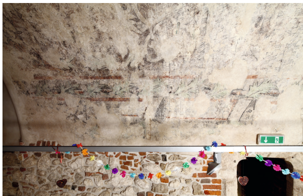
Rynek Główny 35, fragment sklepienia i ściany z motywami roślinnymi i architektonicznymi polichromii późnogotyckiej, XV/XVI w., fot. T. Kalarus

Wokół odspojonych płatów tynku założono opaski zabezpieczające, wykonano wzmocnienie i impregnację tynku, przeprowadzono konsolidację odspojonych tynków z podłożem, uzupełniono warstwy pobiałą oraz dokonano niewielkich uzupełnień warstwy malarskiej poprzez punktowanie ograniczone do koniecznego minimum, bez rekonstrukcji, z pozostawieniem przetarć warstwy malarskiej, kolorem lokalnym 26 . Ze względu na występowanie wilgoci i grzybów pleśniowych zlecono badania mikrobiologiczne oraz wykonano działania zmierzające do eliminacji zagrożeń 27 .