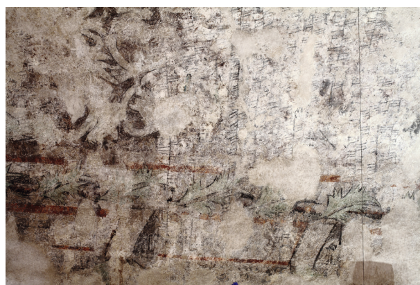
Rynek Główny 35, fragment dekoracji późnogotyckiej

pigmenty wyblakły i straciły lub zmieniły kolor, dlatego tła późnogotyckich wici oraz sama wic są różne w różnych częściach sali. Całość dekoracji przypomina „altanę”. Zauważa się pewne różnice stylistyczne pomiędzy ornamentem występującym na sklepieniu od strony zachodniej i ornamentem od strony południowej, co mogłoby wskazywać na dwie warstwy malarskie. Wskazują na to również badania stratygraficzne, które datują motyw wici roślinnej na około 1520 rok, a kratownicy, dość ogólnie, na XVI wiek.