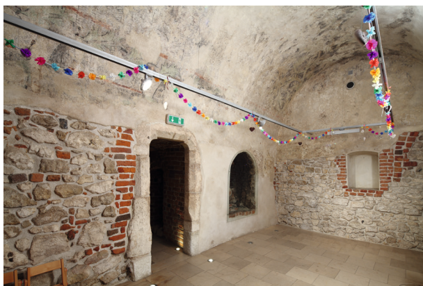
Rynek Główny 35, widok komory piwnicznej z polichromią, strona północno-zachodnia, XV/XVI w.