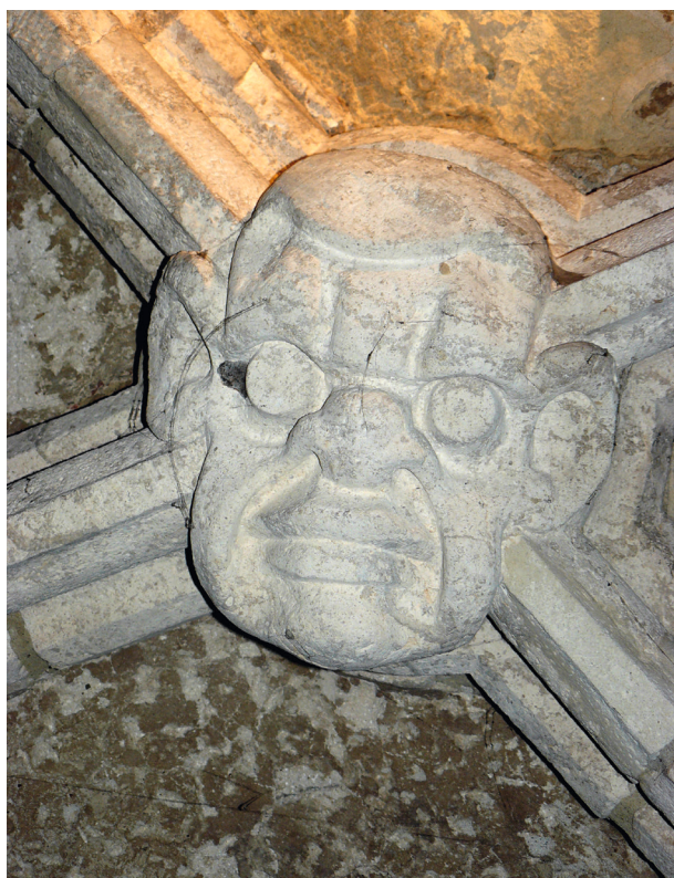
Rynek Główny 23, maska na zworniku sklepienia w piwnicy z ok. 1385 r.

fragment sceny figuralnej w drugiej kondygnacji oficyny domu przy ulicy Mikołajskiej 4 z przełomu XIV i XV wieku 14 . W trakcie prac konserwatorskich prowadzonych w latach sześćdziesiątych XX wieku odsłonięto, także szcążkowo zachowaną, późnogotycką polichromię o motywach roślinno-architektonicznych z przełomu XV i XVI wieku, znajdującą się w górnej części ścian przedostatniego pomieszczenia na parterze kamienicy przy Ryнку Głównym 15 . Również slyn-