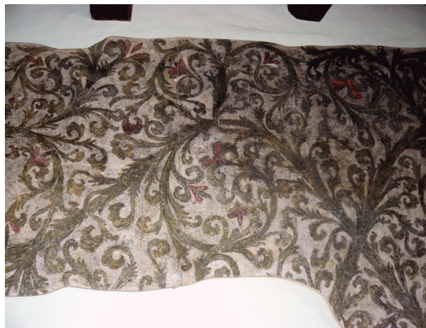
Ulica Mikołajska 2, polichromia późnogotycka, ok. 1420–1430, parter