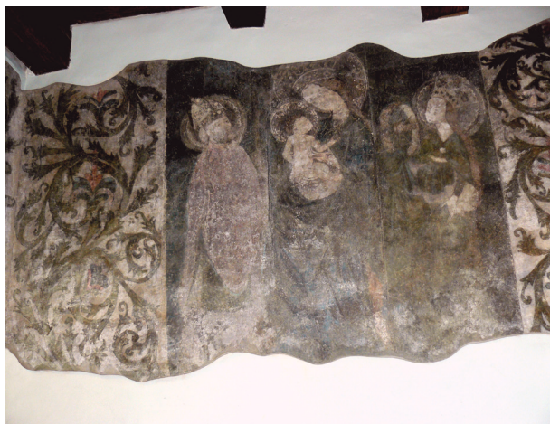
Ulica Mikołajska 2, Matka Boska z Dzieciątkiem, św. Mikołajem i św. Dorotą, ok. 1420–1430, parter, ściana zachodnia