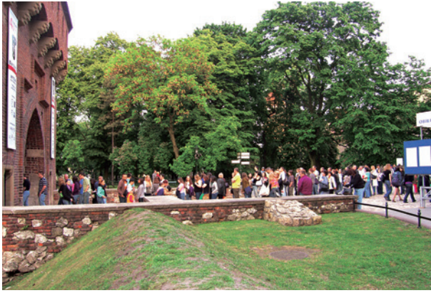
Noc Muzeów – kolejka chętnych do zwiedzenia Barbakanu, 15 maja 2009 r.; fot. J. Korzeniowski

Salwiński, redakcja Jolanta Trześniowska) była książka Kraków – czas okupacji 1939–1945 , towarzysząca wystawie pod tym samym tytułem. Publikacja ta miała na celu przybliżenie efektów prac zespołu scenariuszowego wystawy stałej przy ulicy Lipowej 4, prowadzonych w latach 2007–2009. Autorzy przygotowali kilkanaście esejów omawiających obszernie wszystkie zasadnicze tematy podejmowane w programie wystawy Kraków – czas okupacji 1939–1945 .