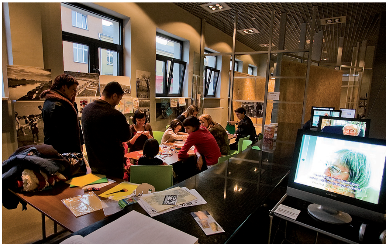
Zajęcia dla dzieci w Fabryce Emalia Oskara Schindlera, Dzień Otwartych Drzwi, 22 listopada 2009 r.