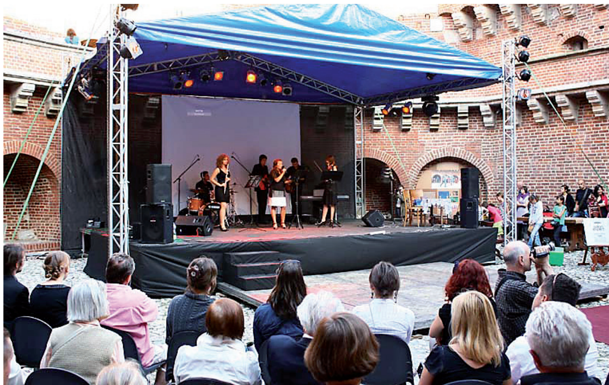
Ta ostatnia niedziela, impreza w Barbakanie promująca projekt muzeum w Fabryce Emalia Oskara Schindlera, 30 sierpnia 2009 r.