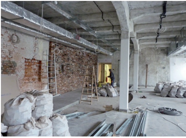
Prace budowlane przygotowujące do realizacji projektu wystawy Kraków – czas okupacji 1939–1945, styczeń 2010 r.