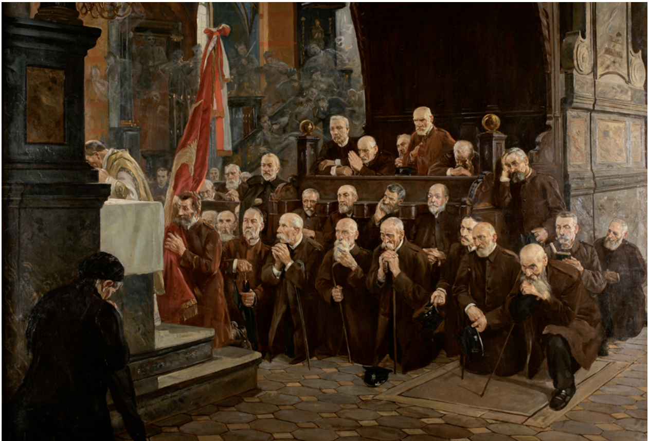
Msza weteranów powstania styczniowego, W. Wodzinowski, 1910 r.; fot. T. Kalarus, nr inw. MHK 6008/III

Zespół projektowy MHK Rynek Podziemny (kierownik projektu Łukasz Walas, kurator wystawy Elżbieta Firlet) opracował i przekazał 21 lipca 2009 roku ZIKiT-owi dokumentację niezbędną do realizacji projektu wystawy jako zasadniczej części trasy turystycznej w podziemiach Rynku Głównego. Były to: