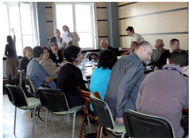
Robocze spotkanie zespołu projektowego wystawy stałej Kraków – czas okupacji 1939–1945 z dyrekcją MHK, 8 kwietnia 2009 r.

W ostatnich dniach roku wyłoniono wykonawcę prac aranżacyjnych na wystawie. Również w tym przypadku prace powierzono firmie Łęczęprzem.