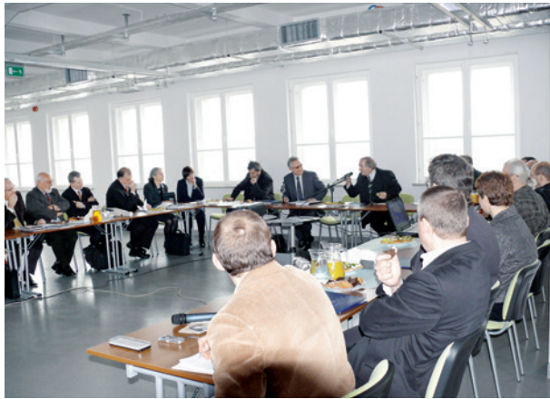
Posiedzenie Rady Programowej Muzeum w Fabryce Emalia Oskara Schindlera, wypowiada się S. Dziedzic, dyrektor Wydziału Kultury i Dziedzictwa Narodowego UMK, 12 lutego 2009 r.