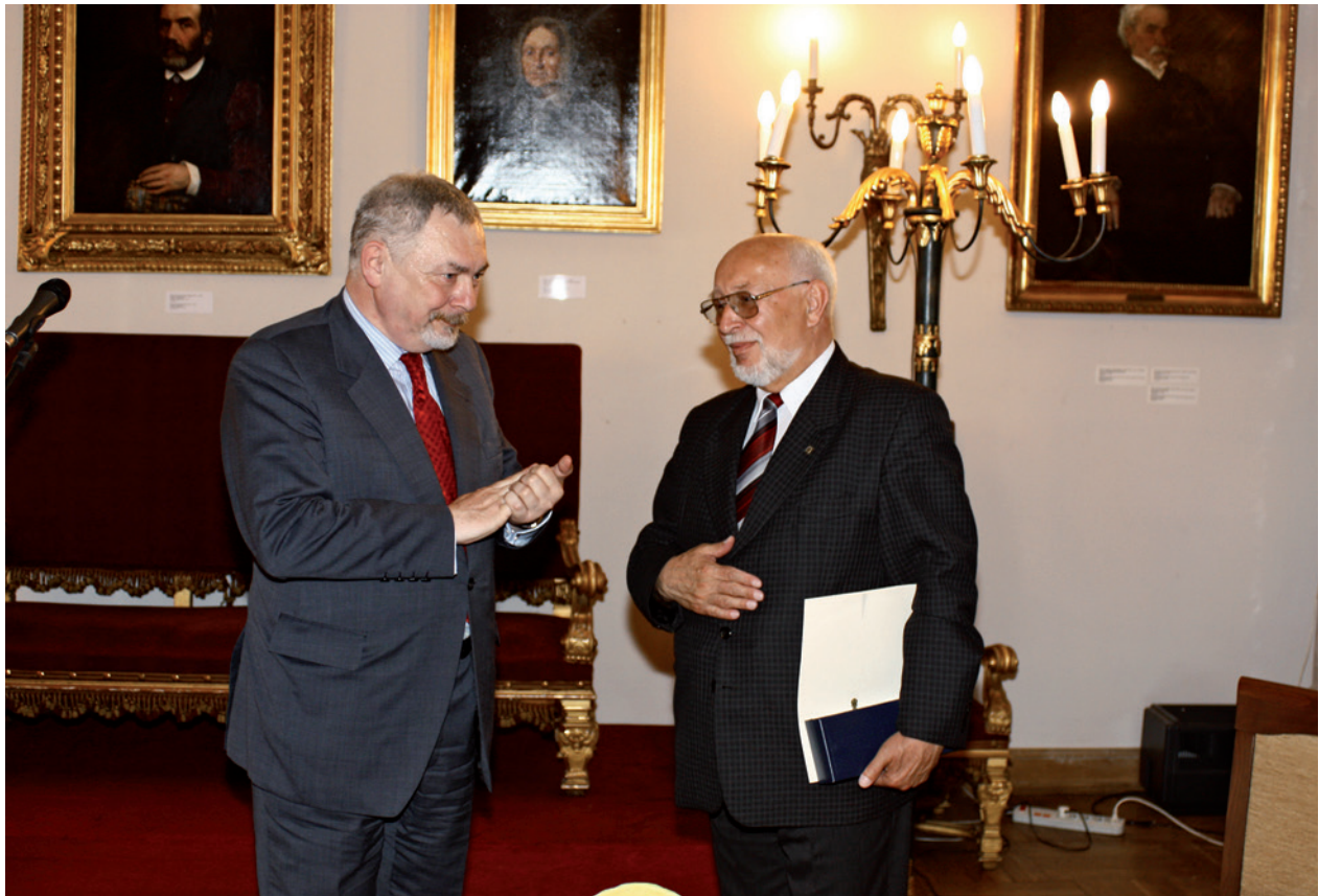
Pożegnanie odchodzącego na emeryturę wicedyrektora MHK W. Passowicza przez prezydenta Krakowa J. Majchrowskiego, Pałac Krzysztofory, Dzień Muzealnika, 26 maja 2009 r.

Kraków – dziedzictwo wieków (album z okazji 750. rocznicy lokacji Krakowa).