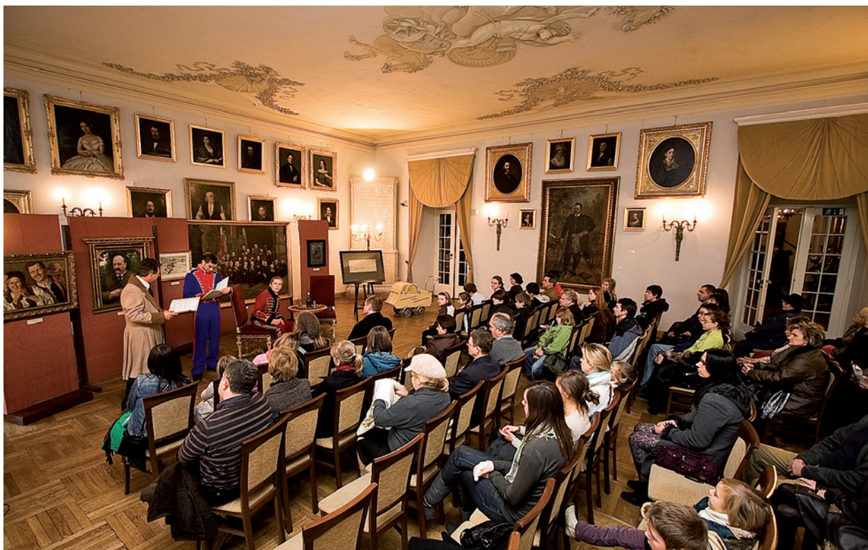
Wizyta księcia Józefa Poniatowskiego w Pałacu Krzysztofora, inscenizacja historyczna, Dzień Otwartych Drzwi, 22 listopada 2009 r.