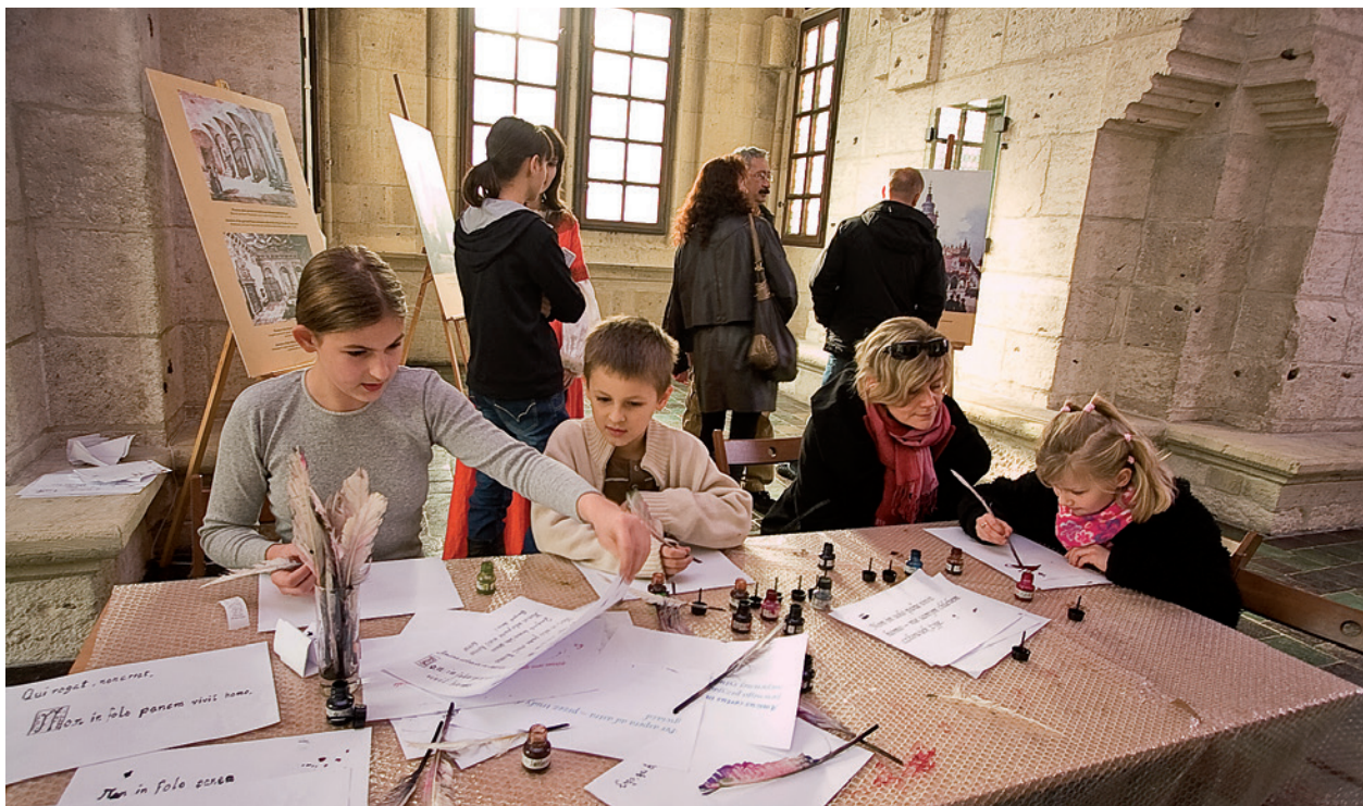
Spotkanie ze skrybą, warsztaty w Wieży Ratuszowej, Dzień Otwartych Drzwi, 22 listopada 2009 r.; fot. T. Kalarus