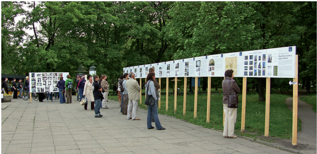
Noc Muzeów, wystawa plenerowa na placu Inwalidów, 15 maja 2009 r.