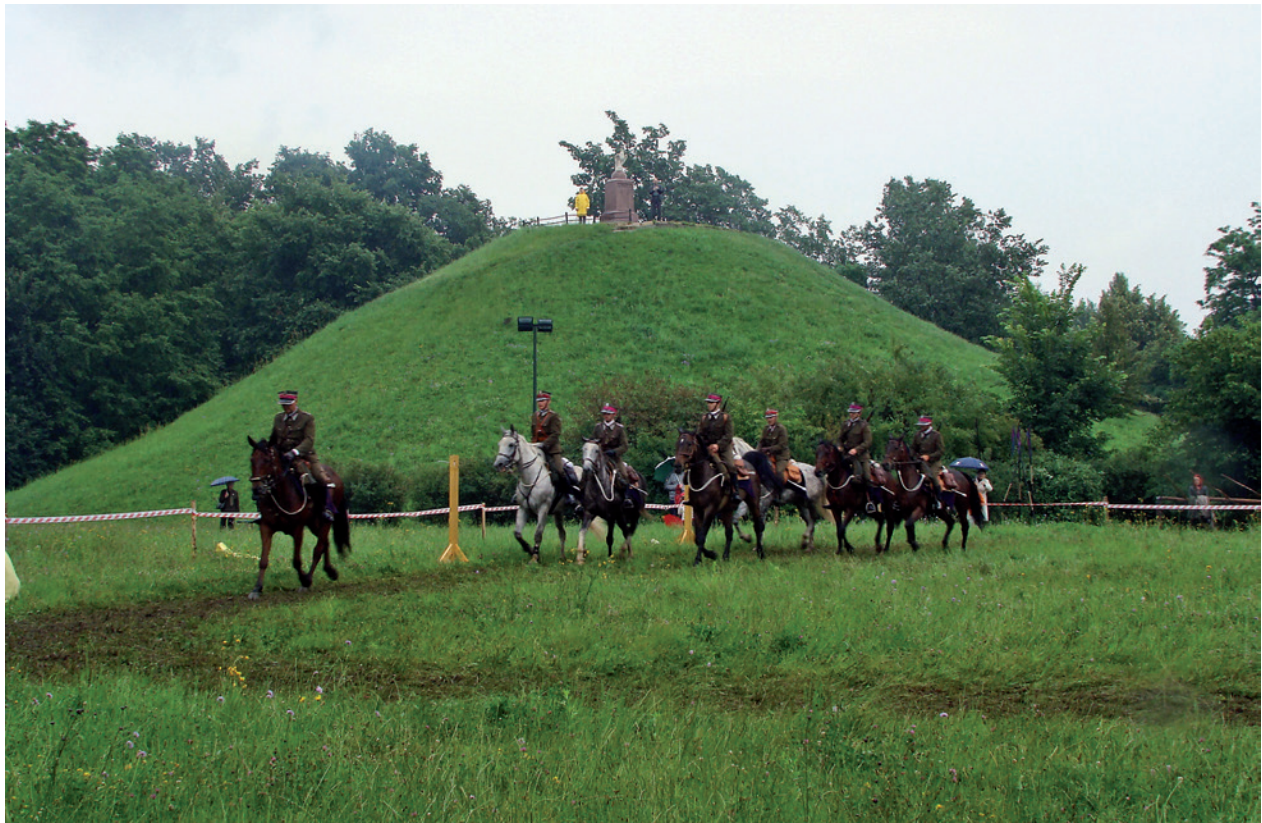
Zajrzyj do Huty. Festyn ułański, zorganizowany nieopodal Kopca Wandy, 21 czerwca 2009 r.

pacji 1939–1945 w Fabryce Emalia Oskara Schindlera oraz Rynek Podziemny , których merytoryczne koncepcje zostały zaakceptowane zarówno przez Radę Muzeum Historycznego Miasta Krakowa, jak i Radę Programową Muzeum w Fabryce Emalia Oskara Schindlera.