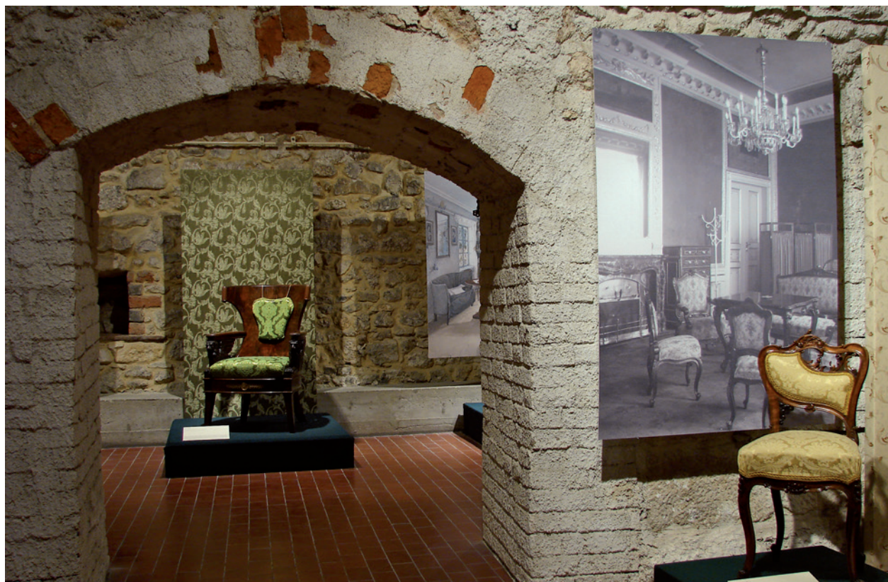
Od empiru do art déco. Taborety, krzesła, fotele, wystawa w piwnicach Kamienicy Hipolitów; fot. L. Biały

Szkice z dziejów Łuczanowic. Praca zbiorowa. Red. Magdalena Fryźlewicz. Kraków 2009. Materiały konferencyjne, 60 s., format 16,5 x 21,5 cm;