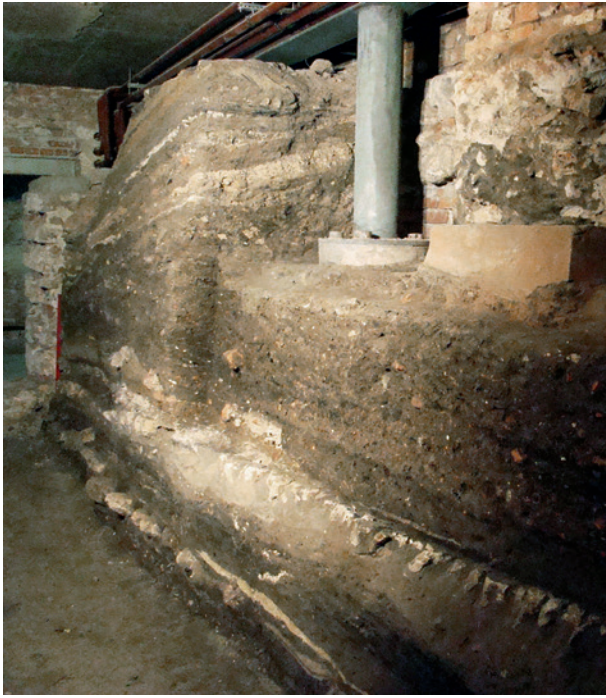
Ryc. 3. Kraków – Rynek Główny, krzyż Sukiennic, wykop 31. Późnośredniowieczne nawarstwienia i poziomy użytkowe w północno-zachodniej części krzyża Sukiennic nad domniemanym pochówkiem konia. Widok od południowego wschodu