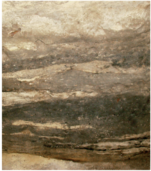
Ryc. 4. Kraków – Rynek Główny, krzyż Sukiennic, wykop 31. Nawarstwienia wypełniające wkop z domniemanym pochówkiem konia. Widok od południa

średniowiecznej nekropoli lub na terenie sąsiadującej z nią osady najpóźniej pod koniec XI lub na początku XII stulecia.