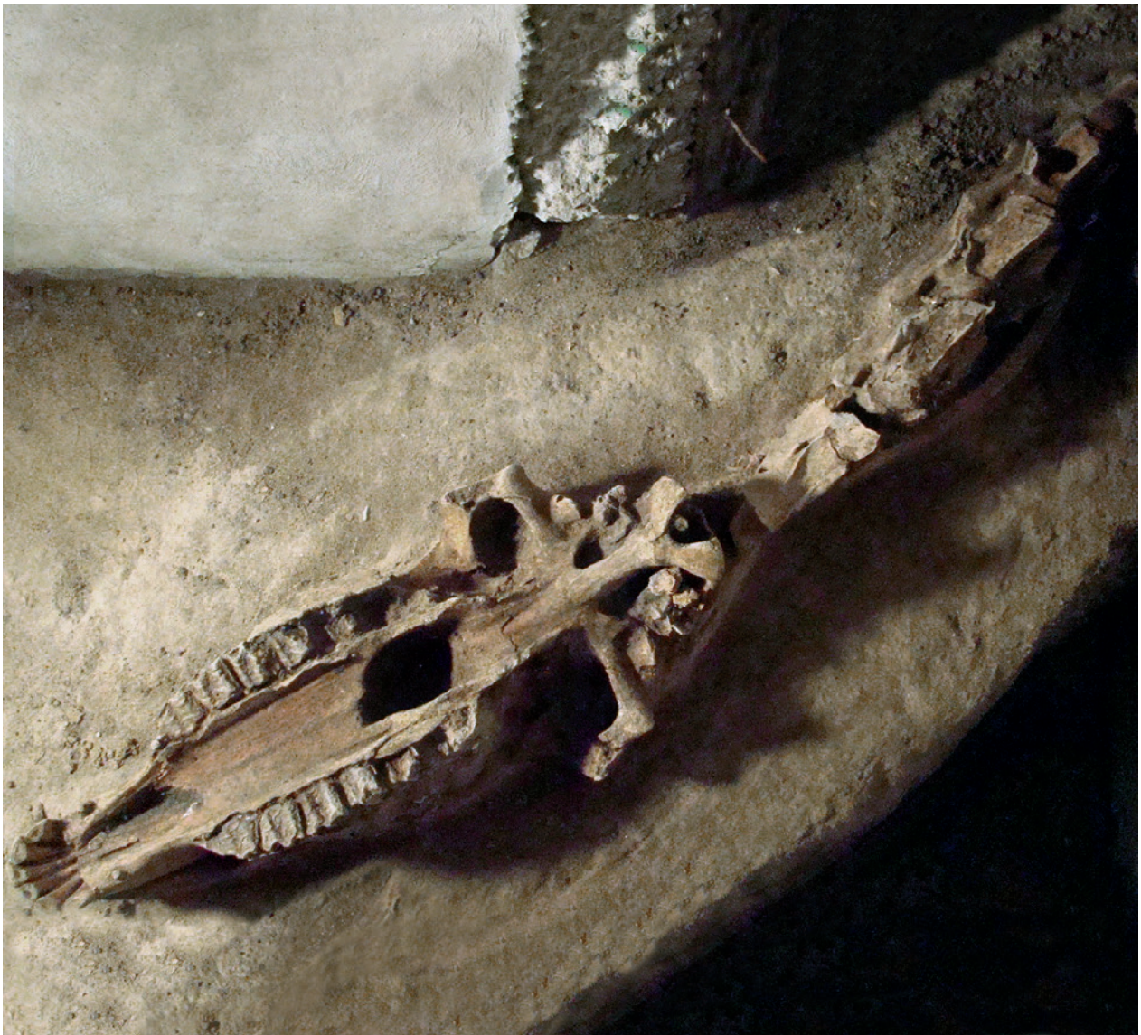
Ryc. 5. Kraków – Rynek Główny, krzyż Sukiennic, wykop 31. Szczątki głowy i szyi konia nad dnem jamy wypełnionej utworami piaszczystymi. Widok z góry, od wschodu; fot. E. Zaitz

750 cm od tych znalezisk odsłonięto „grób jeźdźca zalegający w piasku gruntowym” 22 . Pojawił się on na głębokości około 775 cm. Z informacji zawartej w liście „podmajstrzego Mateusza Stanki” 23 , znajdującym się obecnie w archiwum Muzeum Archeologicznego w Krakowie, wynika, że szkielet ludzki miał zwróconą głowę na południe, natomiast czaszka konia zwrócona była na południowy wschód. Te nadspodziewanie precyzyjne informacje sporządzone 15 maja 1897 roku (tj. miesiąc po odkryciu) mogły chyba powstać tylko przy współdziałaniu archeologa, muzealnika lub innego naukowca.