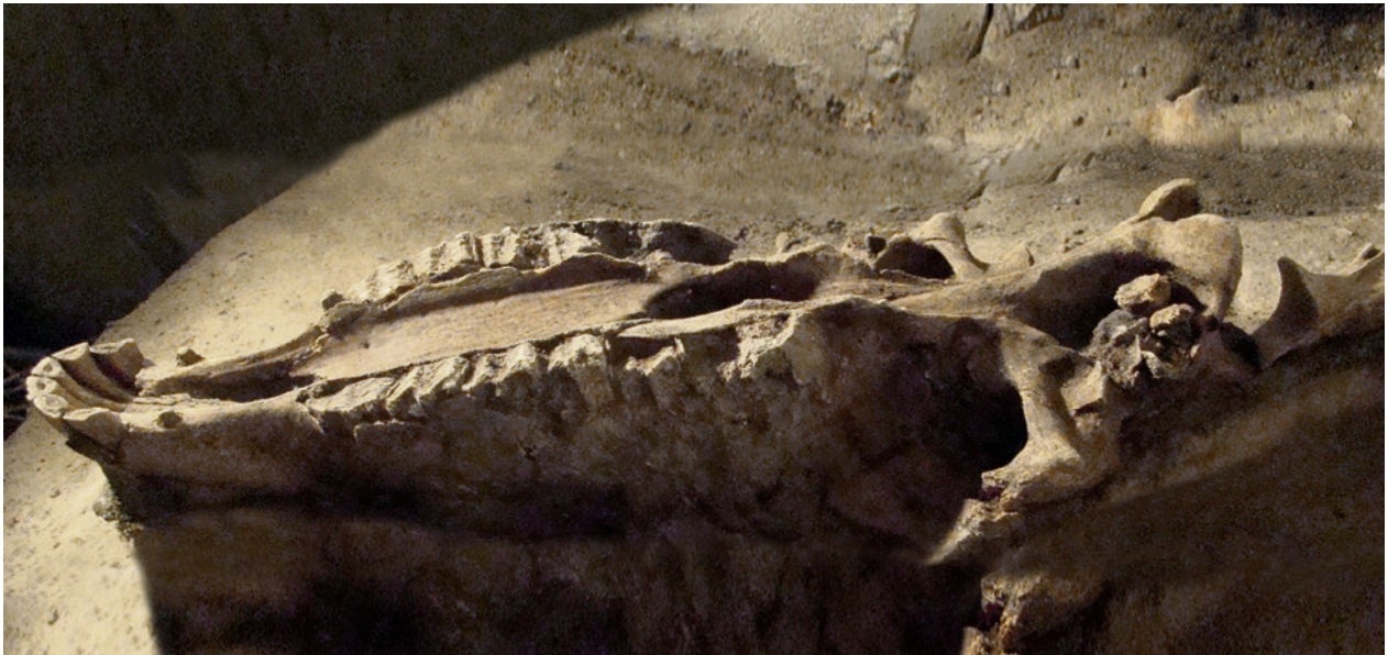
Ryc. 7. Kraków – Rynek Główny, krzyż Sukiennic, wykop 31. Górna część czaszki konia spoczywająca na piasku wypełniającym dno jamy. Widok z boku, od północnego zachodu; fot. E. Zaitz

z Krakowa przez paleozoologów. Niekiedy jednak określeń kości konia dokonywali także archeolodzy, historycy, a nawet osoby przypadkowe, jak mamy to w odniesieniu do znalezisk pochodzących z domniemanych pochówków z Wawelu, z Okołu (kościół św. św. Piotra i Pawła), Rakowic i z ulicy św. Jana 3. W tym ostatnim przypadku identyfikacji „kościotrupów człowieka i konia” dokonał podmajor murarski. Niezawodność takich określeń bywa bardzo różna. Świadczyć o tym może informacja o kultowych pochówkach krów i koni z Łosienia 29 . Zdarza się, że nawet znaleziska z badań prowadzonych na początku XXI wieku bywają źle określone i zinterpretowane. W tym ostatnim przypadku brak rogów oraz zaobserwowane anomalie chorobowe na kośćcu sprawiły, że odnaleziony w 2003 roku pochówek młodej krowy został „po wstępnych badaniach archeozoologicznych” uznany za szkielet konia i jako taki pojawił się wraz z odpowiednimi interpretacjami w literaturze 30 .