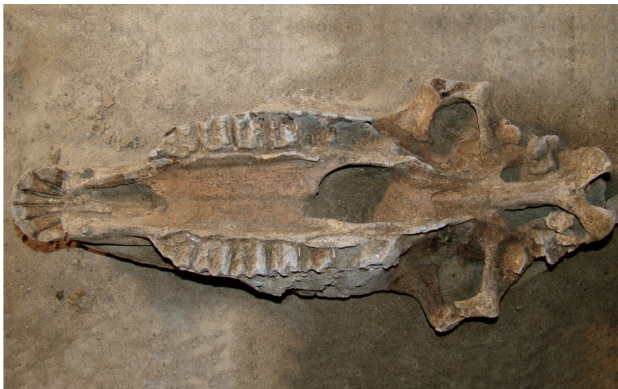
Ryc. 6. Kraków – Rynek Główny, krzyż Sukiennic, wykop 31. Resztki czaszki konia ułożonego na grzbiecie, z czytelnymi zębami. Widok z góry, od południa; fot. E. Zaitz

20–30 cm wyżej 25 . W tym kontekście domniemany pochówek znajdowałby się w bardzo głębokiej jamie (?), której dno usytuowane byłoby ponad 350 cm poniżej ówczesnego poziomu użytkowego na tym obszarze. Na takiej głębokości znajdują się tu najczęściej dolne partie zasypisk średniowiecznych dołów kloacznych 26 . Obiekty takie najczęściej były lokalizowane na tyłach działek budowlanych (i obecnych posesji), czyli w rejonie późniejszych oficyn wznoszonych zazwyczaj na przełomie późnego średniowiecza i czasów nowożytnych, a przebudowywanych często w XVIII i XIX wieku. W wypełniskach tych obiektów odkrywano zazwyczaj w dużej liczbie naczynia gliniane 27 , jak też bardzo dobrze zachowane przedmioty drewniane (m.in. łyżki), a także kości zwierzęce i różnorodne materiały organiczne. Taka lokalizacja oraz głębokość zalegania przedmiotów odkrytych w 1897 roku zdają się potwierdzać przypuszczenie, że może tu chodzić o różne znaleziska pochodzące z dawnych wychodków. Z dołu kloaczego mogły pochodzić także kości, które „podmajstry” murarski Mateusz Stanek uznał za „kościotrup człowieka i konia”.