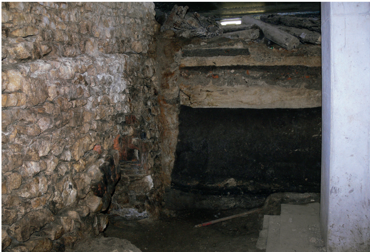
Mur magistralny wschodniego rzędu Kramów Bogatych, ćwiartka północno-wschodnia (kram narożny nr 32), z ceglany łękiem nad kanałem ściekowym. Między murem a blokiem ziemnym wkop budowlany przecinający nienaruszone nawarstwienia średniowieczne; fot. P. Opaliński, 11 marca 2008 r.; w zbiorach Muzeum Historycznego Miasta Krakowa

1257–1791 filmie Civitas nostra Cracoviensis A.D. 1650 73 . Komputerowy model krakowskiego Rynku był jego istotną częścią. Animacja, wykonana przy użyciu technik wizualizacji cyfrowej, objęła krakowski zespół osadniczy z Krakowem, Kazimierzem i Kleparzem, według stanu z około 1650 roku, w okresie jego największego rozkwitu. Kolejnym zrealizowanym tematem był model cyfrowy zabudowy Rynku krakowskiego według planu Dominika Pucka z 1787 roku. Na jego podstawie została wykonana w 2006 roku makieta Rynku w skali 1:200. Powstała też makieta Ratusza krakowskiego z pierwszej ćwiertki XVI wieku (skala 1:50) i Pałacu Krzysztofora, według stanu na drugą połowę wieku XVII (skala 1:50) 74 .