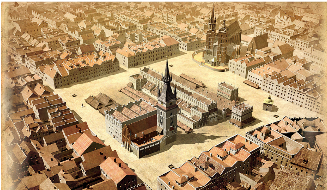
Kadr z filmu Civitas nostra Cracoviensis A.D. 1650. Rynek krakowski

te podziemnym rezerwatem). W Gnieźnie największą atrakcją dla Zespołu MHK stały się podziemia katedry z doskonale wyeksponowanymi relikwiami średniowiecznej zabudowy – fragmentami najstarszych kościołów – domniemanej rotundy i bazyliki z XI wieku oraz katedry XII-wiecznej. Tam także znajdują się nieliczne zachowane groby średniowieczne oraz ekspozycja grobowców biskupów. W Muzeum Początków Państwa Polskiego zapoznano się z funkcjonowaniem jego podziemnej części, m.in. z rekonstrukcją wnętrza wału obronnego.