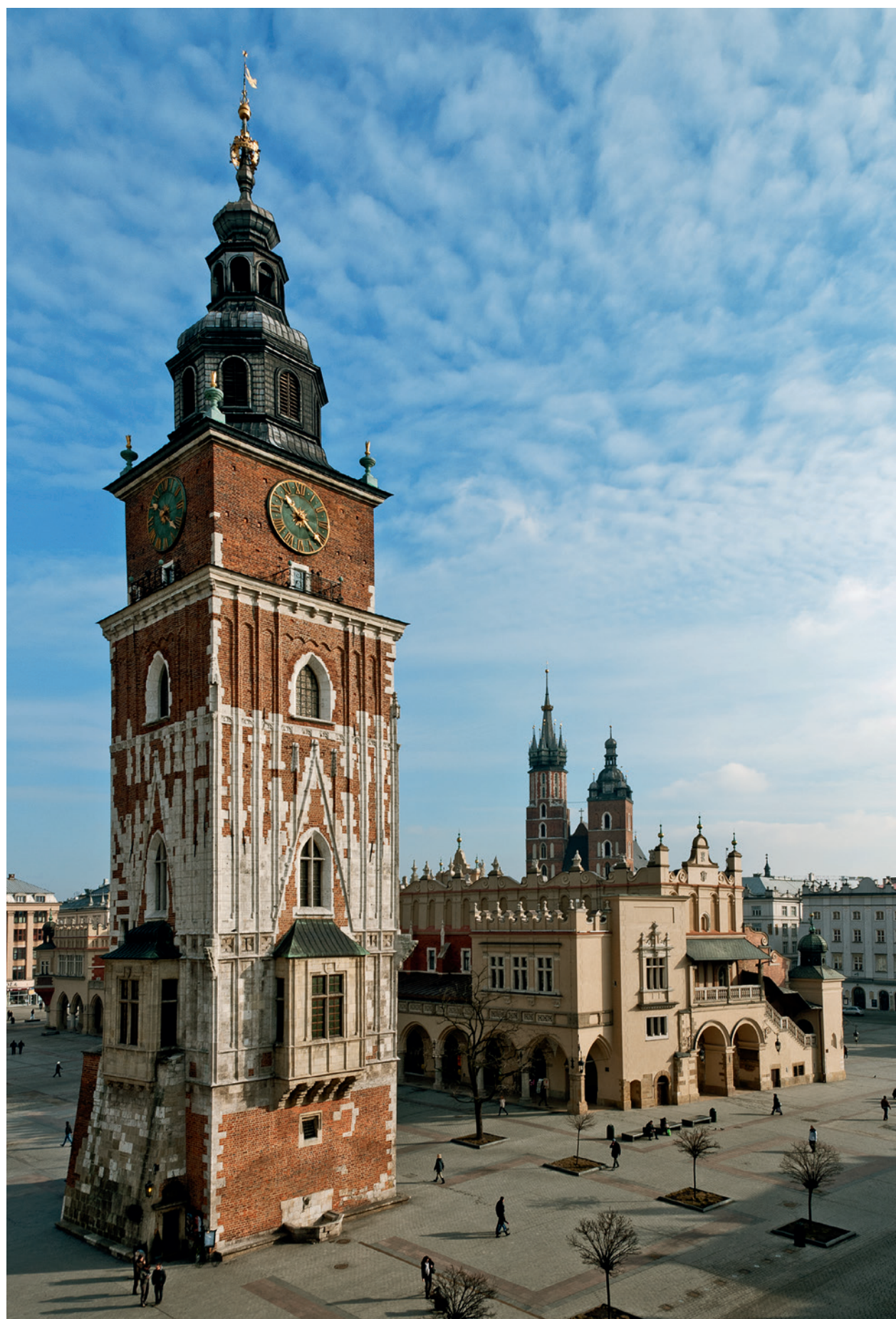
Wieża Ratuszowa i Sukiennice, widok od południowego zachodu; fot. B. Woch, 2010 r.; w zbiorach Muzeum Historycznego Miasta Krakowa