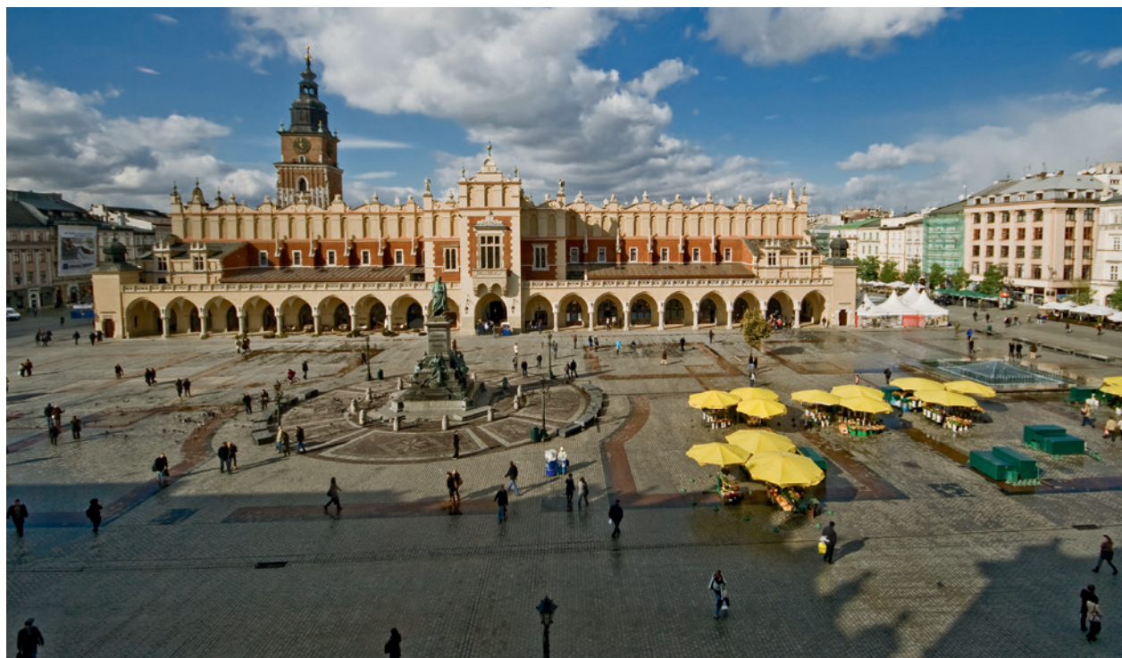
Wschodnia połowa Rynku Głównego z nową nawierzchnią, Sukiennicami, pomnikiem A. Mickiewicza i fontanną; fot. B. Woch, 21 października 2010 r.; w zbiorach Muzeum Historycznego Miasta Krakowa