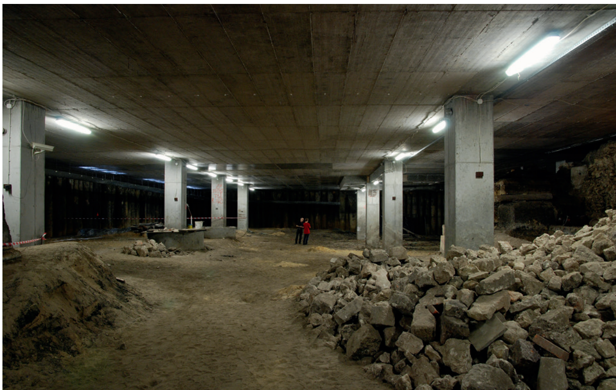
Północno-wschodnia część podziemi Rynku, przeznaczona na trasę turystyczną. Z prawej strony, w głębi, mur magistralny Kramów Bogatych; widoczny skład kamieni wapiennych pozyskanych z nawarstwień, bruków i zasypów gruzowych; fot. B. Woch, 26 czerwca 2009 r.; w zbiorach Muzeum Historycznego Miasta Krakowa

Prace konserwatorskie wykonała wspomniana już firma Sima Art sp. z o.o.