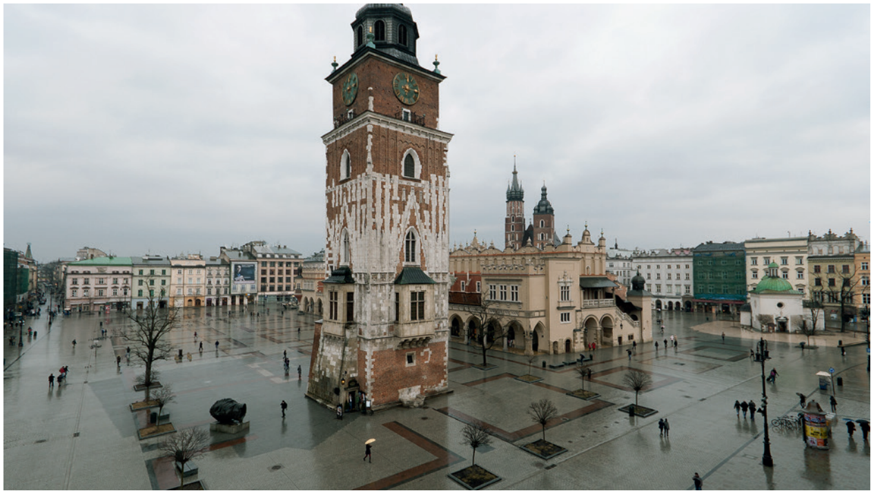
Rynek Główny w Krakowie, widok od południowego-zachodu. Przy Wieży Ratuszowej widoczny w nawierzchni zarys Ratusza (ciemna kostka)

30 września 2009 roku gotyckie przedproże jest pionierską ekspozycją na terenie Krakowa i jedyną tego typu budowlą w mieście odnowioną i pokazywaną publiczności 24 . W jednym z pomieszczeń piwnicznych Krzysztoforów ułożono XIV-wieczny bruk wapienny, pozyskany z wykopalisk na Rynku Głównym, i wyeksponowano przekrój warstw, które narosły od XIII wieku przy pierzei zachodniej placu 25 .