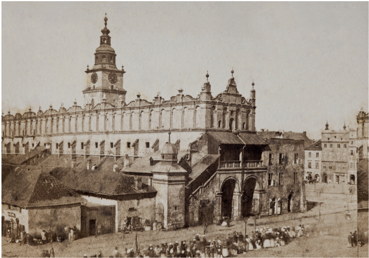
Kramy Bogate i Sukiennice od północnego wschodu; fot. W. Maliszewski, około 1865 r.; reprodukcja A. Chęć; w zbiorach Muzeum Narodowego w Krakowie, nr inw. MNK-XX-f-377

W północno-wschodniej części rezerwatu widoczne są relikty osady przedlokacyjnej (XII – pierwsza połowa XIII wieku); są to podwaliny (z drewna dębowego) kilku budynków zrębowych, orientowanych w linii północ – południe. Osadę zniszczył pożar (zachowały się ślady spalin) i zapewne najazd Mongołów w 1241 roku, o czym świadczą specyficzne grotty strzał znalezione w jej poziomach osadniczych 137 . Nad drewnianymi relikwiami chat zaplanowano panoramiczną projekcję animacji komputerowej o początkach Krakowa (do czasu zniszczenia osady przez najazd Mongołów), która przybliżyłaby zwiedzającym krajobraz osadniczy wczesnośredniowiecznego organizmu protomiejskiego (zob. niżej o filmie Cracovia. Origo ). Obok miały stanąć fizyczne repliki warsztatów rzemieślniczych: kowala i rogownika, z odtworzonym fragmentem otoczenia, m.in. XIII-wieczną studnią drewnianą i wiklinowym płotem 138 .