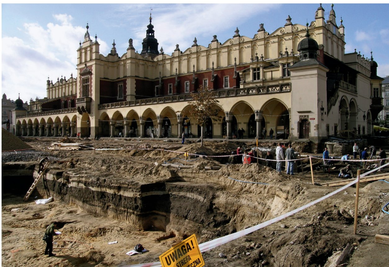
Północno-wschodnia część Rynku Głównego w Krakowie. Z lewej strony badania na poziomie cmentarza wczesnośredniowiecznego; antropolog przy pracy. Z prawej prace archeologiczne; październik 2005 r.

XI-wiecznych pochówków (koraliki, kabłączki skroniowe) 49 . W styczniu 2006 roku, w wykopie od strony ulicy Brackiej dokonano odkrycia. Spod warstw ziemi ukazał się unikatowy zabytek – nienaruszony bochen ołowiu, z pieczęciami Władysława Łokietka. Jest to znalezisko wyjątkowe w skali europejskiej 50 . Od sierpnia 2006 roku odsłaniano w wykopie od strony ulicy św. Jana relikty zrębowych chat sprzed lokacji Krakowa 51 . Nie wszystkie odkopane przez archeologów bu-