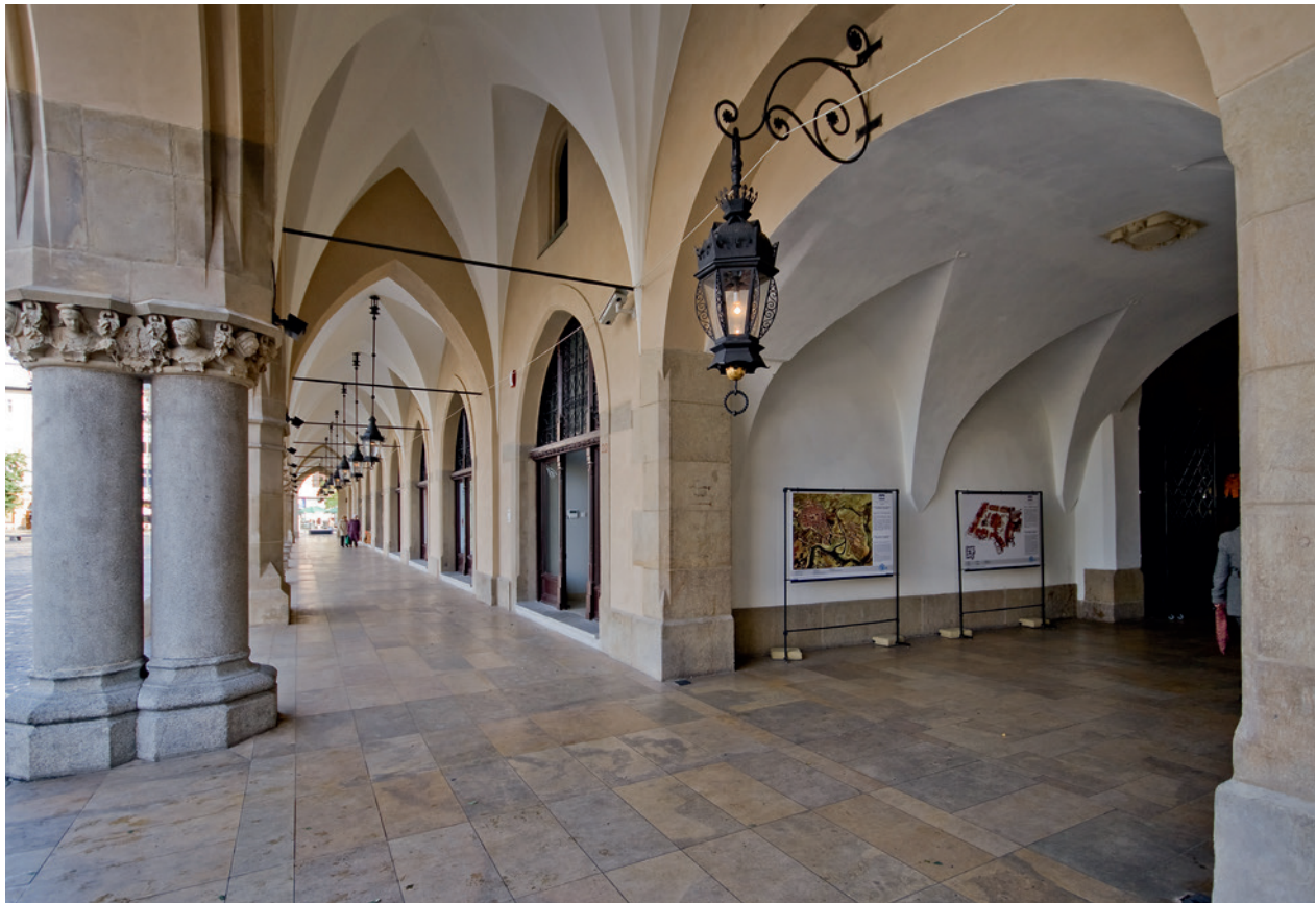
Podcienia po stronie zachodniej Sukiennic, z prawej przejście przez krzyż. Plansze części wystawy Rynek krakowski. Przemiany architektoniczno-urbanistyczne Krakowa; 21 października 2010 r.