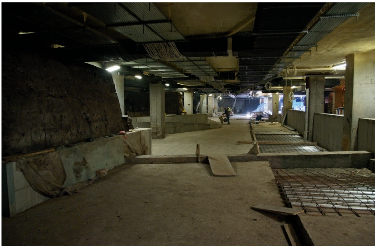
Północna część podziemi Rynku, budowa trasy turystycznej; fot. B. Woch, 18 lutego 2010 r.; w zbiorach Muzeum Historycznego Miasta Krakowa

Naukowym „Nawarstwienia historyczne miast”, zorganizowanym w Akademii Górniczo-Hutniczej 7 listopada 2008 roku, dyrektor Muzeum Historycznego przedstawił referat Podziemna ekspozycja pod Rynkiem Głównym 115 . Podczas obchodów Międzynarodowego Dnia Przewodnika Turystycznego 20 lutego 2009 roku projekt urządzenia podziemnej trasy został zaprezentowany krakowskim przewodnikom. Po podziemiach rynkowych oprowadzano wielu znakomitych gości, w tym z zagranicznych placówek muzealnych, np. z Wien Museum (Muzeum Wiednia) w czerwcu 2009 roku. Z wielkim zainteresowaniem spotkało się wystąpienie dyrektora Niezabitowskiego Fabryka Oskara Schindlera w Krakowie oraz Szlak tożsamości europejskiej Krakowa – Rynek Podziemny. Emocje, wizualizacje, poznanie , na krajowej konferencji w Gnieźnie w 2009 roku 116 .