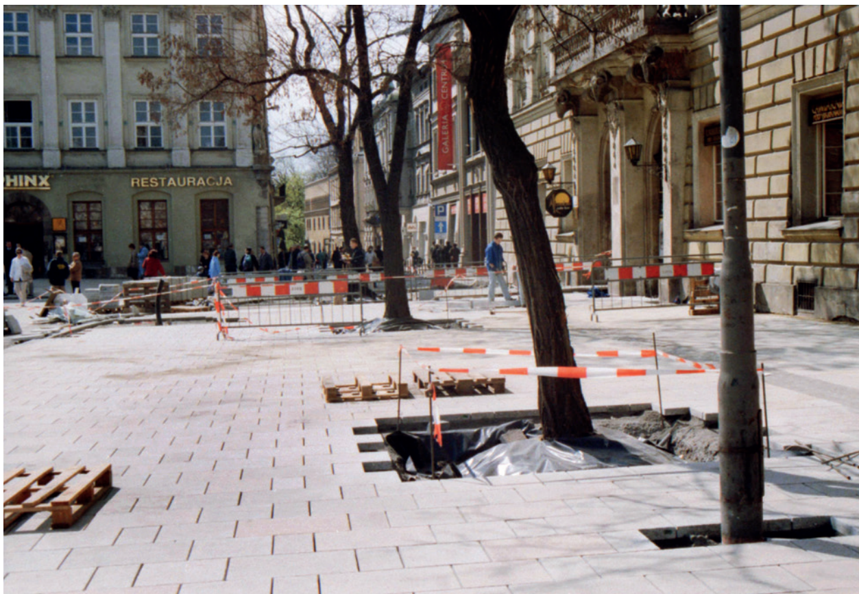
Nowa nawierzchnia chodnika przed pałacem Pod Baranami (Rynek Główny 27); fot. E. Firlet, 15 kwietnia 2002 r.; w zbiorach Muzeum Historycznego Miasta Krakowa