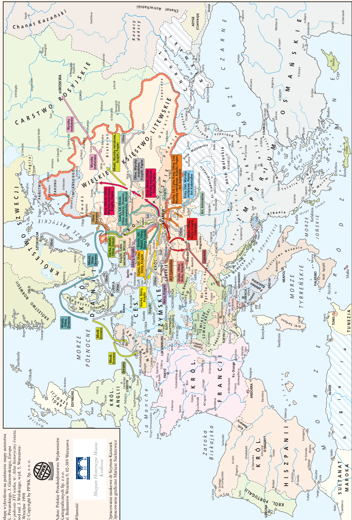
Eksport Krakowa w XVI w., wybrane towary, mapa; w zbiorach Muzeum Historycznego Miasta Krakowa

Opracowanie naukowe dr Szymon Kazuszek Opracowanie graficzne Marcin Szelerewicz