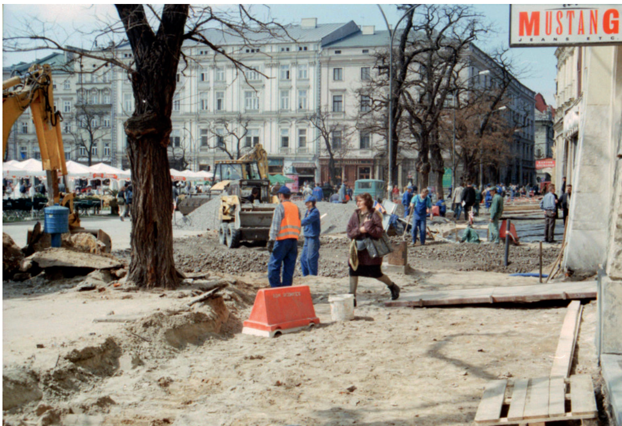
Wymiana nawierzchni chodnika na linii A–B przy północnej pierzei Rynku, w głębi budynek narożny – Pałac Krzysztofory; fot. E. Firlet, 15 kwietnia 2002 r.; w zbiorach Muzeum Historycznego Miasta Krakowa