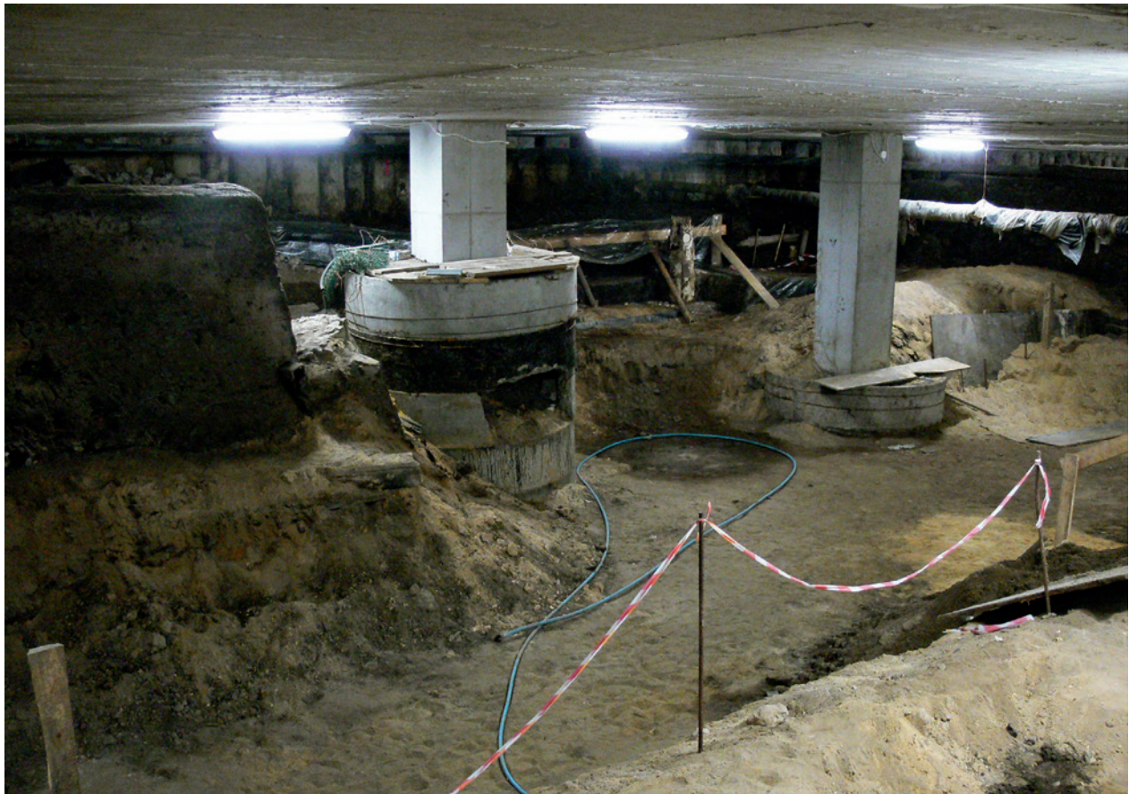
Północna część podziemi pod płytą Rynku, przeznaczona na trasę turystyczną; z lewej świadek ziemny, w głębi przysłonięte brukowane trakty drożne; 11 marca 2008 r.

największym zainteresowaniem cieszył się wielki bochen ołowiu z początku XIV wieku, odnaleziony w 2006 roku w pobliżu Wielkiej Wagi 68 . To jedyny odkryty na terenie Polski obiekt tego rodzaju, który zachował w całości swoją formę handlową. Z ozdób zaprezentowano dużą liczbę pierścionków – złotych, srebrnych, mosiężnych, brązowych, cynowych, a z przedmiotów codziennego użytku – igły, szydła żelazne czy kłódki, z zabawek dziecięcych – m.in. gliniane figurki koni pokryte glazurą. Pokazano też cenny, wydobyty spod Rynku rzadki przedmiot – misternie wykonaną z kości rękojeść noża (zapewne z drugiej połowy XIII wieku) w formie pełnoplastycznej rzeźby 69 . W piwnicach Krzysztoforów, w pomieszczeniu dawnego przedproża, eksponowany był fragment wodociągu miejskiego – drewniana rura z XVI–XVII wieku, odkryta podczas prac archeologicznych na Rynku Głównym w 2006 roku 70 . Oprócz zabytków pochodzących z ostatnich wykopalisk rynkowych, funkcję społeczno-polityczną, gospodarczą i reprezentacyjną krakowskiego Rynku przybliżały na wystawie inne eksponaty.