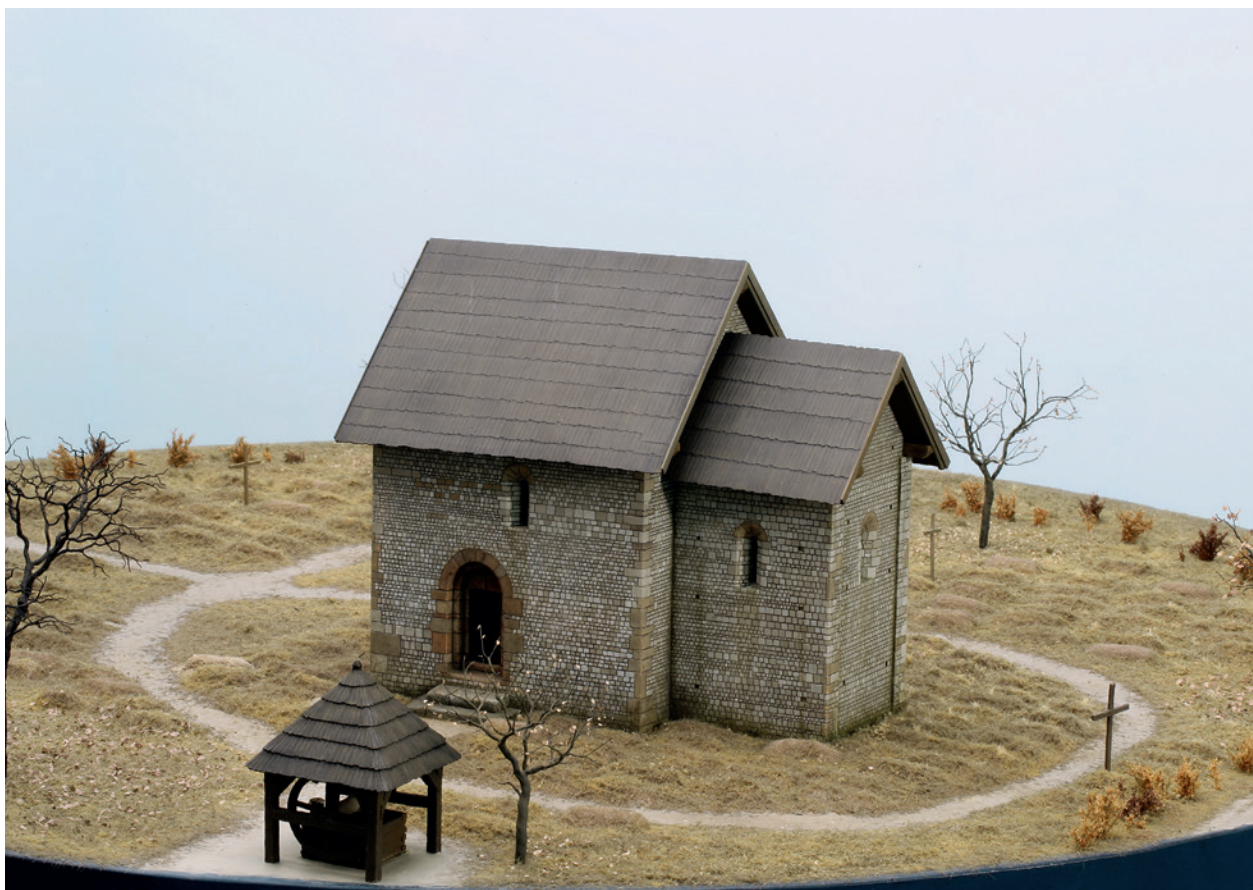
Makieta kościoła św. Wojciecha według stanu z XII wieku wraz z otoczeniem i odtworzonym cmentarzem (skala 1:50); wykonał R. Gawęł, M. Czarnowicz; konsultacja naukowa E. Zaitz; fot. A. Janikowski; w zbiorach Muzeum Historycznego Miasta Krakowa

by historia przemian całego zespołu urbanistycznego Rynku krakowskiego, od Wielkiej Lokacji w 1257 roku po czasy współczesne. W południowo-wschodnim narożniku Forum multimedialnego przewidziano kameralną przestrzeń dla najmłodszych zwiedzających. Wyświetlany tu film miał w atrakcyjny dla młodego odbiorcy sposób pokazać zagadnienia przedstawiane na wystawie 146 .