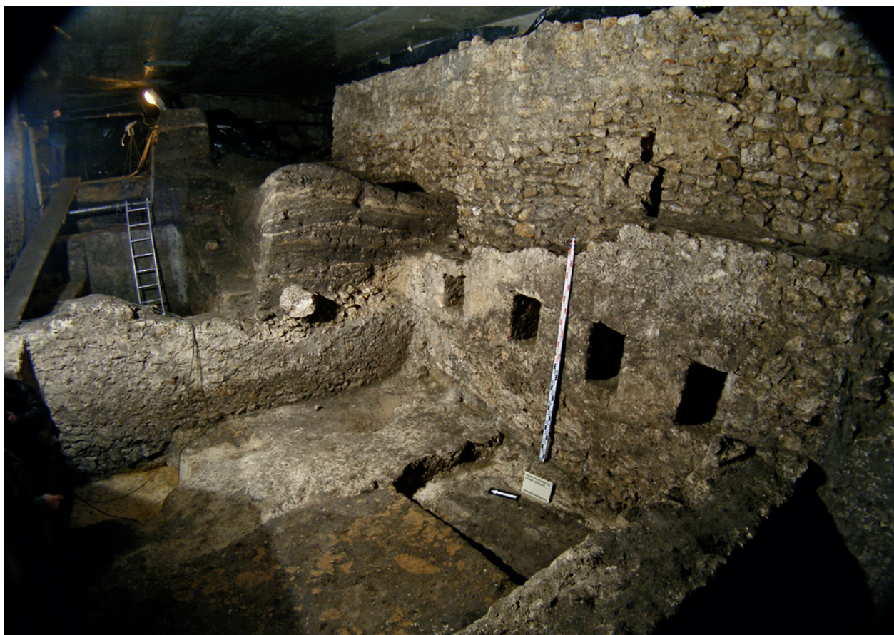
Mury piwnic Kramów Bolesławowych z drugiej połowy XIII w., widoczne wnętrza z almariami. U góry mur magistralny Kramów Bogatych z drugiej połowy XIV w.; fot. P. Guzik, 2007 r.

się zrealizowane dwie duże wystawy, w ramach których zaprezentowano obiekty z wykopalisk na Rynku.