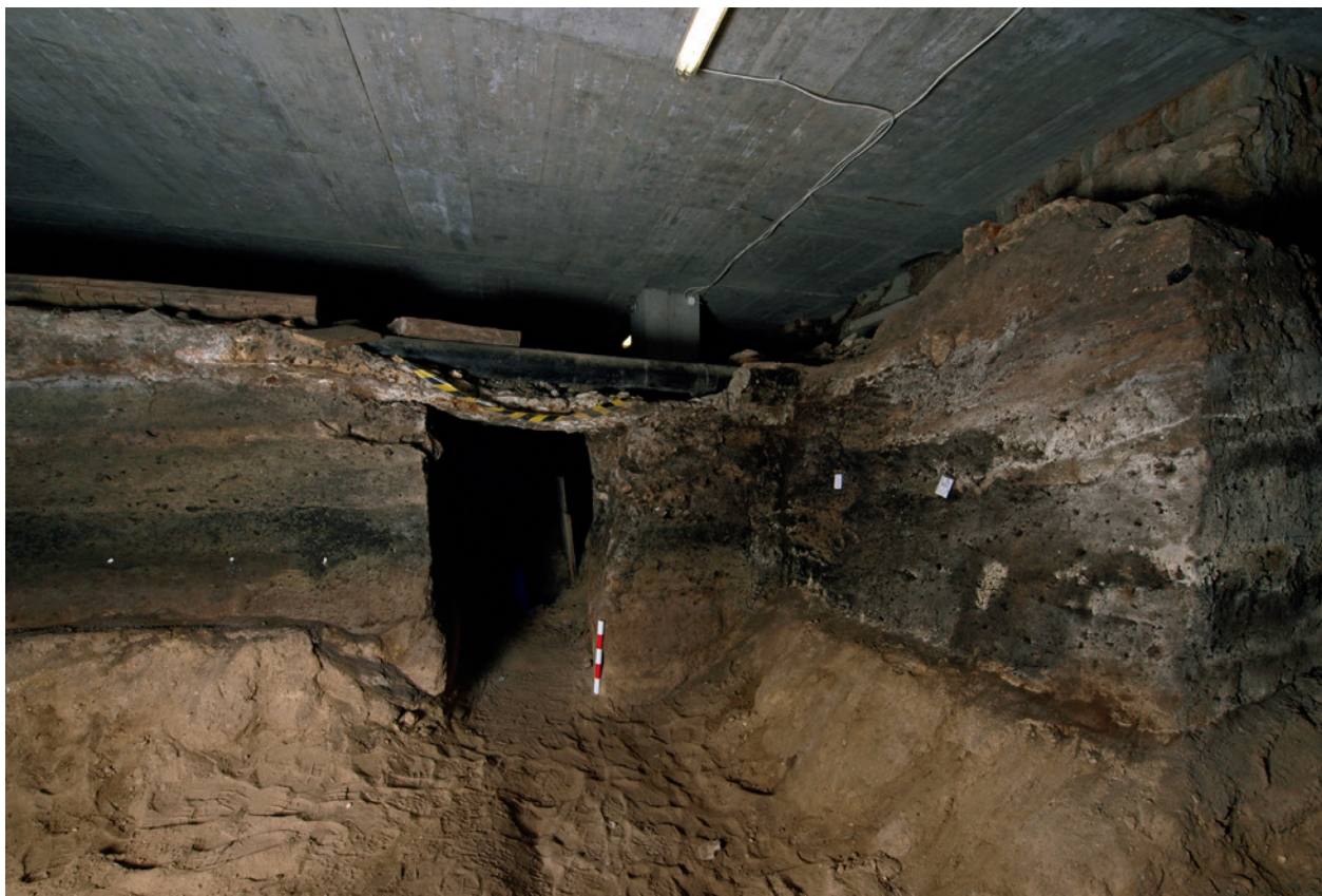
Bloki ziemne w północnej części podziemi Rynku ze średniowiecznymi nawarstwieniami