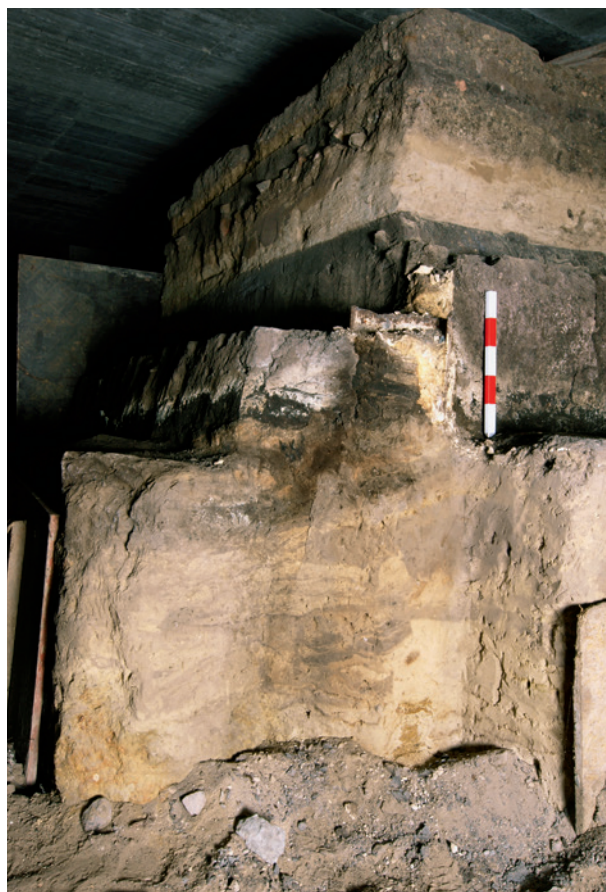
Świadek ziemny w północnej części podziemi Rynku, przy narożniku północno-wschodniej ćwiartki Kramów Bogatych (kram nr 32); 23 lutego 2008 r.

Teren wykopów archeologicznych po wschodniej stronie Rynku zabezpieczono w 2006 roku, przykrywając je żelbetową płytą wspartą na filarach i kładąc na niej nawierzchnię 77 . Zabiegom ochronnym poddano również ściany wykopów w obrębie obszaru wykopaliisk, wykonując obudowę z pali żelbetowych w formie palisady. Po uszczelnieniu palisady i płyty przykrywającej północną część podziemi, ściany przyszłej trasy turystycznej wyłożono odpowiednim materiałem izolującym 78 . W 2007 roku wzmocniono północno-wschodni narożnik Sukiennic i zabytkowe mury Kramów Bogatych 79 . Powstanie tak specyficznej podziemnej przestrzeni wywołało wiele poważnych problemów budowlanych i konserwatorskich, związanych z ochroną dziedzictwa kulturowego oraz zachowaniem, utrzymaniem i planowanym funkcjonowaniem dużych podziemnych wnętrz, zawierających zabytkową substancję archeologiczną. Pojawiły się przecieki i zagrzybienie, z czym radzono sobie na bieżąco. Od 2007 roku przeprowadzano systematyczne zabiegi konserwatorskie w podziemiach.