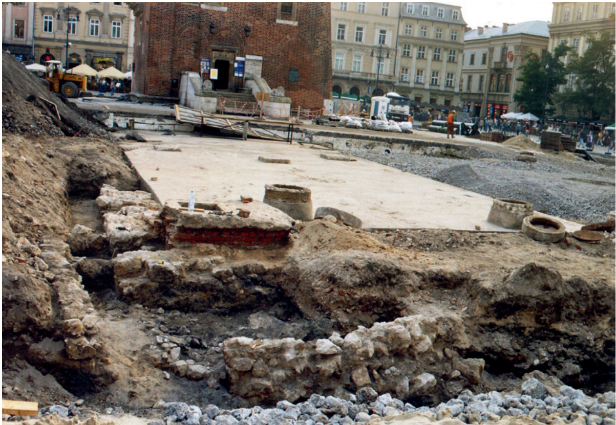
Część zachodnia Rynku Głównego w Krakowie w trakcie przebudowy nawierzchni. Widoczne mury renesansowego Ratusza (Spichlerza) i betonowa pokrywa poniemieckiego zbiornika przeciwpożarowego, w głębi Wieża Ratuszowa; fot. E. Zaitz, 2004 r.