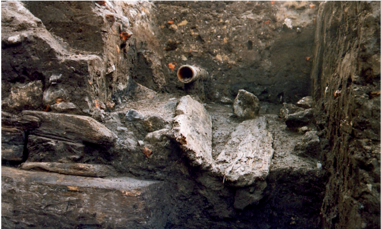
Rynek Główny, część zachodnia. Relikty kramów drewnianych z początku XIV w. U dołu, z lewej strony, narożnik wschodniego kramu posadziowany na dębowej belce. Po prawej profil nawarstwień usytuowany w miejscu wschodniej ściany kramu zachodniego. Miedzuch między kramami drewnianymi z rynsztokiem wykonanym z desek; fot. E. Zaitz, 2004 r.

cia przekazali: Wojewoda Małopolski, Społeczny Komitet Odnowy Zabytków Krakowa, Miejskie Przedsiębiorstwo Energetyki Ciepłej, Miejskie Przedsiębiorstwo Wodociągów i Kanalizacji, Zakład Energetyczny Enion oraz sponsorzy 10 . Nową nawierzchnię zachodniej części Rynku wypełniła szara granitowa kostka oraz płyty ciemnego sjenitu i czerwonego granitu, tworzące wzór w formie kwadratów. Zaznaczono symbolicznie kostką z ciemnoszarego sjenitu miejsce, gdzie stał niegdyś Ratusz 11 . Wykonawca inwestycji odnowił też obiekty małej architektury związane historycznie z tą częścią placu, a zdemontowane na czas jej remontu, w tym tablicę upamiętniającą przysięgę powstańcą Tadeusza Kościuszki 24 marca 1794 roku na Rynku krakowskim 12 . Dopiero