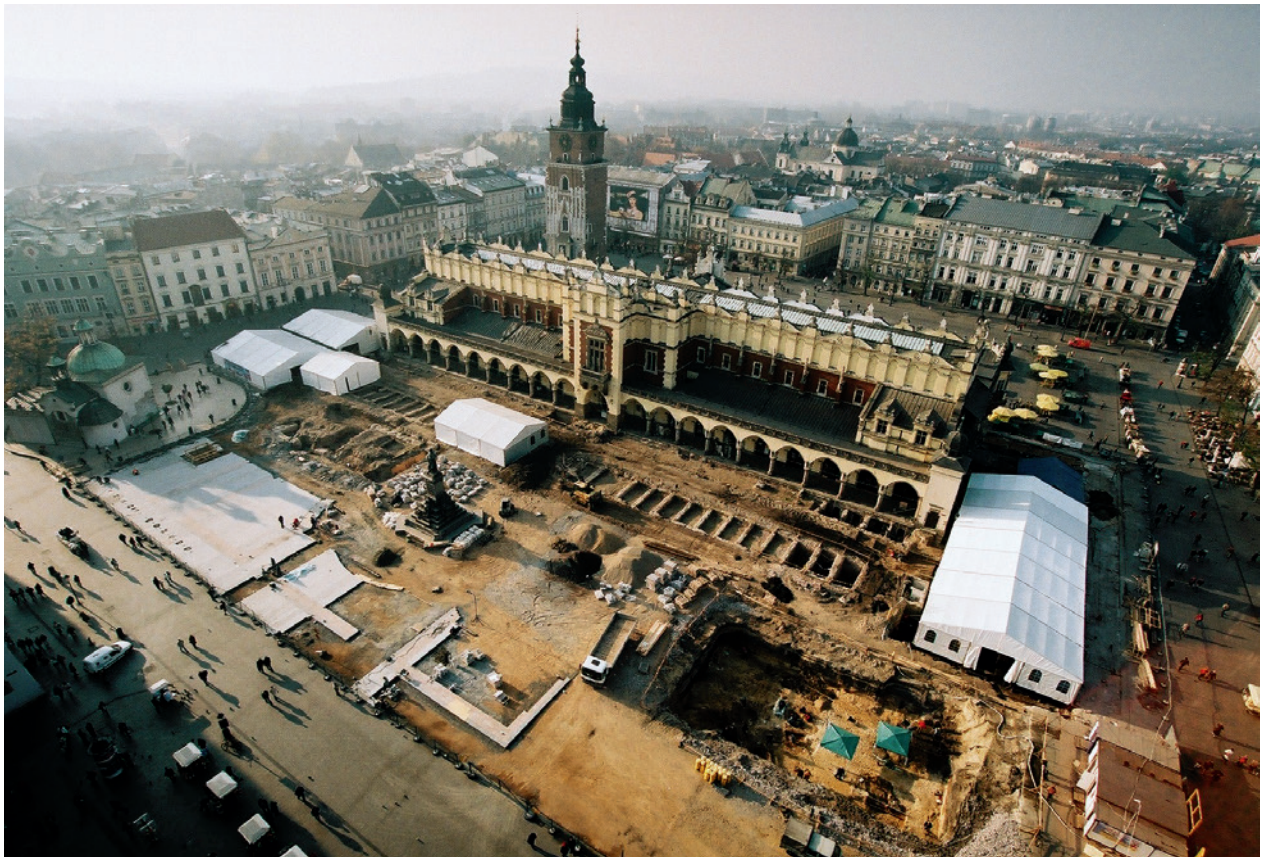
Wschodnia połowa Rynku Głównego w Krakowie w trakcie prac archeologicznych i antropologicznych. W wykopie, na pierwszym planie, eksploracja cmentarza wczesnośredniowiecznego i badanie odsłoniętych szkieletów. Teren przeznaczony do dalszych badań zadaszony. Przy pomniku A. Mickiewicza, z lewej, odsłonięte mury Małej Wagi. Widoczne fragmenty świeżo położonej nowej nawierzchni Rynku; fot. P. Guzik, listopad 2005 r.

cych z archeologami antropologów, metaloznawców, dendrologów, paleobotaników, paleozoologów. Wyróżniało się rozmiarem fotograficzne, kilkumetrowe odwzorowanie przekroju nawarstwień Rynku.