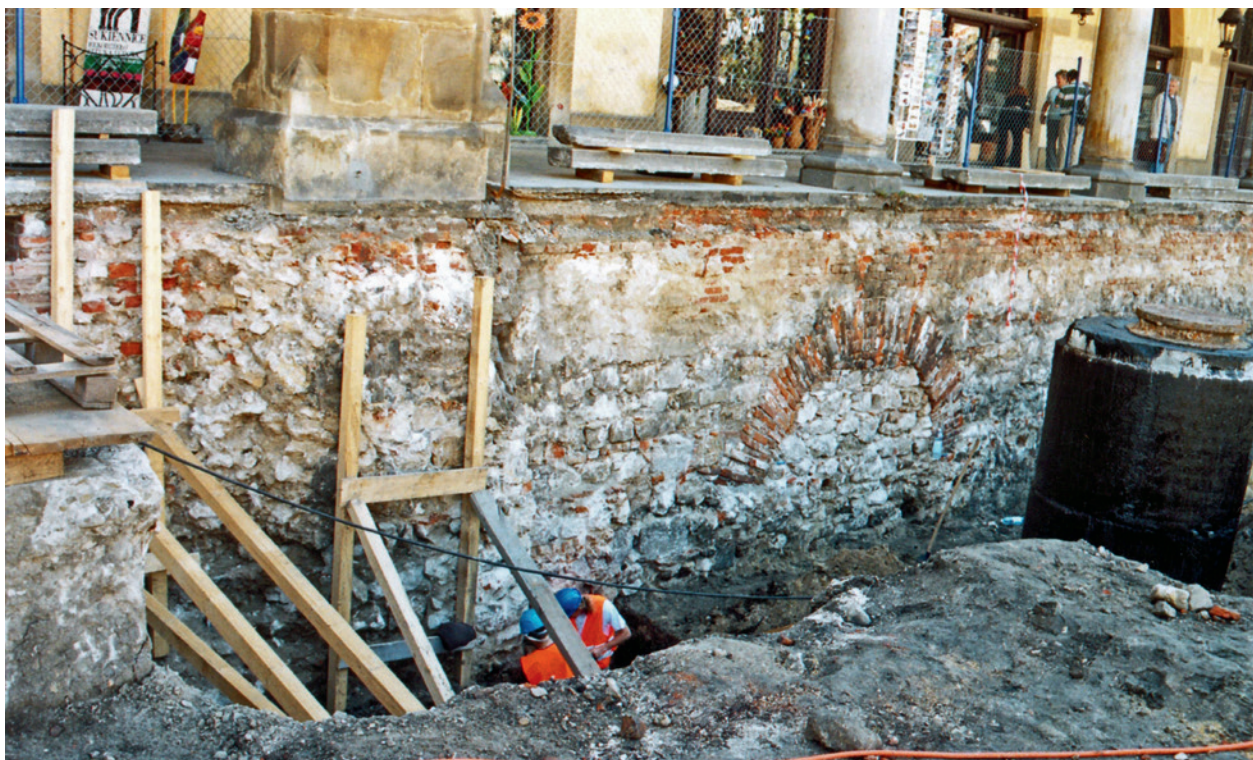
Fundament pod zachodnim podcieniem Sukiennic (część północna) z czasów przebudowy T. Prylińskiego. Z lewej gotycki mur Syndykówki, podparty drewnianymi przyporami; fot. E. Zaitz, 2004 r.

części Rynku, Pałac Krzysztofora – przy Rynku Głównym 35, a w bezpośrednim sąsiedztwie Rynku, przy placu Mariackim 3, mieści się oddział Kamienica Hipolitów.