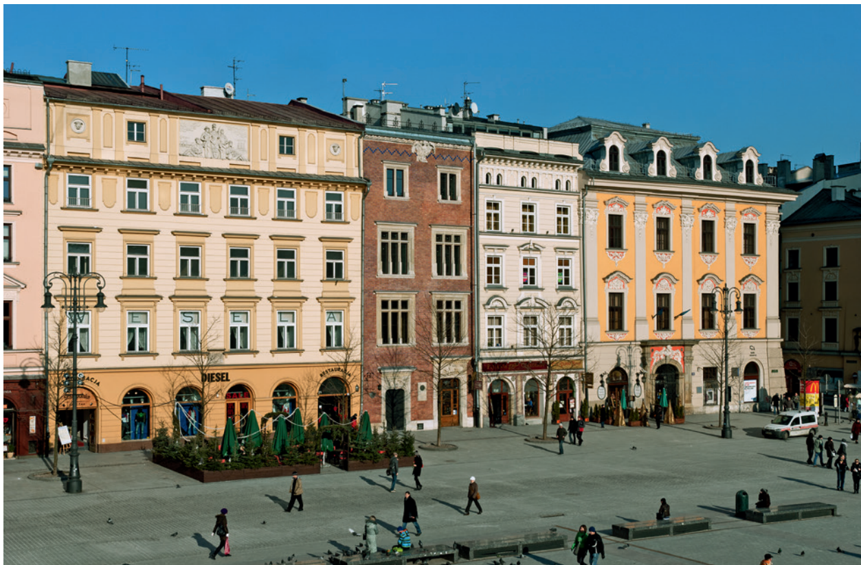
Pierzeja północna Ryнку Głównego, kamienice nr 44, 45, 46, 47

nawierzchni Ryнку 19 . Wydobyto liczną grupę zabytków archeologicznych z okresu średniowiecza. Podsumowaniem prac archeologicznych w zachodniej części Ryнку stała się wystawa, przygotowana przez Muzeum Archeologiczne w Krakowie, zatytułowana Badania archeologiczne na Ryнку Głównym w Krakowie w 2004 r. , czynna w pierwszym kwartale 2005 roku 20 .