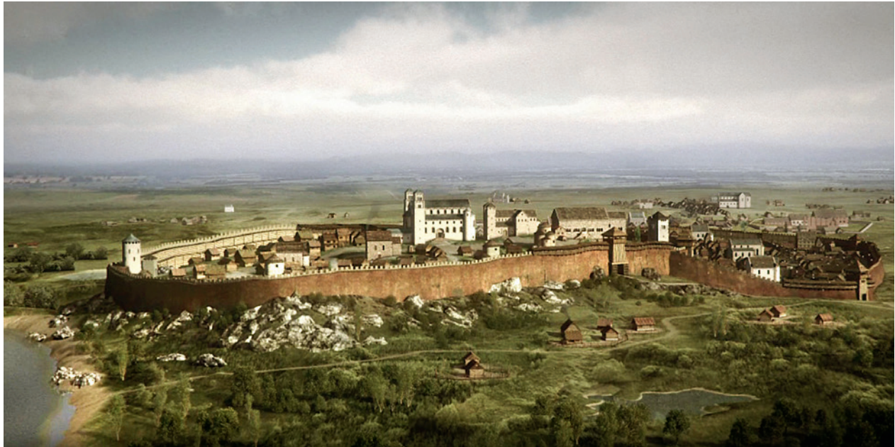
Kadr z filmu Cracovia. Origo. Kraków w pierwszej połowie XIII wieku – Wawel i podgrodzie (Okół); w głębi kościół Mariacki; w zbiorach Muzeum Historycznego Miasta Krakowa

Rynku w wymiarze europejskim i lokalnym. Kolejno przygotowano do kapsuł czasu koncepcje tematów: