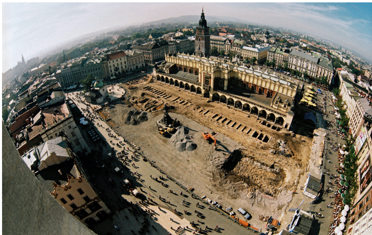
Wschodnia część Ryнку Głównego w Krakowie w trakcie badań archeologicznych. U góry, przy narożniku Sukiennic, odsonięte mury Wielkiej Wagi. W pobliżu pomnika A. Mickiewicza, z lewej, widoczne mury Małej Wagi. Wzdłuż Sukiennic wschodni rząd piwnic Kramów Bogatych i część zachodniego rzędu. Przy kościele św. Wojciecha położona nowa nawierzchnia; fot. P. Guzik, październik 2005 r.

prowadziła je Pracownia Archeologiczno-Architektoniczna Niegoda z Wrocławia. Od grudnia 2007 roku do lipca 2010 roku przejęła je firma Konsus Pracownia Dokumentacyjno-Badawcza Sławomir Dryja z Zabierzowa. Przez cały ten czas badaniami kierował dr Cezary Buśko 45 .