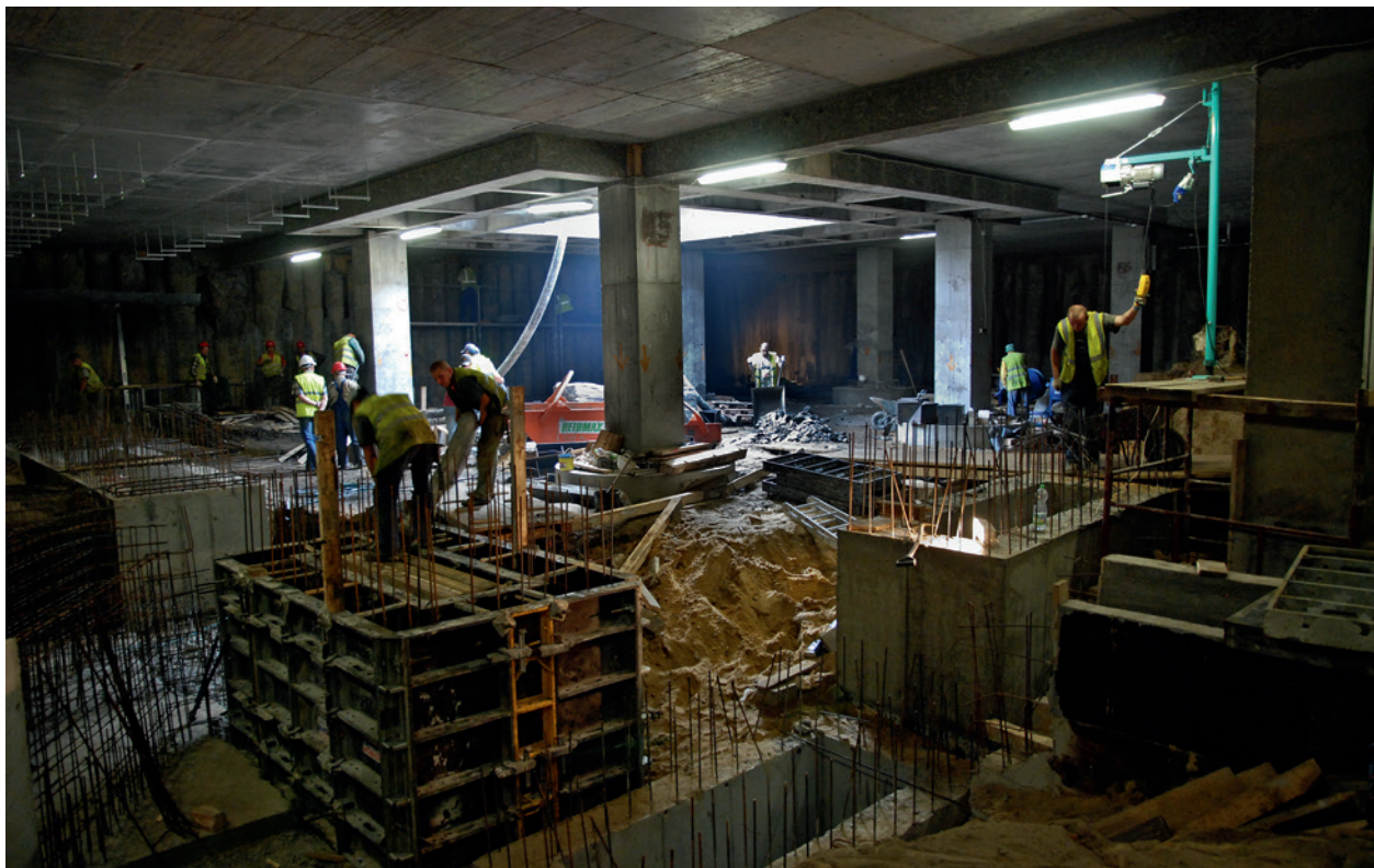
Północno-wschodnia część podziemi Rynku, budowa trasy turystycznej; fot. B. Woch, 24 września 2009 r.; w zbiorach Muzeum Historycznego Miasta Krakowa

patrząc z podziemi do góry, mogą zobaczyć wieże kościoła Mariackiego. Zakończony pod koniec września 2010 roku montaż fontanny umożliwił zamknięcie otworu technologicznego w płycie Rynku. Ostatecznie uruchomiono ją 13 października.