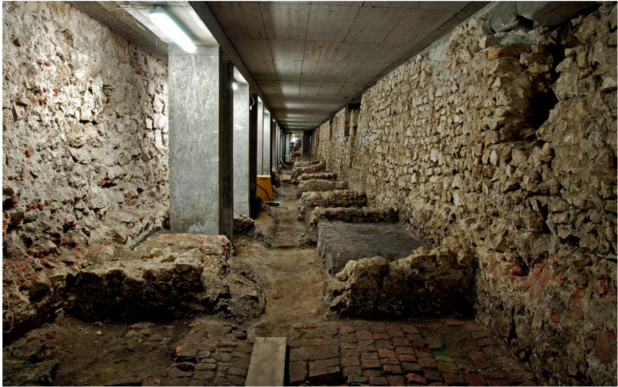
Piwnice Kramów Bogatych, trakt zachodni, ćwiartka południowo-zachodnia, przed powstaniem ekspozycji; fot. B. Woch, 31 lipca 2009 r.; w zbiorach Muzeum Historycznego Miasta Krakowa

Wejście do podziemi Rynku znajduje się w pomieszczeniu dawnego sklepu, w narożniku północno-wschodnim Sukiennic. Zamontowano tutaj nowoczesną windę, która zwozi gości cztery metry w dół 101 . Następnie przez recepcję (m.in. szatnię i kasę) wchodzi się do części ekspozycyjnej. Trasa turystyczna prowadzi przez podziemia od strony ulicy św. Jana, dalej przez ciąg piwnic Kramów Bogatych, krzyż i przez północno-wschodnią część piwnic Sukiennic 102 . Ekspozycja zajmuje powierzchnię około 3000 m kw. W miejscu dawnego zbiornika przeciwpożarowego na wodę, na poziomie -2, umieszczono sanitariaty i część technologiczną obsługującą rezerwat 103 . Natomiast północno-zachodnie piwnice Sukiennic inwestor (ZIKiT) przeznaczył m.in. na