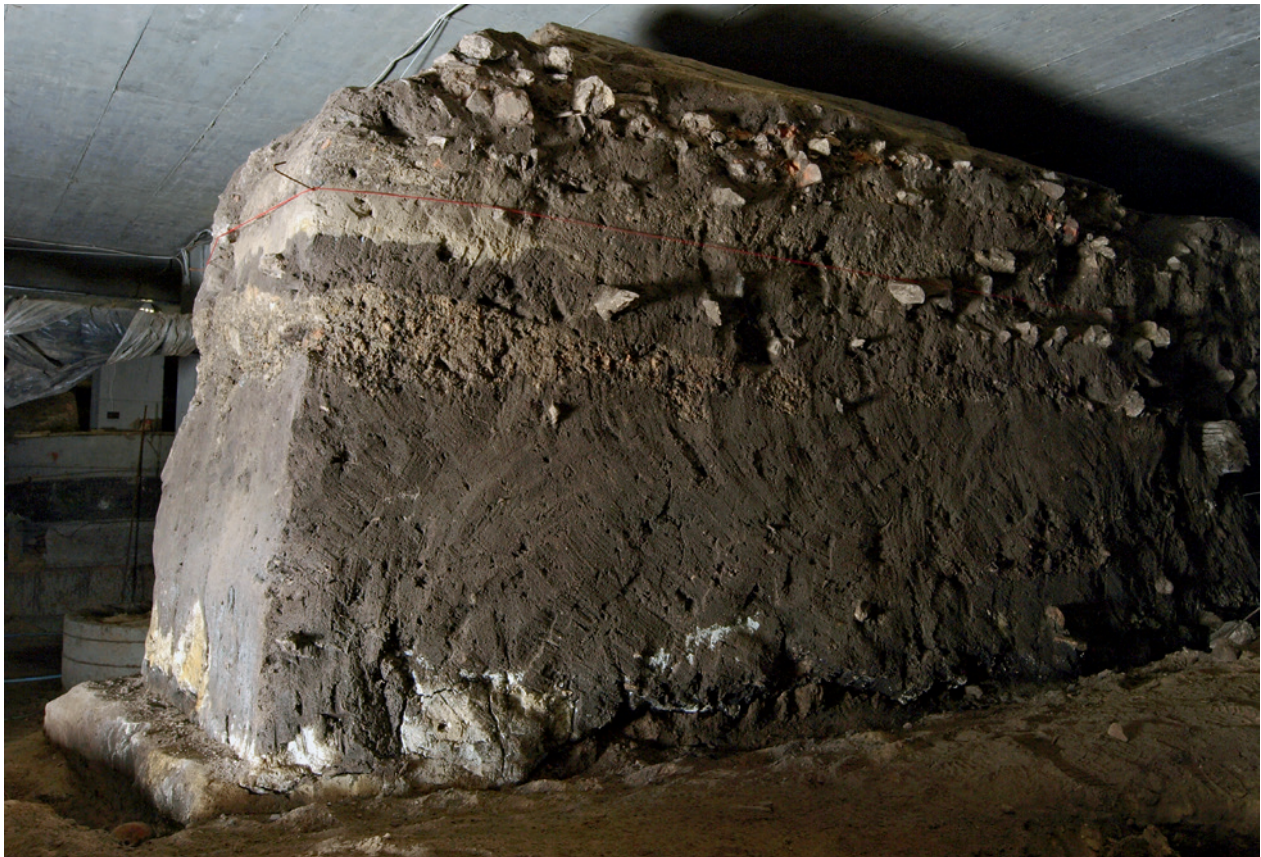
Świadek ziemny w północnej części podziemi Rynku; fot. M. Banaś, 23 lutego 2008 r.; w zbiorach Muzeum Historycznego Miasta Krakowa

nalnego dotacja Unii Europejskiej w wysokości ponad 16 mln zł została przyznana na budowę trasy turystycznej pod Rynkiem 88 . Beneficjentem projektu było miasto Kraków, jednostką realizującą Zarząd Infrastruktury Komunalnej i Transportu w Krakowie.