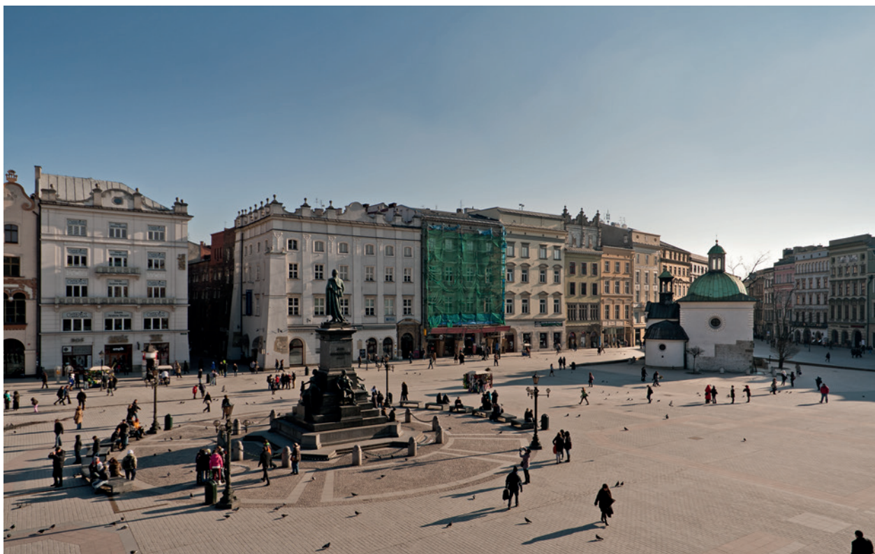
Wschodnia część Ryнку Głównego z pomnikiem Adama Mickiewicza i kościołem św. Wojciecha; fot. B. Woch, 2010 r.; w zbiorach Muzeum Historycznego Miasta Krakowa

2004 roku – styczeń 2005 roku), układając na nowo bruk kamienny z użyciem zabytkowej kostki wapiennej (wydobytej z innych miejsc na Ryнку) oraz wapienia tureckiego 30 . Wykonano izolację, chroniąc go od przecieków wody, która zalewała wystawę w podziemiach kościoła. Nad fragmentem romańskiego, XII-wiecznego muru, od strony północnej zamontowano szklaną płytę, przez którą widoczne jest jego lico. Powstała nowa iluminacja świetlna bryły kościoła i ustawiono zdemontowane niegdyś kamienne pacholki. Przeprowadzono konserwację romańskich murów budowli, odnowiono wnętrze podziemnego rezerwatu archeologicz-