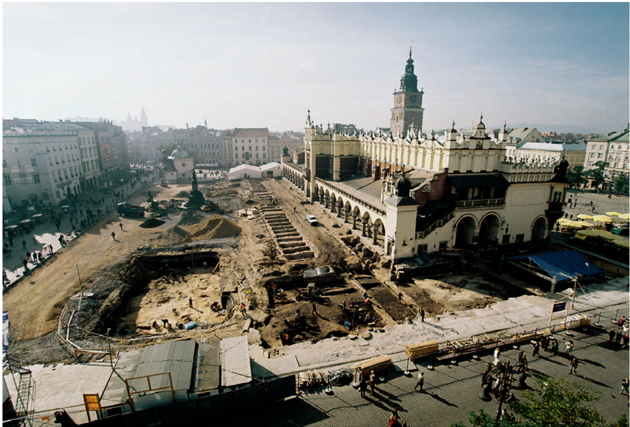
Północno-wschodnia część Rynku Głównego w Krakowie w trakcie prac archeologicznych. Z lewej strony badania cmentarza w wykopie na obszarze dawnego poniemieckiego zbiornika przeciwpożarowego. Wzdłuż Sukiennic odsłonięty wschodni rząd piwnic Kramów Bogatych i cztery piwnice rzędu zachodniego; fot. P. Guzik, październik 2005 r.

odsłoniętych obiektów podziemnych brali udział przedstawiciele różnych dyscyplin naukowych: architekci, historycy, historycy sztuki, antropolodzy, geolodzy, zoologowie i botanicy 53 . Ważnym zagadnieniem była rekonstrukcja środowiska przyrodniczego, w którym żyli dawni mieszkańcy, i badania szkieletów ludzkich w celu określenia kondycji i pochodzenia średniowiecznych krakowian 54 . Prowadzono badania metaloznawcze odkrytych zabytków ruchomych. Analizy dendrologiczne drewna pozwoliły uściślić termin powstania chat osady przedlokacyjnej, średniowiecznych dróg i nawierzchni. Dokumentację fotograficzną prac archeologicznych i odsłoniętych obiektów wykonywał Tomasz Kalarus i ks. Piotr Guzik z bazyliki Mariackiej.