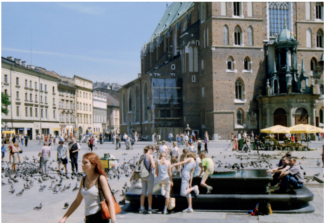
Nieistniejąca fontanna na Ryнку krakowskim (proj. W. Zina); fot. E. Firlet, 19 czerwca 2002 r.; w zbiorach Muzeum Historycznego Miasta Krakowa