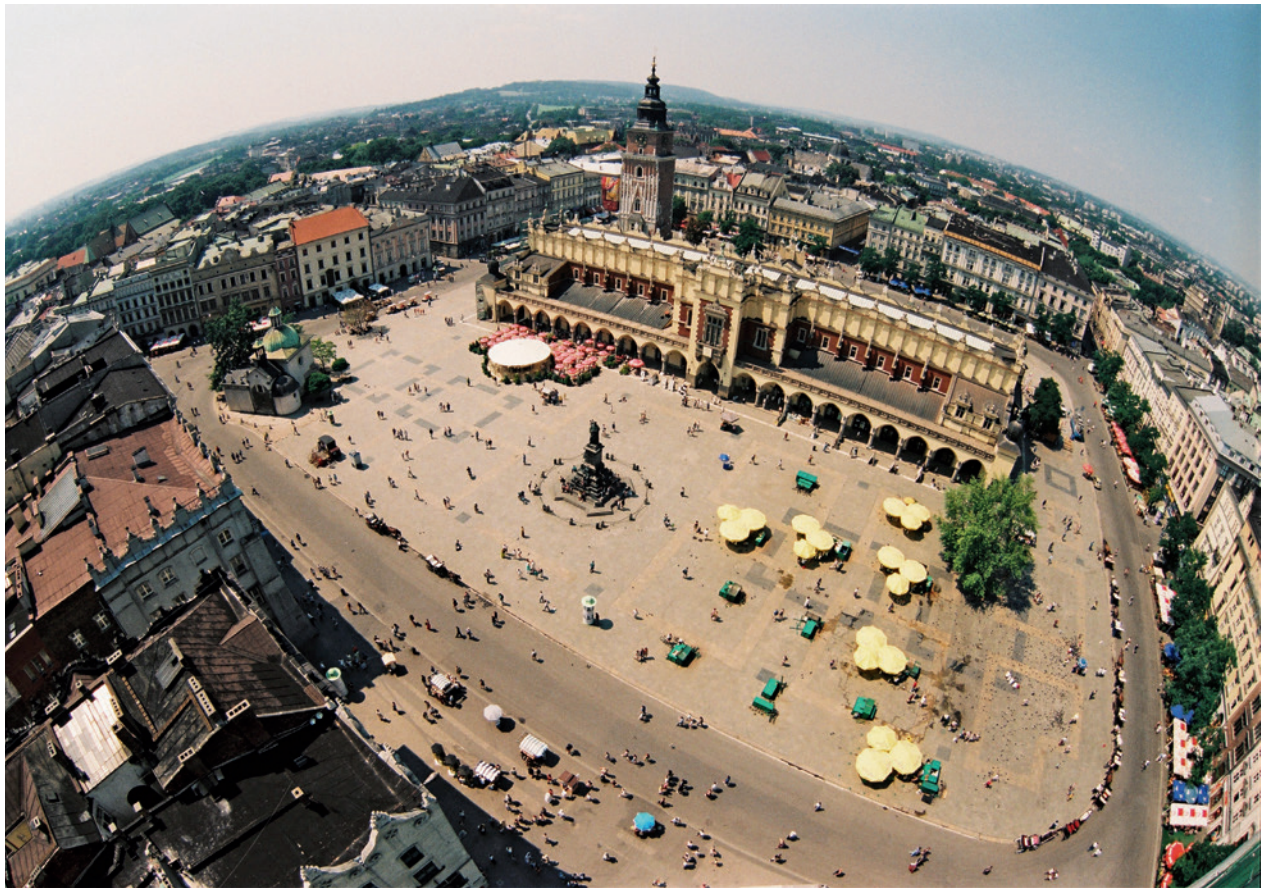
Rynek Główny w Krakowie przed wymianą nawierzchni; fot. P. Guzik, 2001 r.