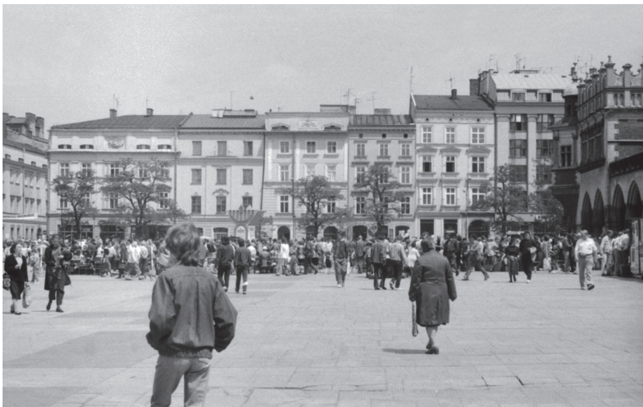
Północno-zachodnia część płyty Rynku Głównego

Wykonana według projektu prof. arch. Wiktora Zina w latach 1962–1964 nawierzchnia była w złym stanie 2 . O konieczności jej remontu mówiono już od końca lat 80. XX wieku. Kilka koncepcji modernizacji płyty Rynku powstało w latach 90. ubiegłego stulecia 3 . Zbliżała się 750. rocznica wystawienia aktu lokacji Krakowa na prawie magdeburskim 5 czerwca 1257 roku. Inwestycje w obszarze Rynku wpisywały się w program uczczenia tego wielkiego jubileuszu w roku 2007. Rynek – centrum układu lokacyjnego miasta – wymagał nowej aranżacji i oprawy, tym bardziej że w 2000 roku Kraków był Europejską Stolicą Kultury.