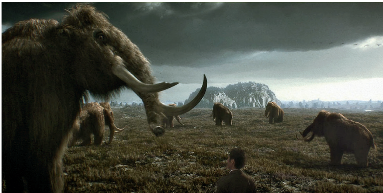
Kadr z filmu Cracovia. Origo . Około 20 000 lat p.n.e. W głębi skała Wawelu; w zbiorach Muzeum Historycznego Miasta Krakowa

Autorzy Konceptji MHK zamierzali przedstawić w przystępnej formie wyniki badań naukowych z dziedziny antropologii, dendrochronologii, archeozoologii, archeobotaniki, geologii, za pomocą prezynterów i instalacji multimedialnych. Ekspozycji miały towarzyszyć efekty akustyczne, imitujące np. gwar handlowy na Rynku, skrzypienie wagi, turkot wozów załadowanych towarami, odgłosy pracy w warsztatach rzemieślniczych. Podkreślano dużą rolę oświetlenia, które tworzyłoby znaczącą część scenografii rezerwatu.