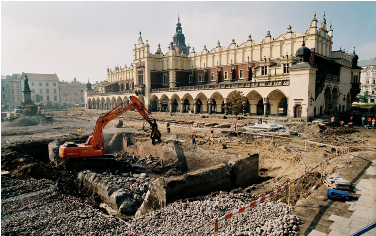
Wschodnia część Rynku Głównego w Krakowie, rozbiórka poniemieckiego zbiornika przeciwpożarowego, z prawej, w głębi, demontaż fontanny W. Zina; fot. P. Guzik, październik 2005 r.

do przeprowadzonych rozmów – przekazać uzyskaną przestrzeń w użytkowanie Muzeum Historycznemu Miasta Krakowa z przeznaczeniem na działalność statutową 41 . Była to zapowiedź utworzenia w przyszłości nowego oddziału Muzeum Historycznego w podziemiach Rynku.