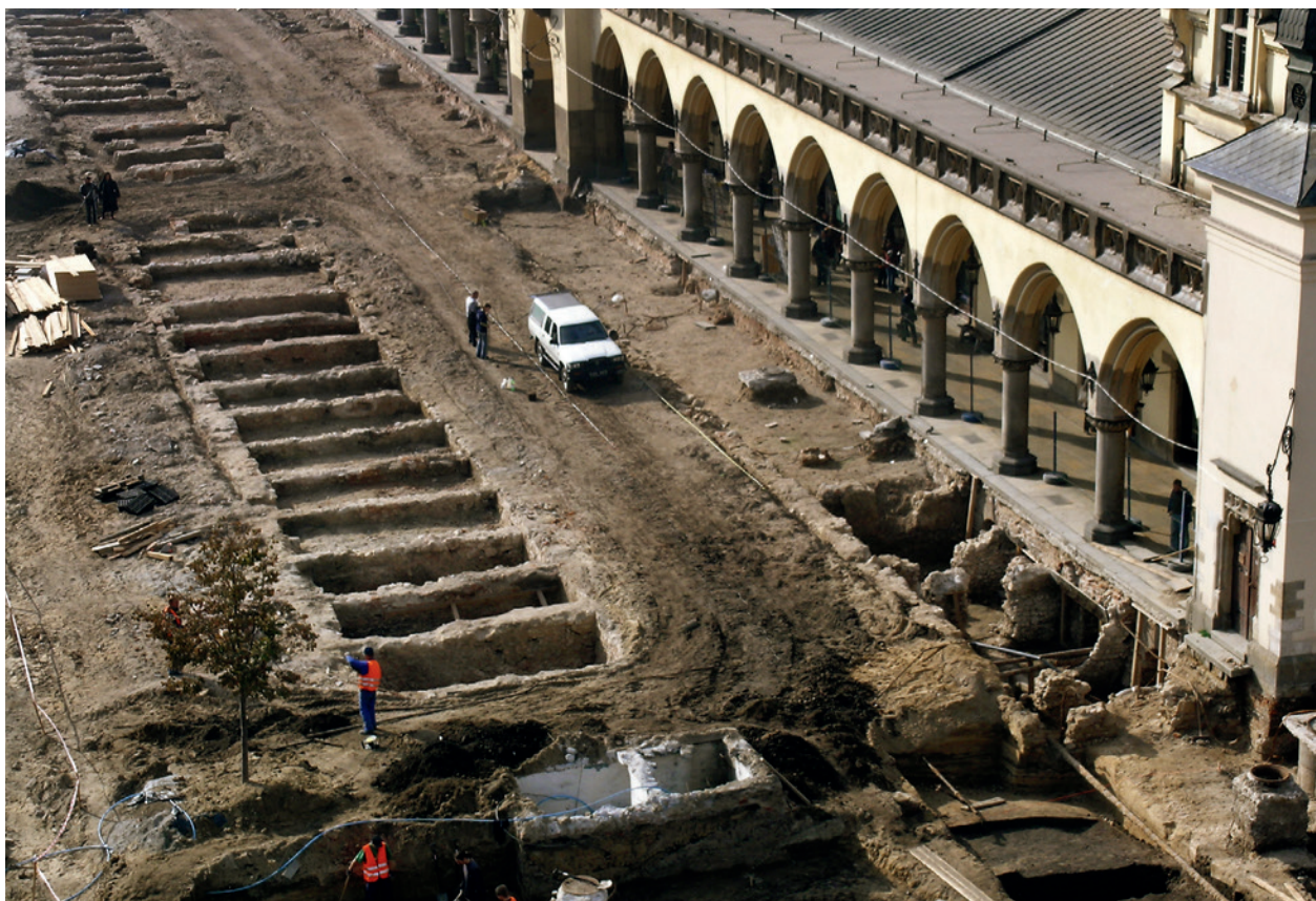
Północno-wschodnia część Rynku Głównego w Krakowie w trakcie prac archeologicznych. Odslonięty wschodni rząd piwnic Kramów Bogatych i kilka piwnic zachodniego rzędu; fot. P. Guzik, 2005 r.

28 października 2005 roku została zawarta pomiędzy Muzeum Historycznym Miasta Krakowa a Pracownią Archeologiczno-Architektoniczną Niegoda umowa o współpracy „(...) w zakresie pozyskiwania, zabezpieczania, opracowania i upowszechniania materiałów zabytkowych odnalezionych w trakcie prac wykopaliskowych, prowadzonych przez Pracownię, w oparciu o program badawczy (...), na wschodniej części Rynku Głównego w Krakowie, na podstawie zezwolenia konserwatorskiego (...) z dnia 3 sierpnia 2005 roku” 58 . Zaznaczono również, że materiał zabytkowy, pozyskany w trakcie prac badawczych, wraz z dokumentacją połową zostanie przekazany Muzeum Historycznemu.