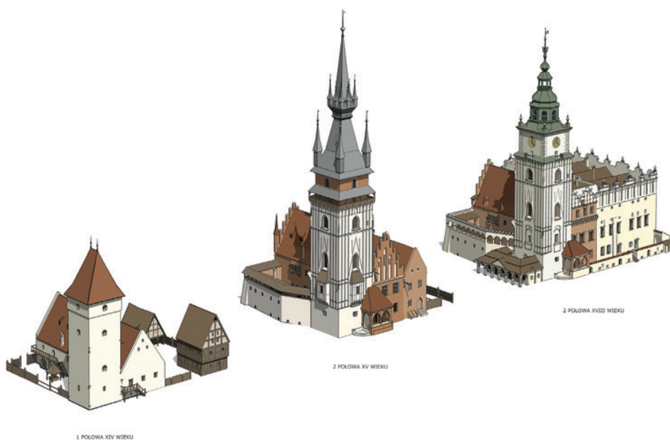
1 POŁOWA XIV WIEKU

2nd half of the eighteenth century tower numbering three stories high, with a clock on the top, is covered with a classical cupola. On the opposite side of the town hall was built in the years 1561-1563, covered the building and granary. Low classical guardhouse adjacent to the tower from the south is representative part of this team.