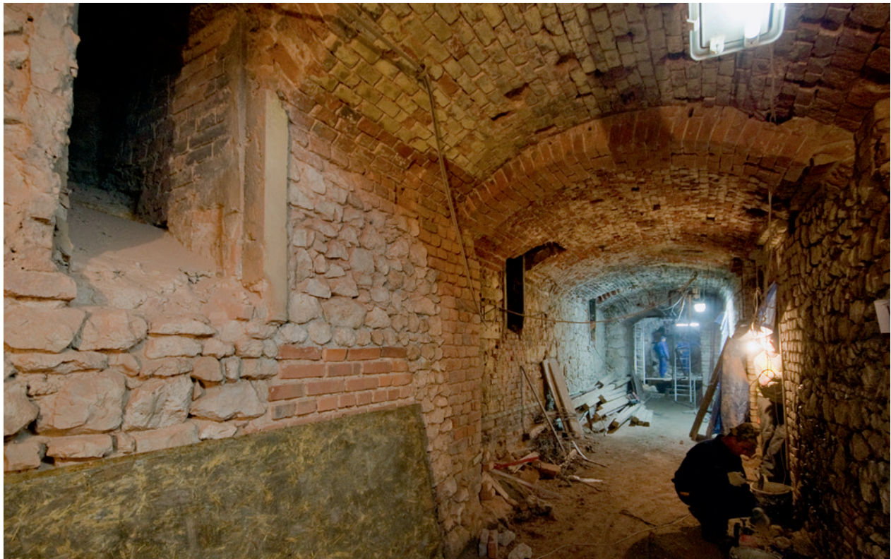
Piwnice Sukiennic, część północno-wschodnia – korytarz, budowa trasy turystycznej; fot. B. Woch, 30 listopada 2009 r.; w zbiorach Muzeum Historycznego Miasta Krakowa

zóny z pracowników Muzeum Historycznego (dalej Zespół MHK) do przygotowania koncepcji, projektu i scenariusza podziemnej ekspozycji, nazwanej roboczo Rynek Podziemny 110 . Do realizacji tego celu została też utworzona Pracownia Rynek Podziemny oraz Pracownia Modelarska. W ramach Pracowni Dokumentacji Architektury i Zmian Urbanistycznych Miasta Krakowa realizowano duży program cyfrowych rekonstrukcji średniowiecznych i nowożytnych budowli krakowskiego Rynku.