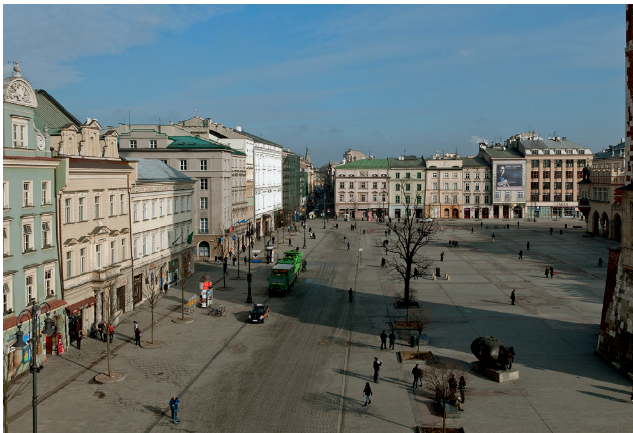
Zachodnia część Rynku Głównego, widok w kierunku północnym; fot. B. Woch, 2010 r.; w zbiorach Muzeum Historycznego Miasta Krakowa

BŁOGOSŁAW OJCZE KAŻDEGO DNIA / UKOCHA- NEMU MIASTU / I NASZEJ OJCZYŹNIE / UMIŁO- WANEMU OJCU ŚWIĘTEMU / JANOWI PAWŁOWI II / WIELKIEMU POLAKOWI / 11 LISTOPADA 2006 ROKU WDZIĘCZNI KRAKOWIANIE. W krzyżu Su- kiennic 3 czerwca 2007 roku odsłonięto odlaną w brązie płytę z okazji 750. rocznicy lokacji Krakowa 16 . 4 września 2010 roku wmurowano w płytę Rynku replikę historycznej tablicy z napisem: NIE ODDAMY SIERPNIĄ / SOLI- DARNOŚĆ MAŁOPOLSKA W DRUGĄ ROCZNICĘ POROZUMIEŃ GDAŃSKICH / KRAKÓW SIERPIEŃ 1982. TABLICA PRZYWRÓCONA STARANIEM MA- ŁOPOLSKIEJ SOLIDARNOŚCI W TRZYDZIESTĄ ROCZNICĘ POLSKIEGO SIERPNIĄ 17 . Wymienione obiekty małej architektury, umieszczone w centrum prze- strzeni publicznej miasta, są „znakami pamięci”, nośnikami wiedzy o ważnych wydarzeniach w historii Polski.