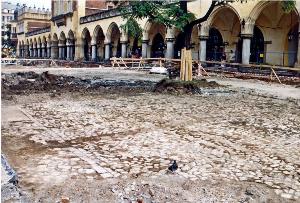
Część zachodnia Rynku Głównego w Krakowie, nawierzchnia w trakcie przebudowy. Bruk z kamieni wapiennych wykonany w latach 80. XIX w., użytkowany do lat 60. XX w. (przebudowa W. Zina); fot. E. Zaitz, 2004 r.