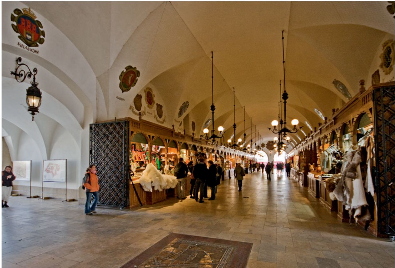
Odnowiona północna część hali Sukiennic. U dołu płyta brązowa upamiętniająca 750. rocznicę lokacji Krakowa na prawie magdeburskim, odsłonięta 3 czerwca 2007 r.; fot. B. Woch, 21 października 2010 r.; w zbiorach Muzeum Historycznego Miasta Krakowa