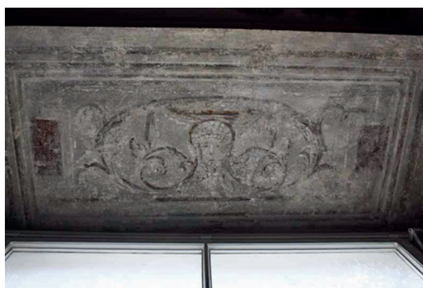
Skrzydło zachodnie pałacu Pod Krzysztofory, fragment odsłoniętej polichromii

Zmierzch rezydencji nastąpił wraz z upadkiem Rzeczypospolitej pod koniec XVIII wieku. W 1790 roku pałac drogą kupna przeszedł w ręce Jacka Kluszewskiego (1761–1841), starosty brzegowskiego, wielce zasłużonego dla teatru krakowskiego, jednego z najbardziej majątnych obywateli Krakowa, związanego z kręgiem masonerii. Do rangi niemal symbolu urasta fakt usunięcia z fasady pałacu w 1791 roku figury św. Krzysztofa z Dzieciątkiem na ramieniu – odwiecznego godła narożnej kamienicy Pod Krzysztofory 4 .