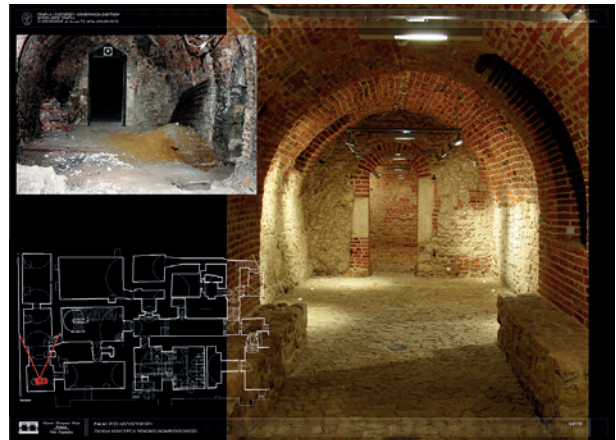
Widok wnętrza przedproży, stan przed i po konserwacji

nia biurowe, zaś w oficynie od ul. Jagiellońskiej pracownice konserwatorskie i magazyny. Pomieszczenia parterowe skrzydła zachodniego pałacu oraz część piwnic zajmował do 22 października 2009 roku Ośrodek Dokumentacji Sztuki Tadeusza Kantora – Cricoteka. Przekazanie tych pomieszczeń na cele Muzeum de facto i de iure umożliwi wykonanie prac remontowo-konserwatorskich w pełnym zakresie.