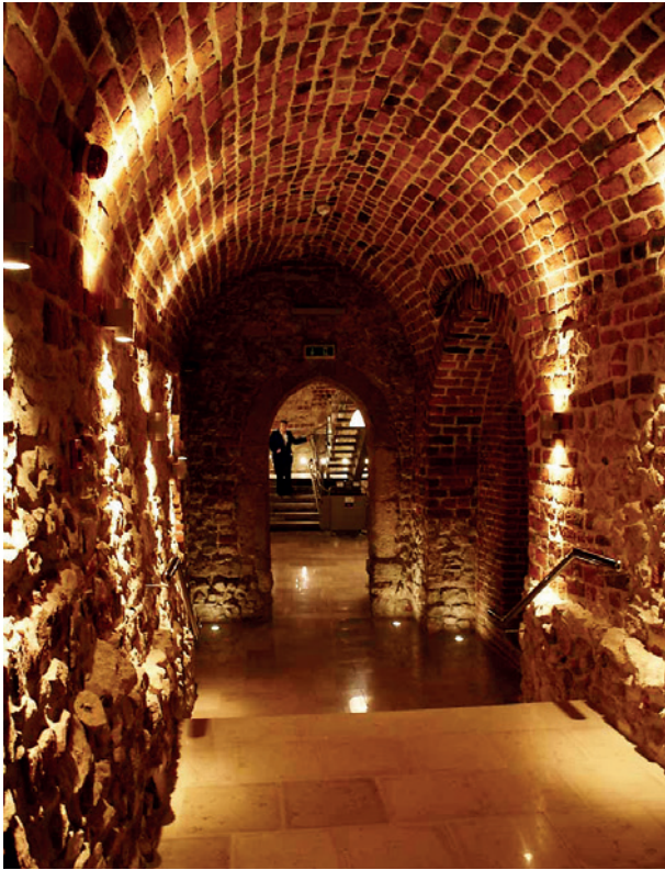
Widok ogólny piwnic po konserwacji; fot. M. Suchowiak

sze badania źródłowe powinny wyjaśnić pierwotną funkcję pomieszczenia oraz program ideowy malowidła. Oczyszczono mury z węglowej „patyny”, zakonserwowano, częściowo zrekonstruowano i udokumentowano detale architektoniczne, położono nowe posadzki, a w przedprożach bruk, wydobyty w trakcie prac na Rynku Głównym. Wnętrza oświetlił i wyeksponował blask iluminacji. Wykonano nowe, o współczesnych formach, zejście z sieni do piwnic przyrynkowych.