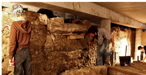
Prace konserwatorskie zewnętrznych murów przedproży

Rozpoczęte dzieło restauracji niegdyś rezydencji możnowładczej, mające na celu zachowanie i wyeksponowanie oryginalnych walorów stylowych, przywrócenie charakteru i klimatu reprezentacyjnym wnętrzom pałacowym, a także przystosowanie ich do funkcji nowoczesnego muzeum, jest wielkim wyzwaniem dla projektanta i skomplikowanym przedsięwzięciem logistycznym dla służb inwestorskich. Doko-