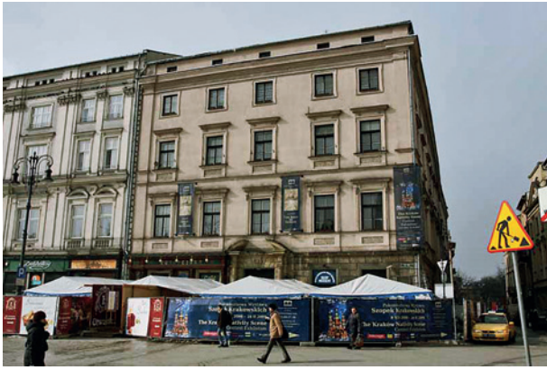
Widok pałacu Pod Krzysztofory, stan prac przy budowie ekspozycji przedproży, fot. M. Suchowiak, 2009