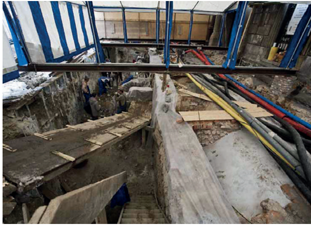
Prace przy budowie ekspozycji zewnętrznej przedproży