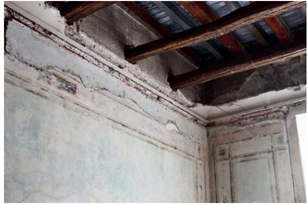
Skrzydło zachodnie pałacu, fragment stropu drewnianego po usunięciu faset, fot. M. Suchowiak