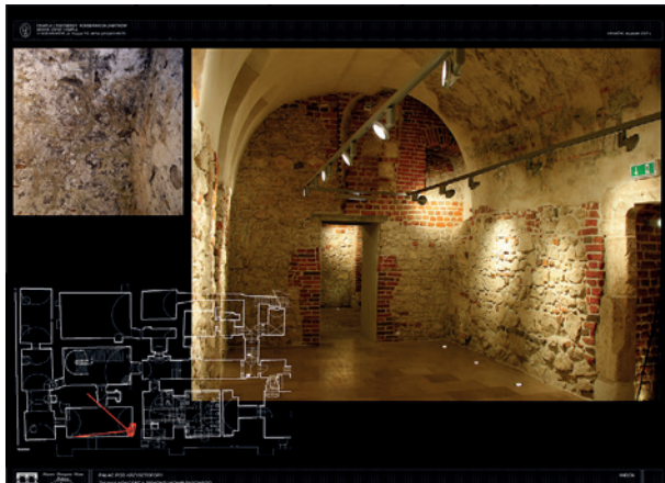
Widok komory piwnicznej z malarską dekoracją sklepienia