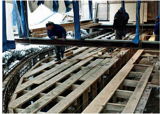
Prace przy budowie ekspozycji zewnętrznej przedproży; fot. M. Suchowiak

Kluszewskiego 14 . Klasycystyczne malowidła wykonane na dobrym poziomie artystycznym, miejscami zniszczone wskutek prowadzenia różnorodnych przewodów instalacyjnych, zostały odsłonięte i poddane konserwacji technicznej; zakres rekonstrukcji oraz aranżacja plastyczna zostaną ustalone w trakcie prac konserwatorsko-adaptacyjnych wewnątrz 15 .