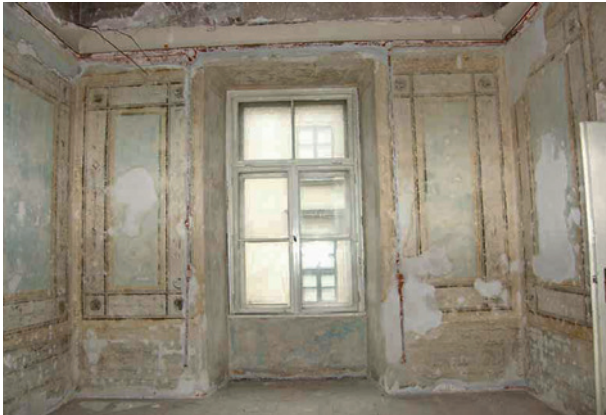
Skrzydło zachodnie pałacu Pod Krzysztofory, odłonięta polichromia wewnątrz z przełomu XVIII i XIX w., stan po konserwacji