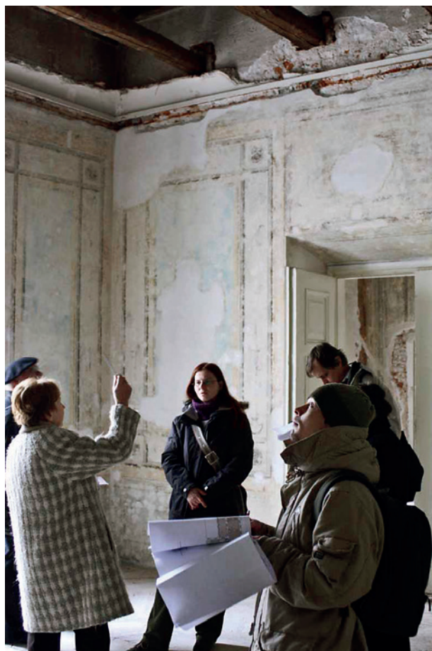
Skrzydło zachodnie pałacu Pod Krzysztofory, komisja ustalająca program funkcjonalny wewnątrz, fot. M. Suchowiak, marzec 2009