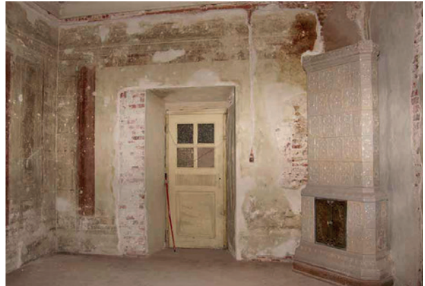
Skrzydło zachodnie pałacu Pod Krzysztofory, odłonięta polichromia wewnątrz z przełomu XVIII i XIX w., stan po konserwacji

sięgającą czasów średniowiecza, na bazie których wzniesiona została nowożytna budowla pałacowa, urządzona i wyposażona z nadzwyczajnym przepychem, bogactwem dzieł sztuki, o których do dziś krążą urocze legendy krzysztoforskie.