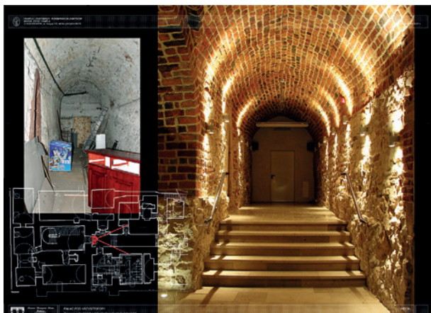
Widok komory piwnicznej; stan przed i po konserwacji