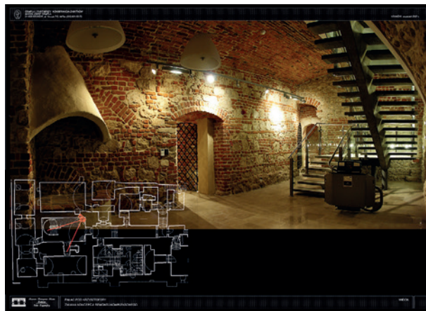
Widok komory piwnicznej z nową klatką schodową

rów, m.in. mieszkał tutaj Szczepan Humbert (1756–1829), wybitny architekt francuskiego pochodzenia.