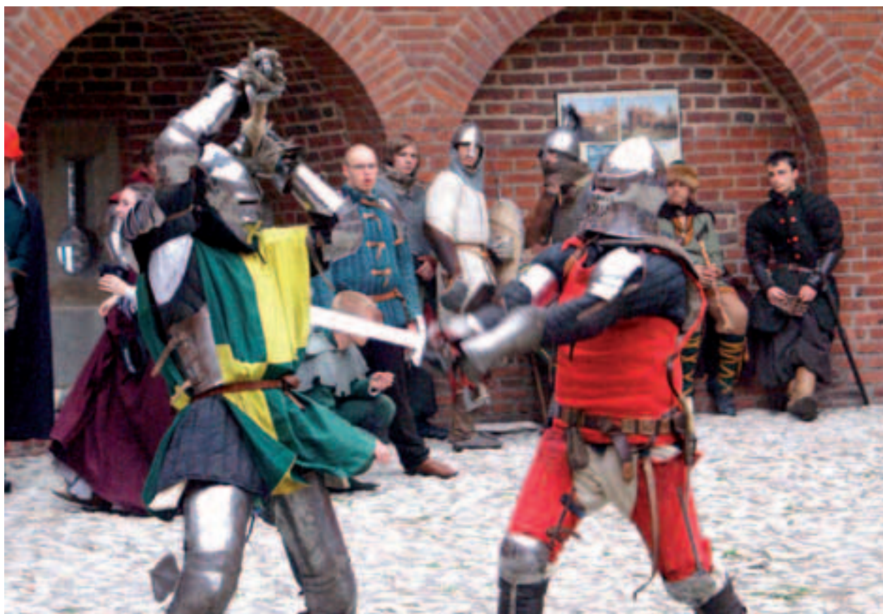
Barbakan, Spotkania ze średniowieczem, w oczekiwaniu na turniej