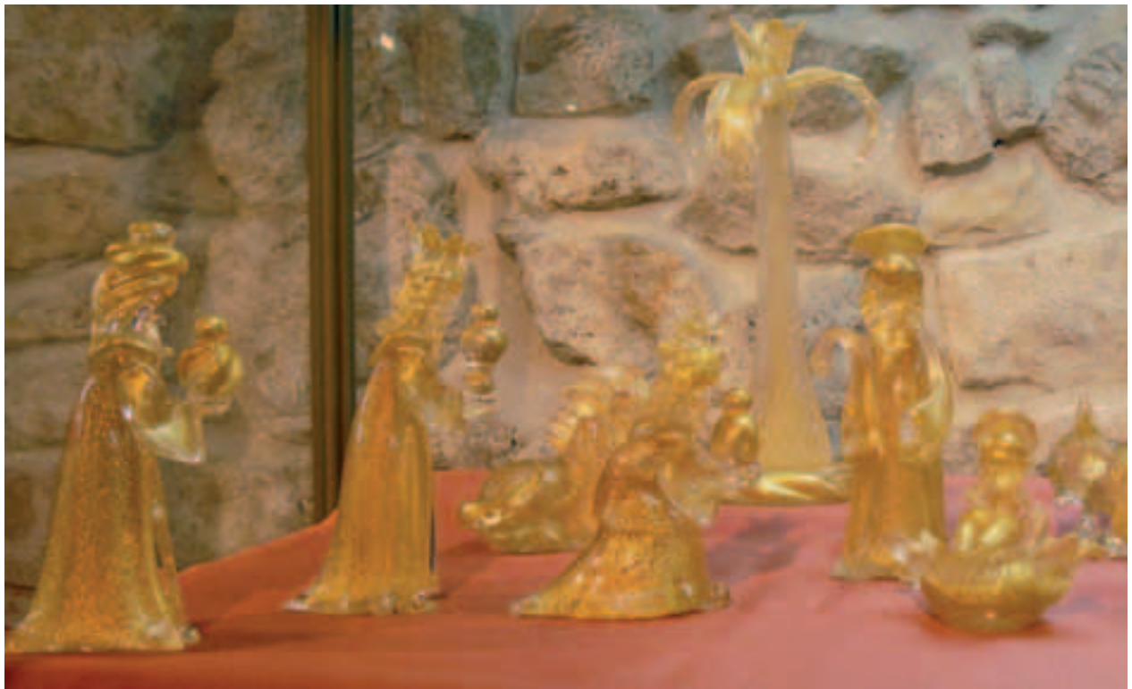
Fragmenty ekspozycji Pod szklana gwiazdą, szopki szklane i ceramiczne okregu Bassano del Grappa