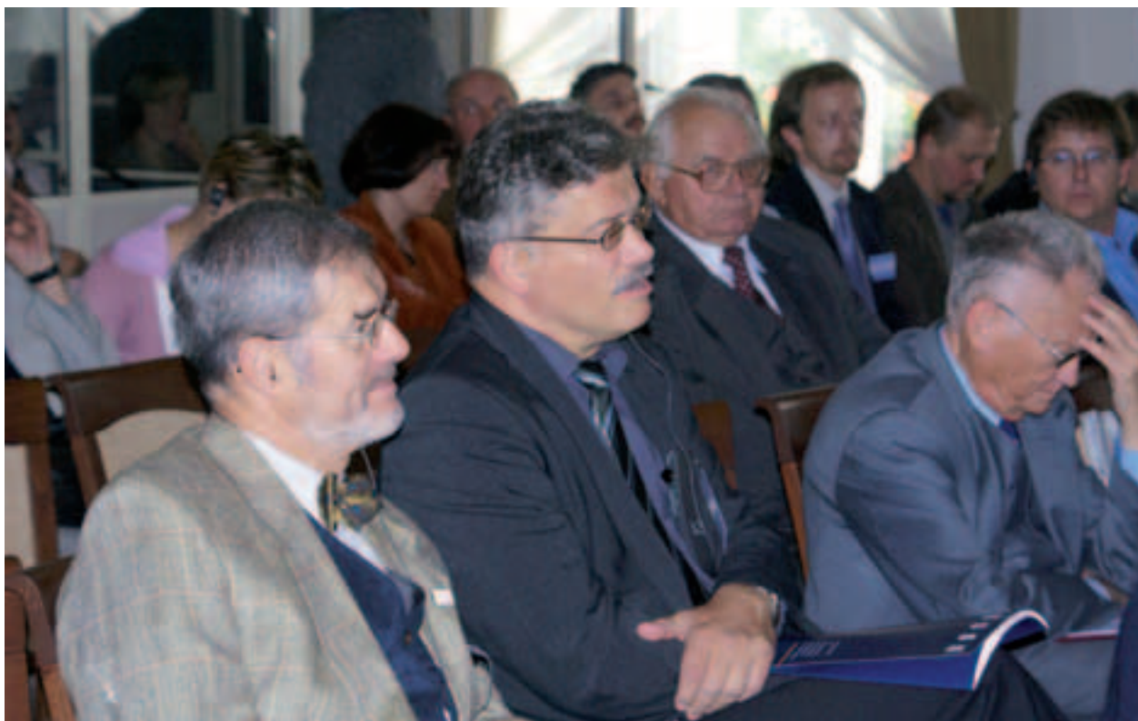
Uczestnicy sesji Kraków – dziedzictwo lokacji

ułatwiły pozyskanie sponsorów, którzy wsparli finansowo działania Muzeum, dzięki czemu organizowane imprezy stały na wysokim poziomie oraz udało się w pełni zrealizować plany wydawnicze.