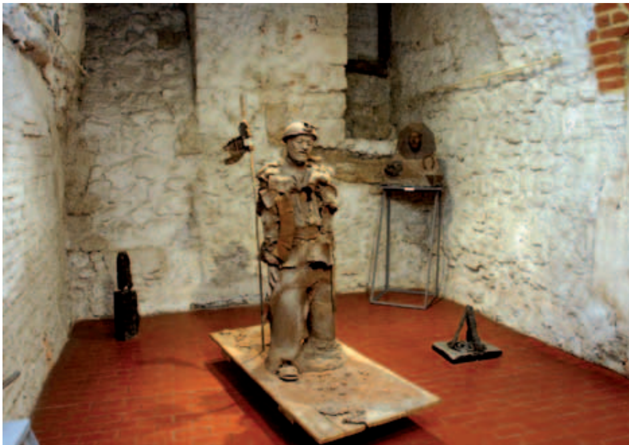
Fragment wystawy Z pracowni Małgorzaty Olkuskiej, Galeria Kamienicy Hipolitów

dialog z ukrzyżowanym Chrystusem – sumieniem i pocieszycielem człowieka. Komisarzem ekspozycji z ramienia muzeum był Jerzy Segda.