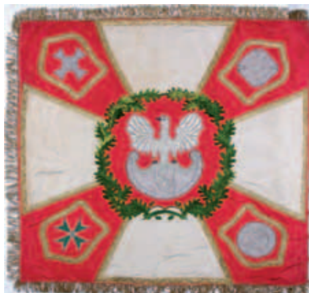
Sztandar Związku Strzeleckiego z Żydaczowa (awers i rewers), jedwab, haft ręczny, XX-lecie międzywojenne, nr inw. 5979/III

maliśmy też interesujący zbiór obiegowej waluty monarchii austro-węgierskiej z XIX i początku XX wieku. Zasób muzealny w ciągu omawianego roku wzrósł o 1300 eksponatów (zakupy – 484, dary – 397, przekazy – 419) i osiągnął liczbę 80 402 obiektów.