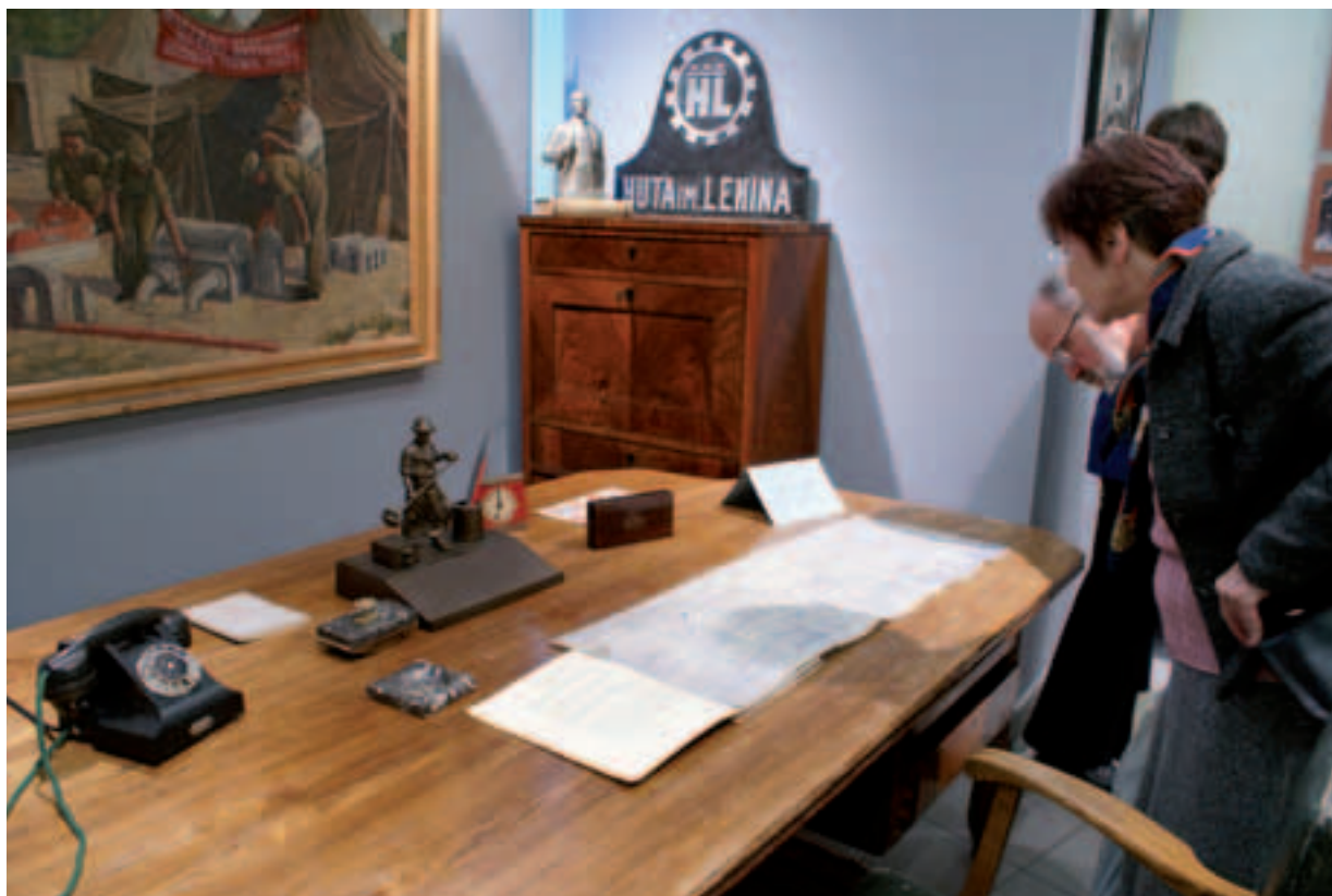
Fragment wystawy Nowohucki design. Historia wnętrz i ich twórcy w latach 1949–1959