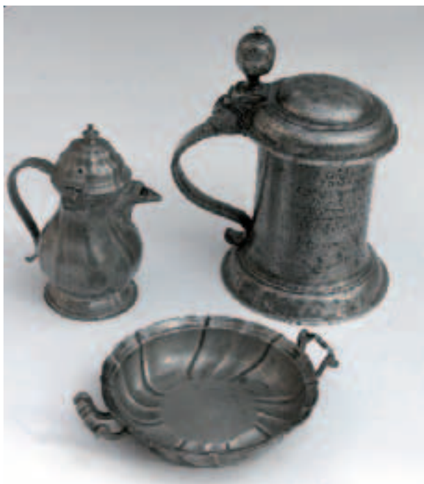
Fragment kolekcji naczyń cynowych składającej się ze 147 obiektów od XVII po XIX w., nr inw. 1344/III, 1365/II, 1412/II