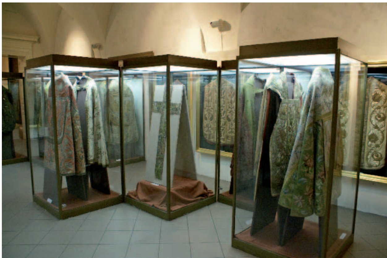
Fragment ekspozycji Skarby krakowskich klasztorów. Zbiory oo. Dominikanów. 750. rocznica śmierci św. Jacka Odrowąża, zabytkowe tkaniny, w tym ornaty i kapy; fot. J. Korzeniowski