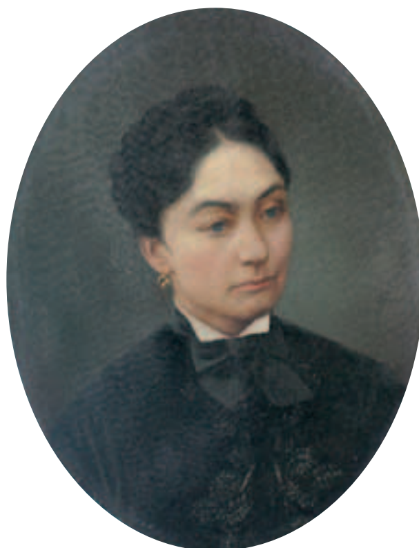
Portret Marii Babireckiej, primo voto Fabjańskiej, secundo voto Sokołowskiej, malarz nieustalony, olej, płótno, 2 połowa XX w., nr inw. 5986/III; fot. J. Korzeniowski