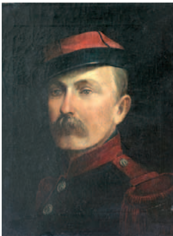
Autoportret Erazma Fabjańskiego, olej, płótno, ok. 1870, nr inw. 5984/III