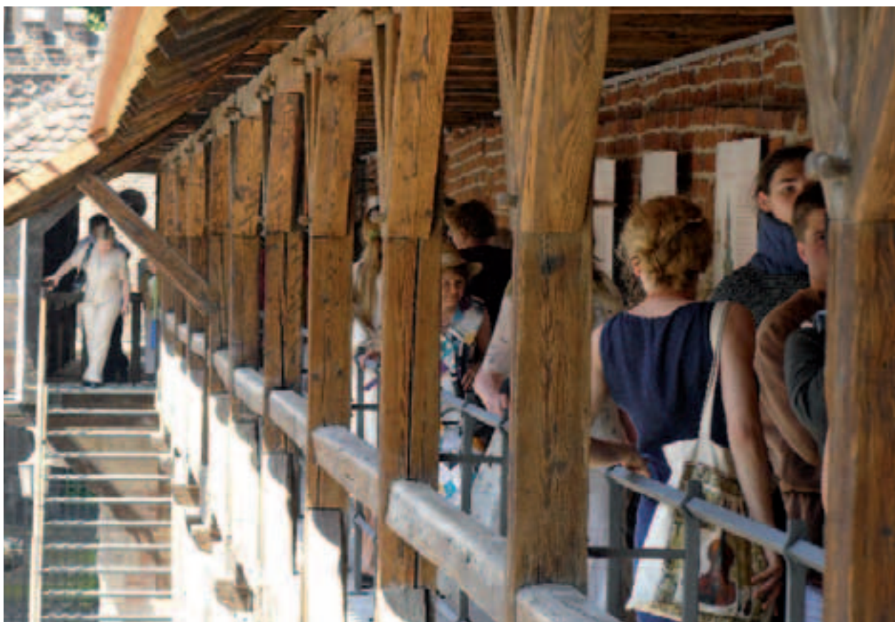
Otwarcie trasy turystycznej na Murach Obronnych – pierwsi widzowie