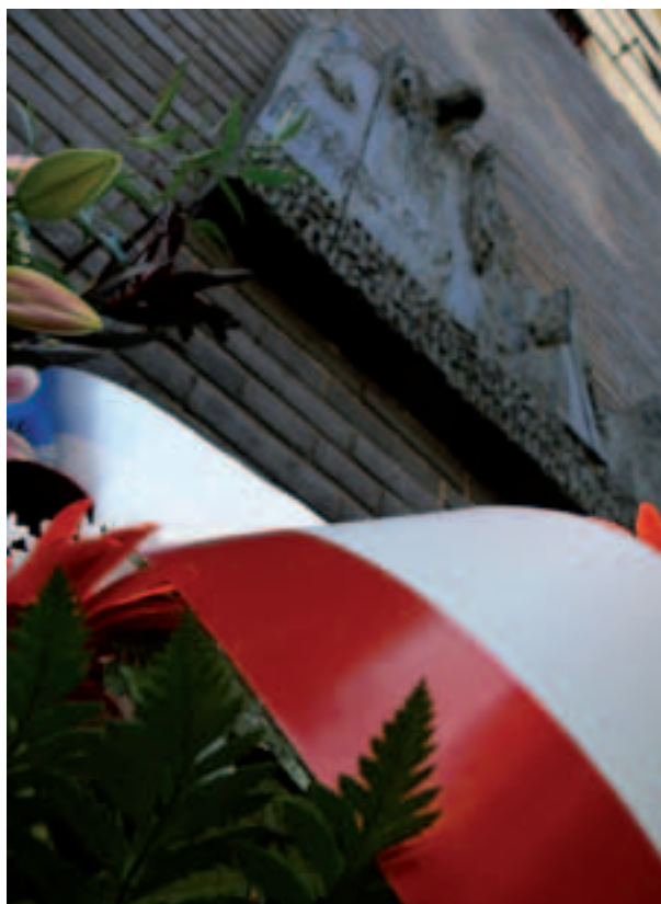
Obchody Dnia pamięci ofiar gestapo – tablica pamiątkowa na Domu Śląskim, przy ul. Pomorskiej 2

9 września 2007 roku oddział Ulica Pomorska zorganizował po raz pierwszy Dzień pamięci ofiar gestapo . Impreza będzie odbywać się corocznie na początku września, by stale przypominać tragiczną historię domu przy ul. Pomorskiej 2, który do 17 stycznia 1945 roku był siedzibą Komendy Policji i Służby Bezpieczeństwa w dystrykcie Kraków. Oddział Ulica Pomorska sprawuje pieczę nad zabytkowymi celami aresztu nazistów, z inskrypcjami więźniów, które zachowane do dziś stanowią dokument niemieckiej okupacji miasta. W programie Dnia Pamięci znalazły się m.in.: uroczysty apel ku czci ofiar gestapo z udziałem kombatanów, przedstawicieli władz państwowych i lokalnych oraz kompanii honorowej Wojska Polskiego, złożenie kwiatów przy tablicy pamiątkowej na ścianie dawnej katowni przy ul. Pomorskiej 2, liczne wykłady i projekcje filmów dokumentalnych. Impreza jest organizowana głównie z myślą o młodzieży szkolnej.