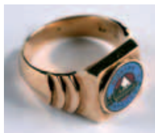
Pamiątkowy sygnet bramkarza Garbarni Mariana Gregorczyka, złoto, 1931, nr inw. 5978/III; fot. J. Korzeniowski