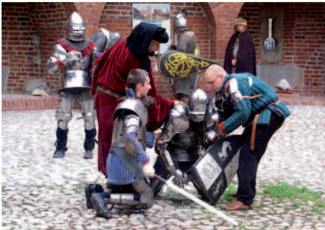
Barbakan, Spotkania ze średniowieczem, w oczekiwaniu na turniej