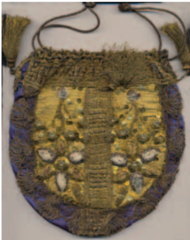
Torebka do żydowskiego stroju kobiecego, XIX w., nr inw. 942/VII