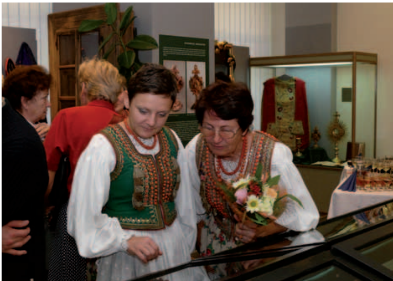
Wernisaż wystawy Nowohucki design. Historia wnętrz i ich twórcy w latach 1949–1959