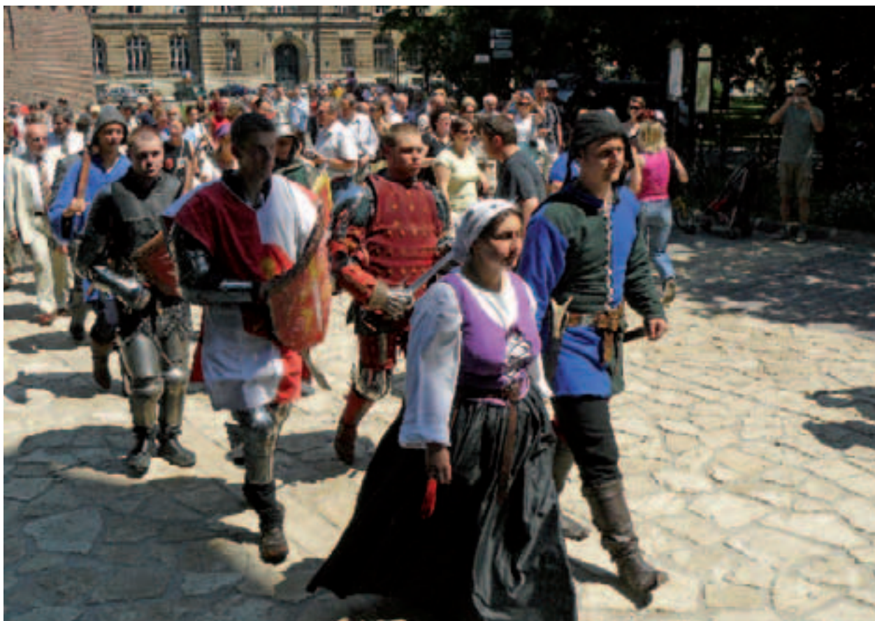
Otwarcie trasy turystycznej na murach obronnych, pierwsi widzowie