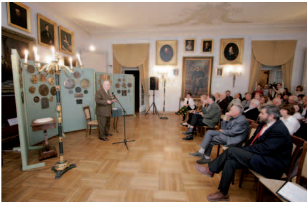
Wystawa Najciekawsze nabytki Muzeum Historycznego Miasta Krakowa 2007, pokaz kolekcji medalionów rodziny Kałkowskich