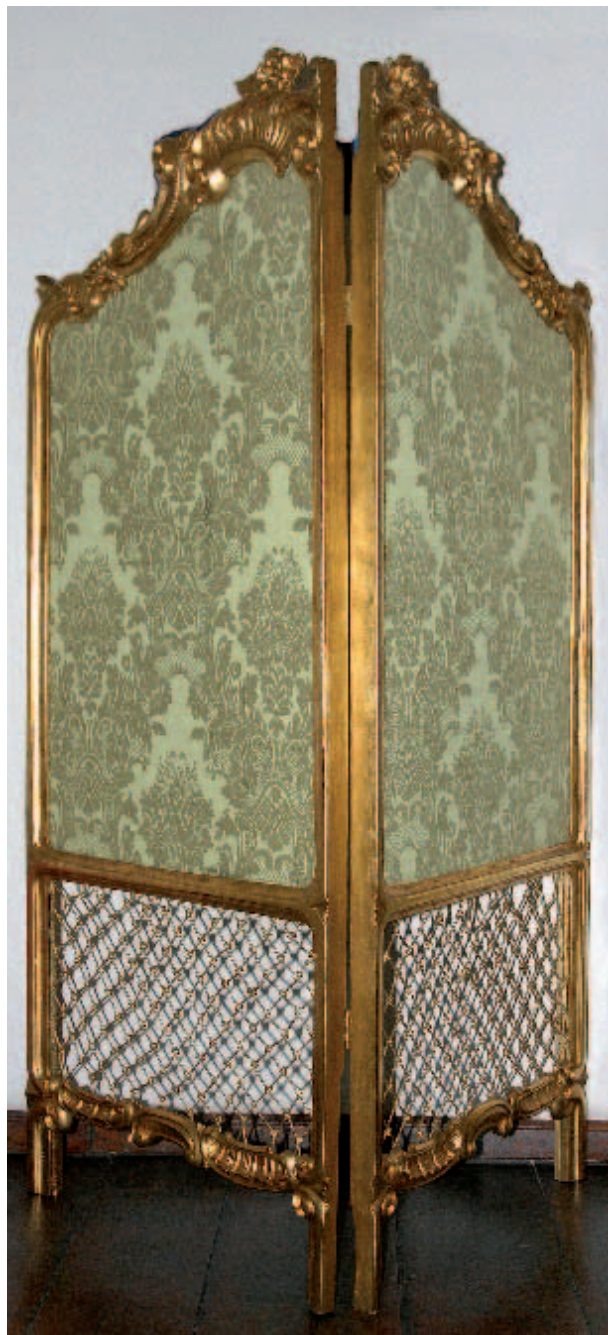
Parawan neorokokowy, dwuskrzydłowy, XIX w., nr inw. 5983/III; fot. J. Korzeniowski