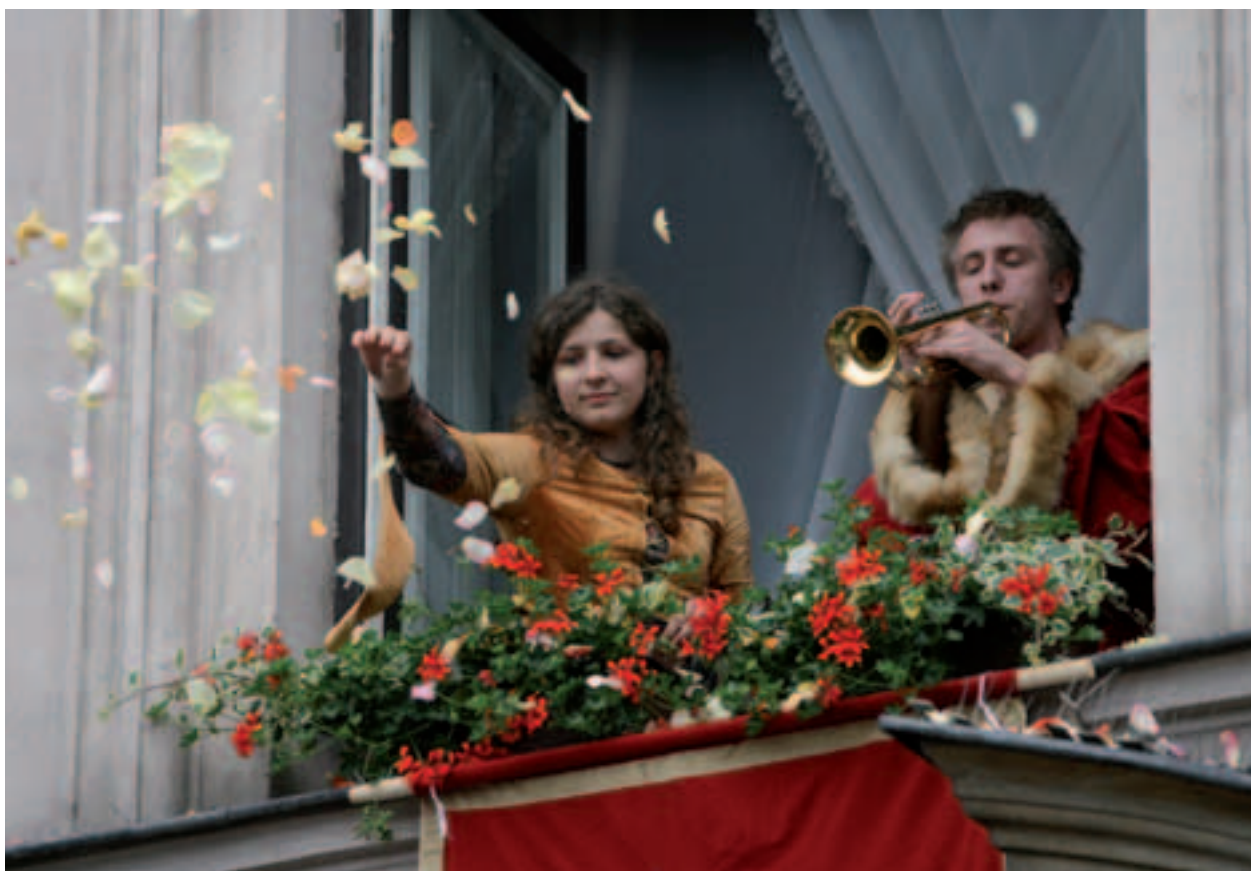
Powitanie gości wernisażu płatkami róż sypanymi z okien Pałacu Krzysztofory