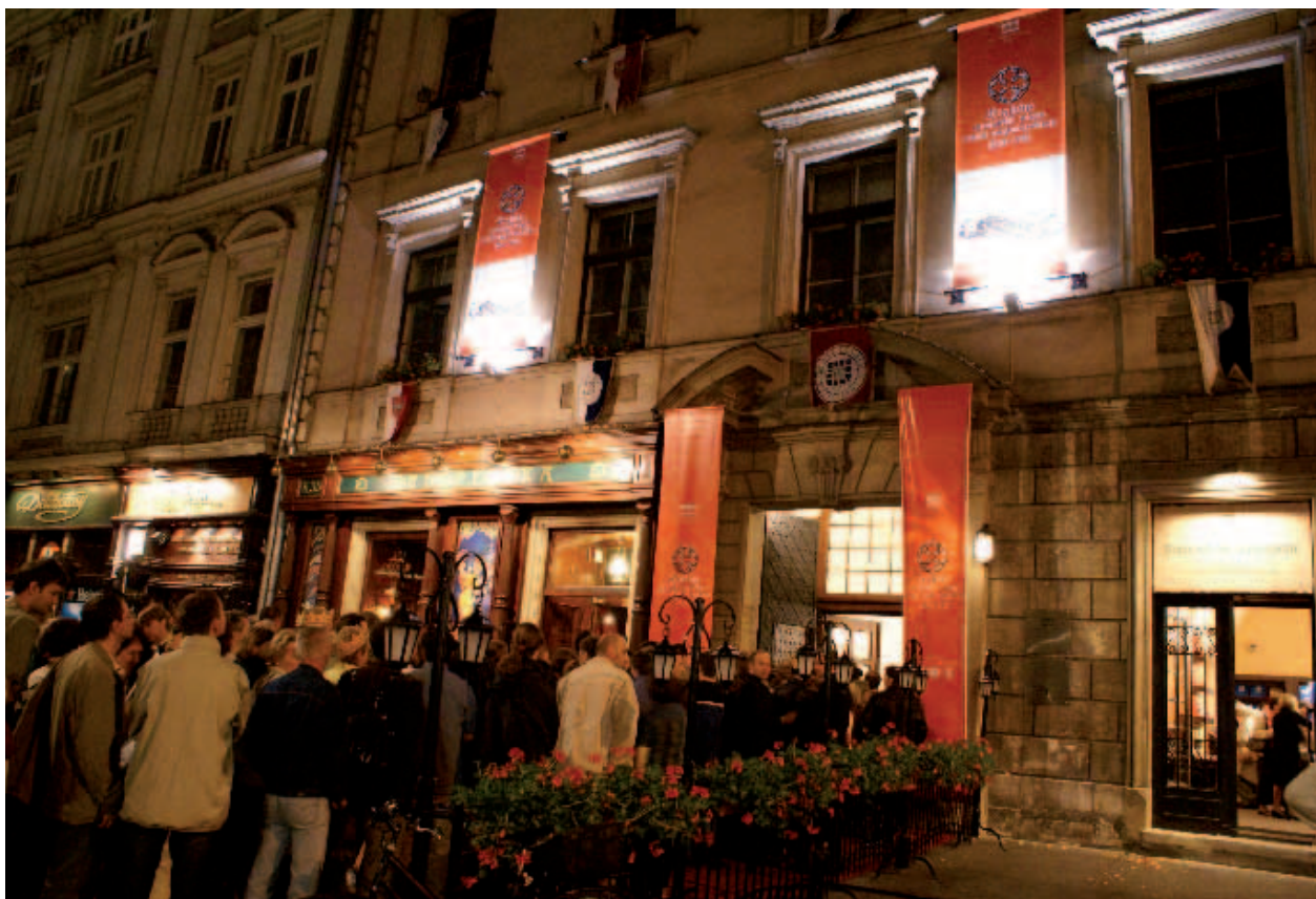
Nocne zwiedzanie wystawy – Kraków europejskie miasto prawa magdeburskiego 1257–1791, zwiedzający w kolejce do wejścia na wystawę; fot. M. Suchowiak