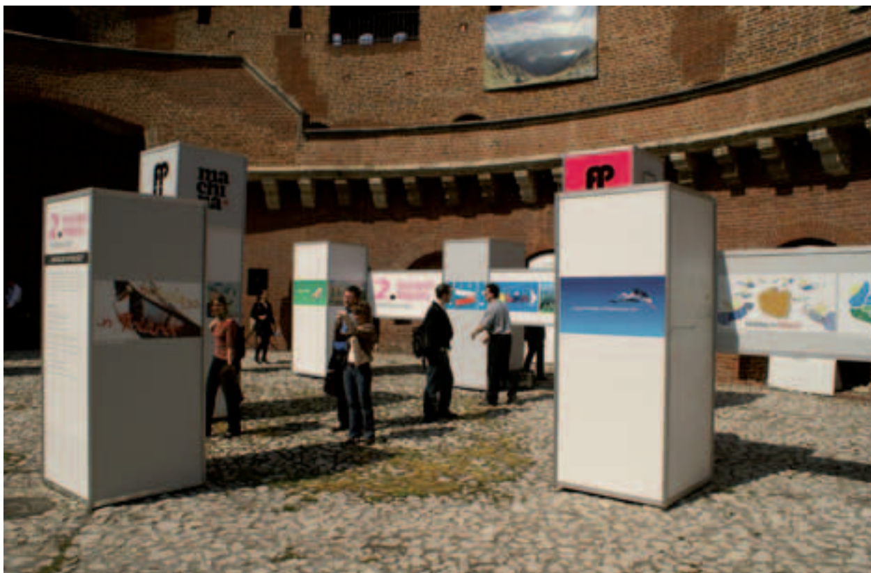
Wystawa II Festiwalu Plakatu Reklamowego Wakacje w Polsce, w Barbakanie

wystawy: Nowohucki design. Historia wnętr i jej twórcy w latach 1949–1959 , Skarby krakowskich klasztorów. Zbiory oo. Dominikanów. 750. rocznica śmierci św. Jacka Odrowąża (tę omówiłem powyżej) oraz Marcin Samlicki. Malarstwo. Wystawa ze zbiorów Muzeum im. Stanisława Fischera w Bochni .