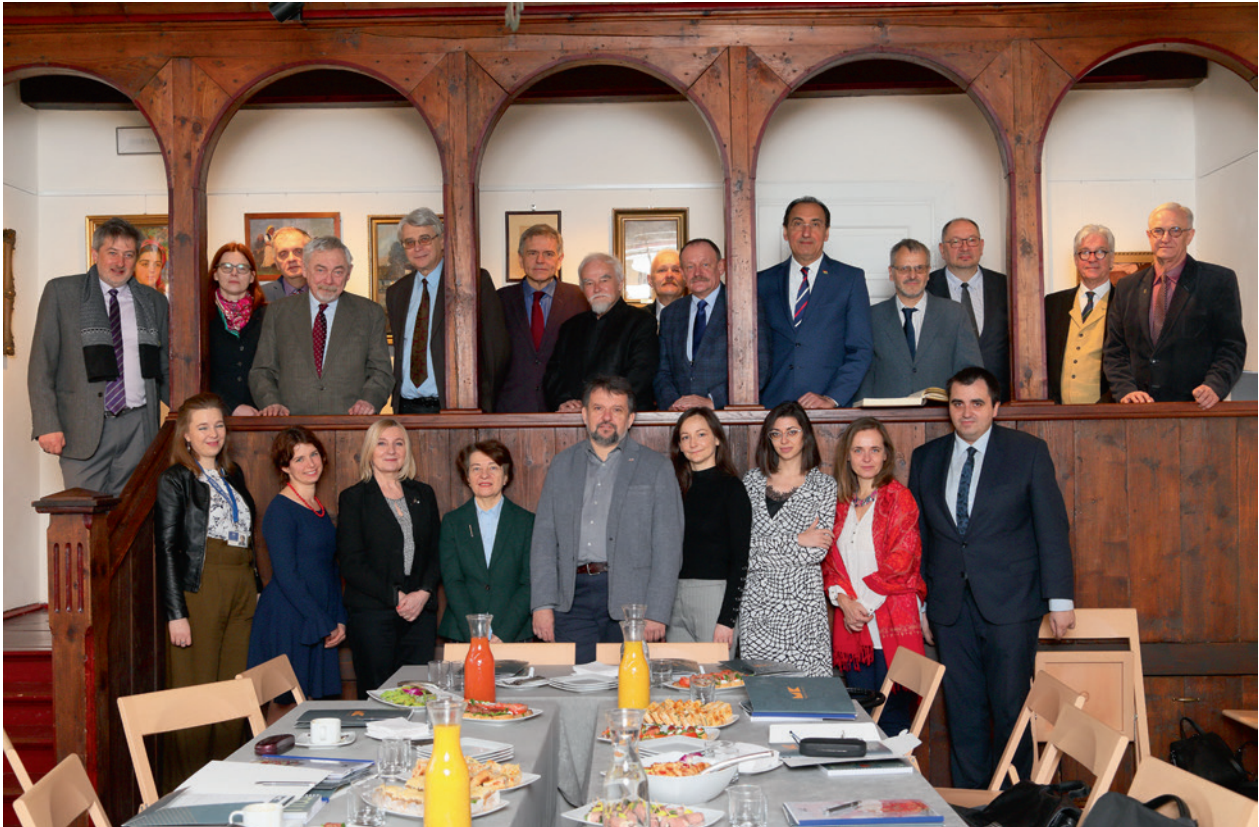
Posiedzenie Rady Muzeum Krakowa w Rydlówce, 14 marca 2019 r., fot. Andrzej Janikowski

4 mln zł, co świadczy o niezwykle dynamicznej rozbudowie instytucji.