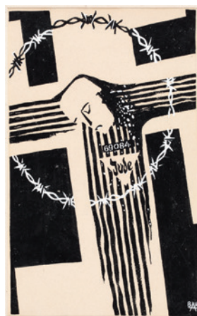
Józef Bau, Boże mój! Boże mój! – czemuś mnie opuścił? ( Ukrzyżowany Żyd – Crucified Jew ), Kraków, 1945–1953, rysunek, ołówek, tusz, papier, 30,6 × 20,5 cm, sygn. MHK-3893/VIII