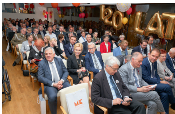
Gala 120-lecia Muzeum Krakowa, sala Miedziana w pałacu Pod Krzysztofory, 31 maja 2019 r.

Muzeum Krakowa zainaugurowało swoją działalność ofertą opracowaną specjalnie z okazji jubileuszu, ale jednocześnie będącą mocnym otwarciem na nowe kierunki pro-