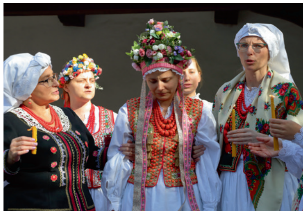
Czepiny w Rydlówce , 21 września 2019 r.

Jom Riszon – niedziela w Starej Synagodze to kameralne wydarzenie w tym oddziale Muzeum Krakowa, które miało miejsce 6 października 2019 roku. Składało się z kilku wykładów naukowców z Uniwersytetu Pedagogicznego