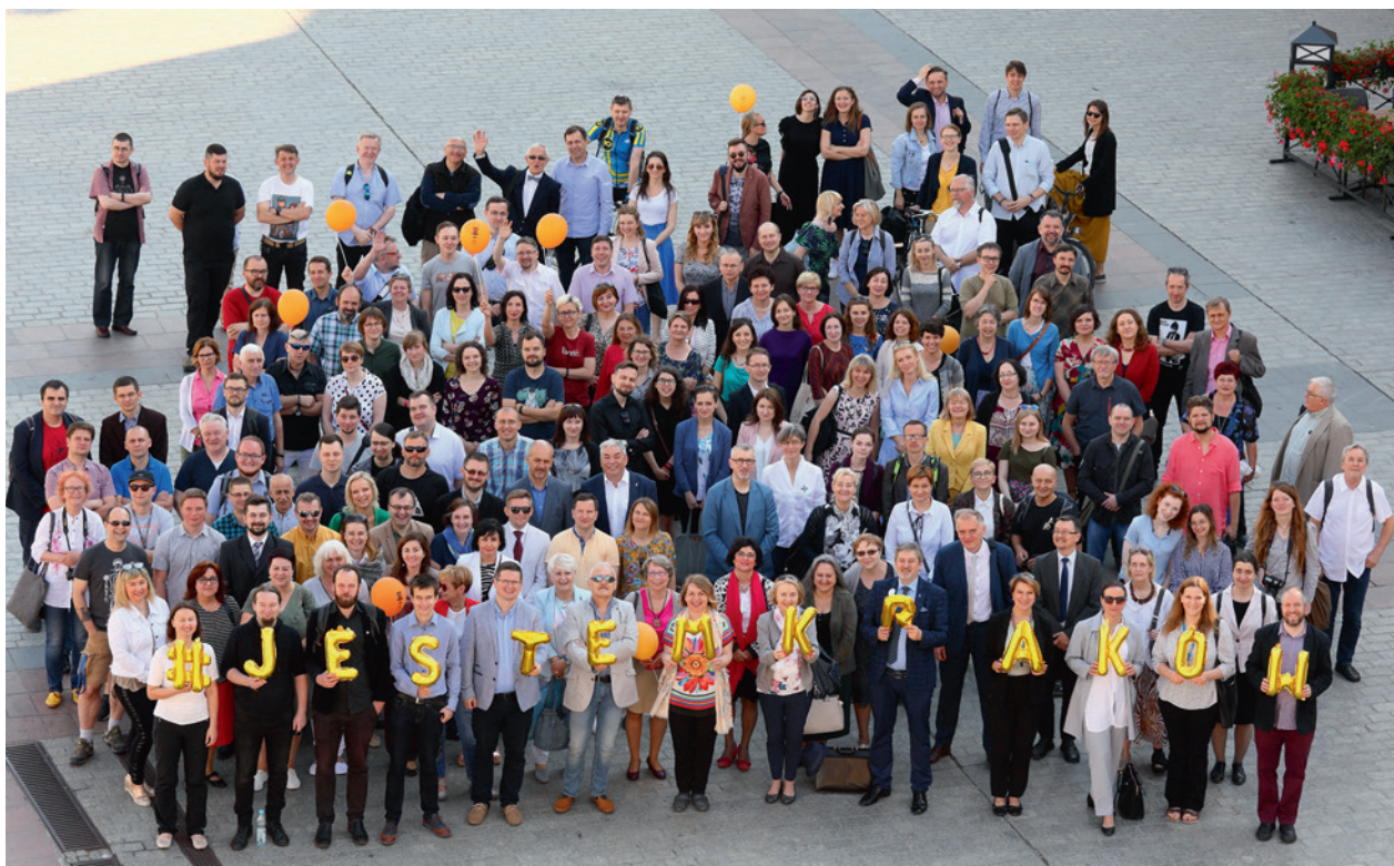
Zespół Muzeum na płycie Rynku Głównego z przewodnim hasłem jubileuszu Jestem Kraków, 3 czerwca 2019 r.