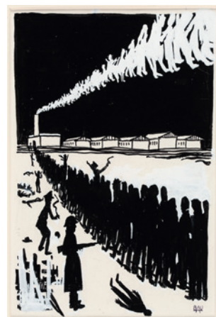
Józef Bau, Wejście przez główną bramę – wyjście przez komin ( Widok obozu w Płaszowie – A View of Płaszów Concentration Camp ), Kraków, 1945–1953, rysunek, ołówek, tusz, papier, 21,3 × 16,5 cm, sygn. MHK-3894/VIII