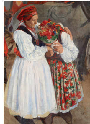
Stanisław Czajkowski, Pożegnanie panny młodej z matką , Kraków (Bronowice), 1902, olej, płótno, 128 × 74 cm, sygn. MHK-6202/III