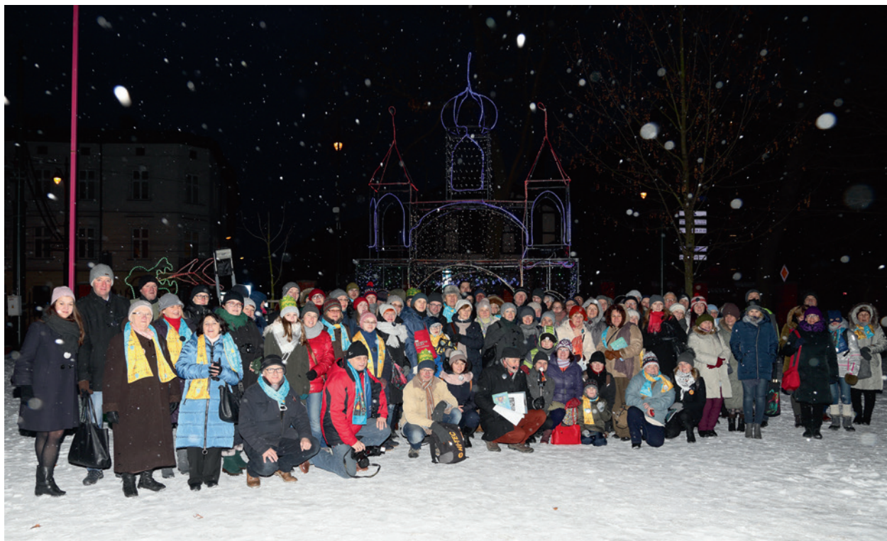
Uczestnicy spaceru Wokół szopki , 6 stycznia 2019 r.