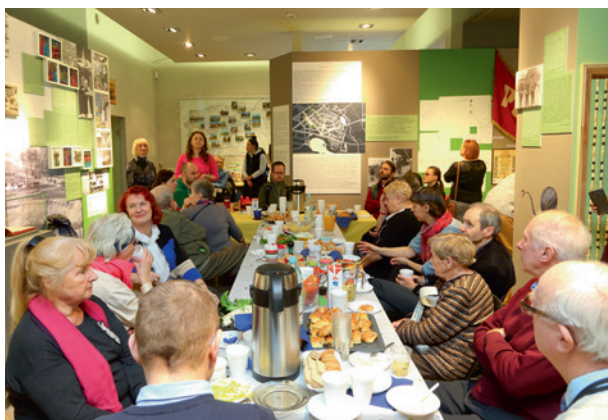
Wiosenna przewodźka , uczestnicy symbolicznego pożegnania z oddziałem Dzieje Nowej Huty na os. Słonecznym, 24 marca 2019 r.