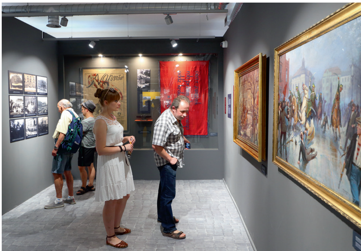
Zwiedzający w trakcie wernisazu wystawy Podgórczanin w Muzeum Podgórze, 12 czerwca 2019 r., fot. Tomasz Kalarus