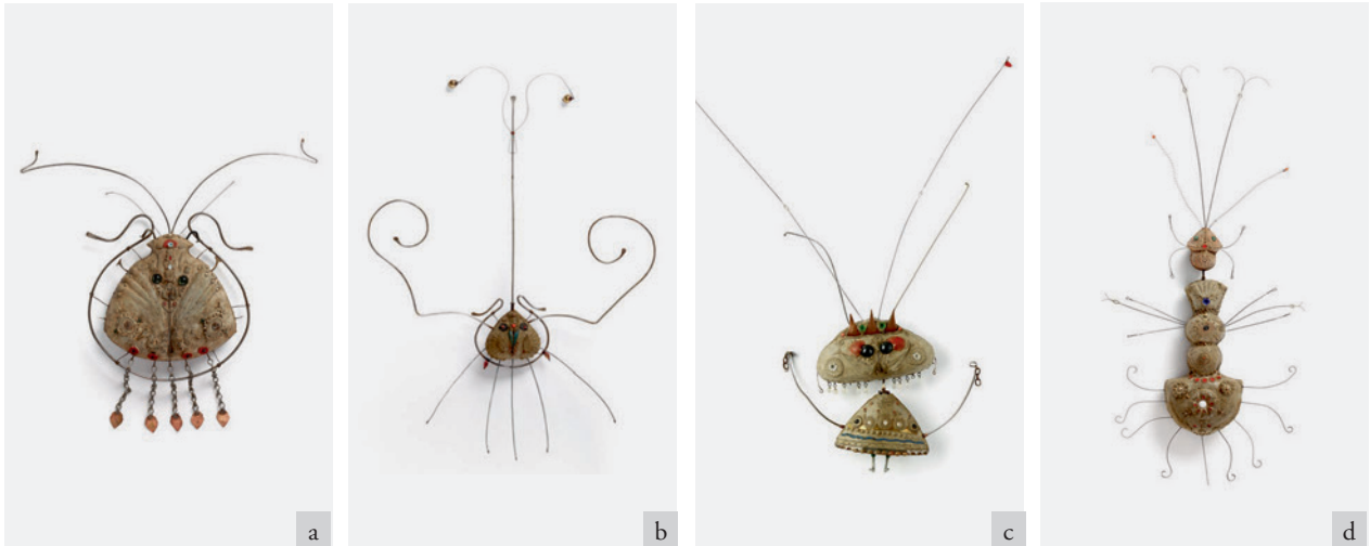
Marian Kruczek, rzeźby z cyklu Cyrk , Kraków, lata 60. XX w., technika własna, sygn.: a) MHK-125/IV/1-2, b) MHK-125/IV/1-6, c) MHK-125/IV/1-11, d) MHK-125/IV/1-12

uruchomiona przez Gminę Miejską Kraków jako rodzaj funduszu celowego na zakupy obiektów do zbiorów dla miejskich muzeów.