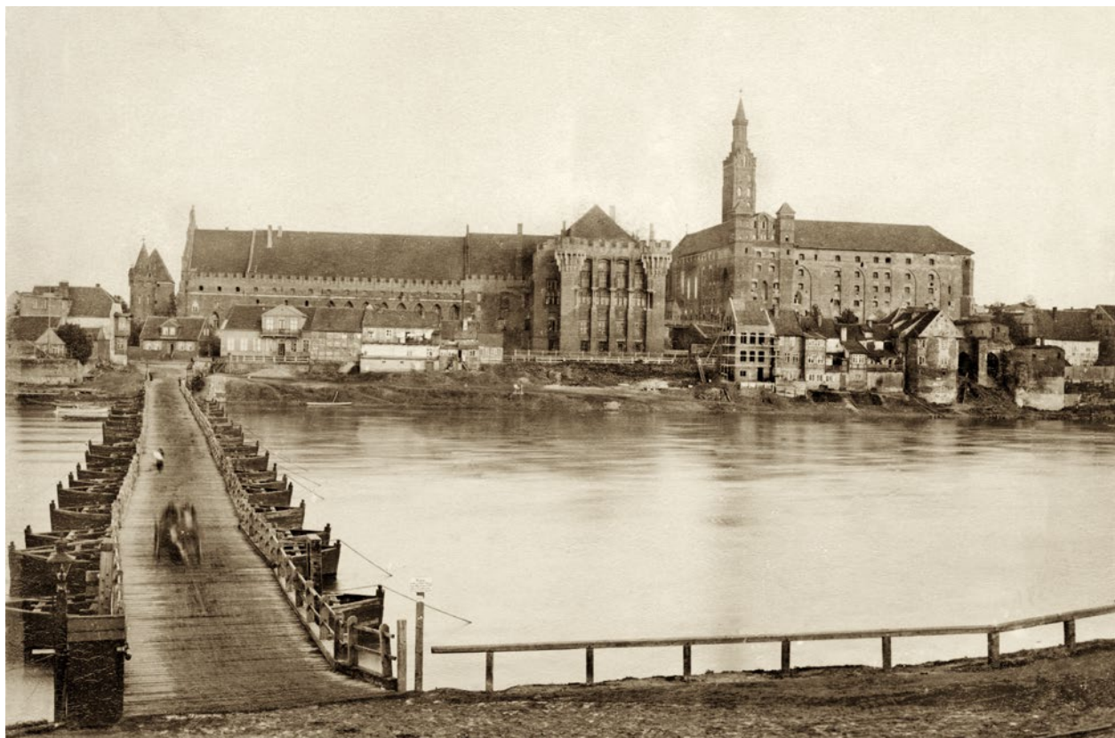
Zamek malborski pod koniec XIX w., „Marienburg Baujahr” 1887, fot. 32a; w zbiorach Muzeum Zamkowego w Malborku

a także inwentaryzacje przedmiotów wchodzących w skład wyposażenia zamkowych wnętrz, spisywane według ustalonego od 1851 roku wzoru 32 . Te ostatnie nie były jednak inwentarzami kolekcji sensu stricto , a raczej spisami różnych przedmiotów stanowiących majątek zamkowy, również tych codziennego użytku. Pośród nich odnajdujemy jednak informacje o zabytkach 33 , dzięki czemu, wykorzystując dodatkowe treści i źródła, można identyfikować pojedyncze obiekty.