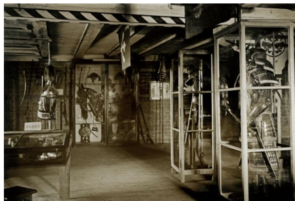
Kolekcja uzbrojenia japońskiego ze zbiorów Theodora Josepha Blella na wystawie militariów na podstryszu Wielkiej Komturii w skrzydle północnym Zamku Średniego, „Marienburg Baujahr” 1917, fot. 26–27; w zbiorach Muzeum Zamkowego w Malborku

wskazuje, iż trafiły tam tylko trzy eksponaty z dawnych zbiorów zamkowych, zapisane w pozycji 74: „XVII/XVII, kusza (fragmenty) kolba z resztkami kościanych okładzin oraz łuk żelazny. Na kolbie napis farb. ol.: Mus. W.Pr./244 a , na kartce atramentem: Armbrust eines Danziger vogel = sch... 58 × 62 cm”; pozycji 91: „XVI, Rękawica 10 folgowa z zarękawiem, wys. 37 cm”; pozycji 127: „XIX, Miecz kuty, zabytkowy o dł. 97 cm” 81 . Przewieziono tam również kilkadziesiąt fotografii i fotokopii wystawowych będących nabytkami z okresu funkcjonowania Oddziału nr 1 MWP (poz. 131–490). Pozostałe zbiory przekazano w depozyt Ministerstwa Kultury i Sztuki.