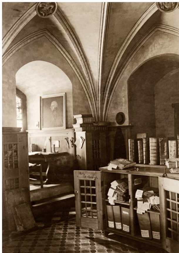
Przedwojenne archiwum Zarządu Odbudowy Zamku w Wieży Kleszej na Zamku Wysokim w Malborku, „Marienburg Baujahr” 1917, fot. 8

od darczyńców Towarzystwo znacząco wsparło dzieło odbudowy, wyposażenia wnętrza zamkowych oraz zakup obiektów zabytkowych do kształtujących się kolekcji, często inicjowanych właśnie za pośrednictwem tych działań 36 .