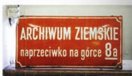
10 Tablica umieszczona na kamienicy przy ul. L. Waryńskiego 8 (wcześniej i obecnie ul. św. Gertrudy) utrwajająca znalezienie wejścia do Archiwum w zieleni Plant

łączeniu kwerend z udostępnianiem oraz omówienie działalności naukowej po udostępnianiu. Podkreślić należy, że Kamila Follprecht przeanalizowała działalność Archiwum (czy raczej Archiwów) na różnych polach zarówno w ujęciu historycznym, jak i współczesnym. Wywód w pierwszym rozdziale został podparty może niekiedy zbyt długimi, ale za to niezwykle trafnymi, interesującymi i wzbogacającymi tekst autorki cytatami.