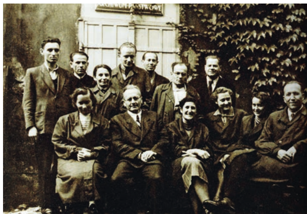
9 Pracownicy Archiwum Państwowego w Krakowie przed wejściem do Archiwum od strony ul. św. Gertrudy 8a (wówczas ul. L. Waryńskiego), 1950 r.