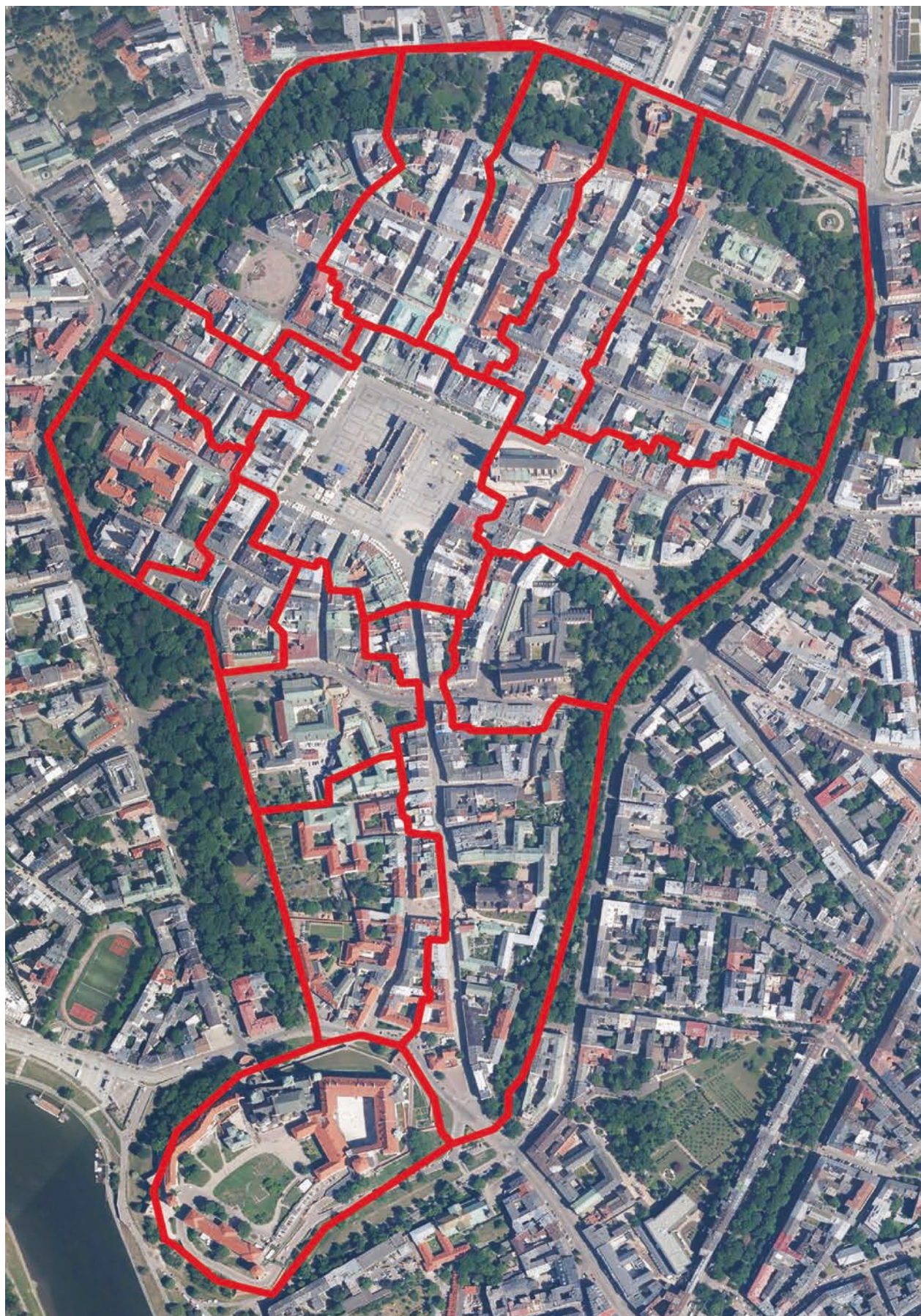
Ryc. 1. Proponowany podział Starego Miasta na poszczególne zeszyty. Granice opracowane na podstawie planu katastralnego z 1848 r., naniesione na ortofotomapę; oprac. Mateusz Niemiec