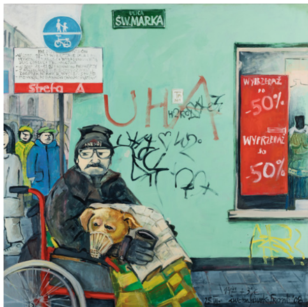
Iwona Siwek-Front, Dziadek z psem , Kraków, 2008, sygn. i dat. iwona siwek-front 08 , olej, płótno, 110 × 110 cm, nr inw. MHK-193/IV