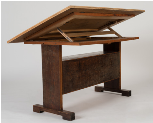
Stół kreślarski, regulowany, projekt Mariana Sigmunda, Kraków, 1. poł. XX w., drewno, metal, wys. 78 cm, szer. 90 cm, dł. 141 cm, nr inw. MHK-80/XIa