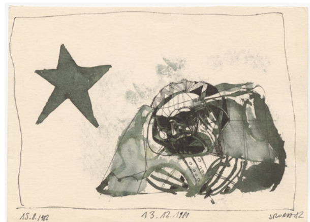
Jacek Sroka, dwie z 10 grafik z cyklu 13.12.81 , sygn. Sroka 82 , tusz, piórko, lawowanie, 16 × 21 cm, nr inw. MHK-3909/VIII i MHK-3918/VIII