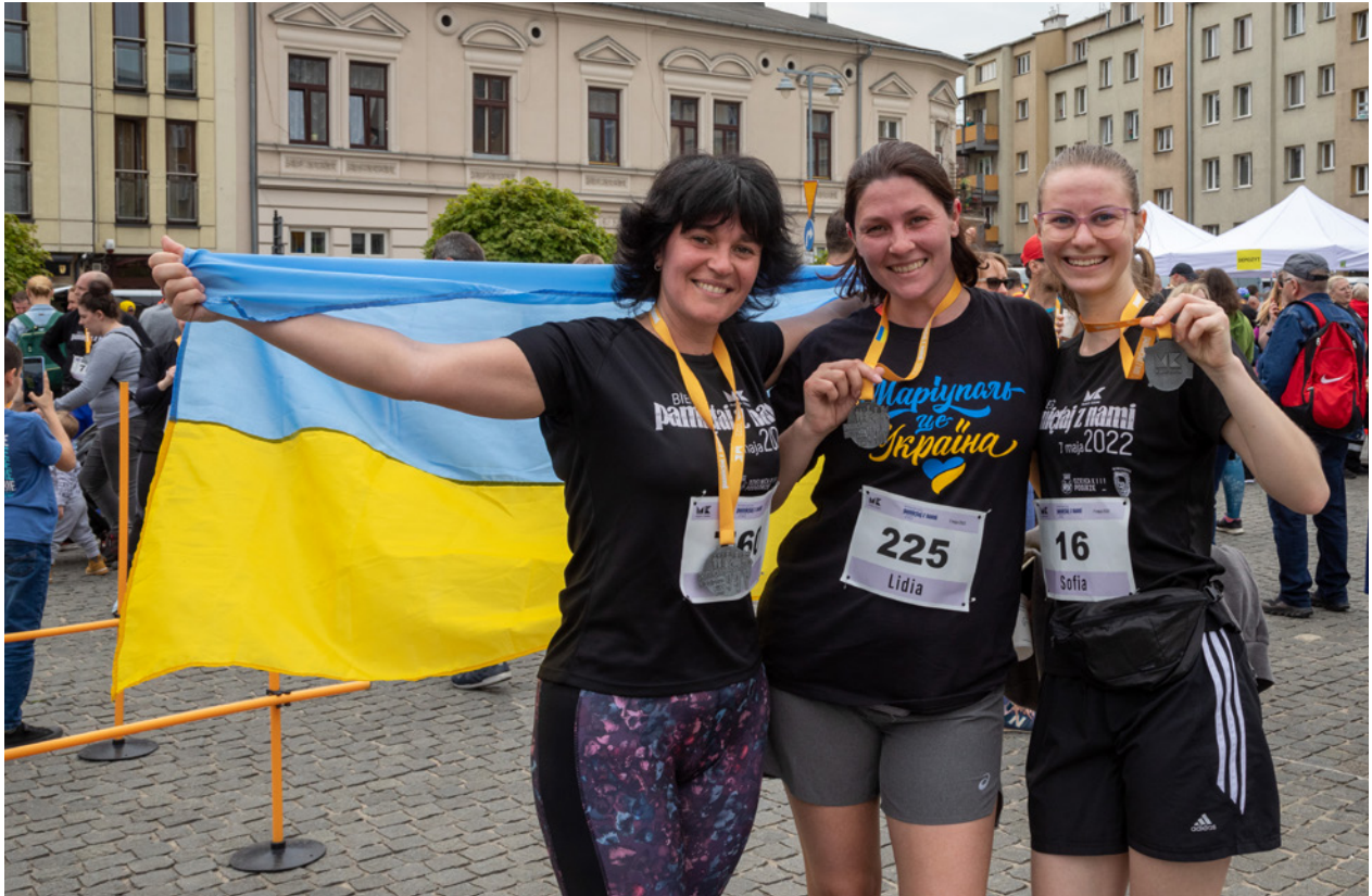
Uczestniczki biegu Pamiętaj z nami na mecie na placu Bohaterów Getta, 7 maja 2022 r.

i hybrydowej przez cały miesiąc. Organizacja wydarzenia była dziełem Szymona Jarosińskiego.