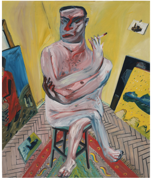
Jacek Sroka, Autoportret z ćmikiem , sygn. i dat. Sroka 1989 , olej, płótno, 160 × 125 cm, nr inw. MHK-190/IV