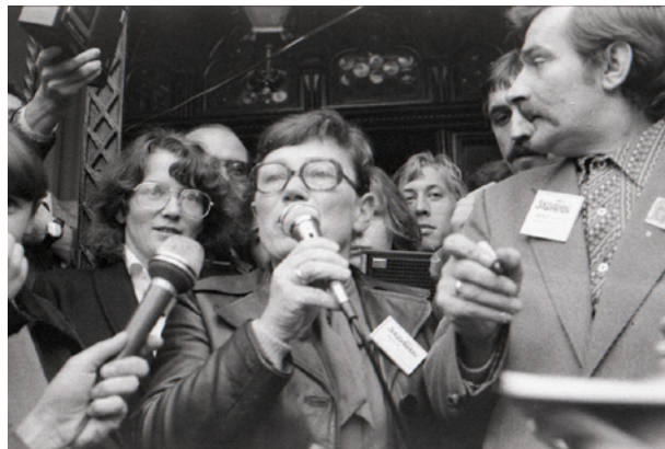
Anna Walentynowicz i Lech Wałęsa na spotkaniu ze studentami przed Collegium Novum, fot. Andrzej Moskwiak, 20 października 1980 r., 2,4 × 3,6 cm, nr inw. MHK-9674/N/1