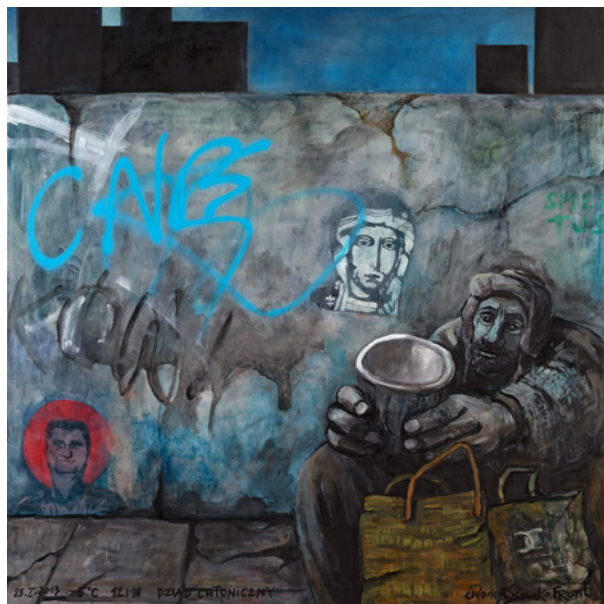
Iwona Siwek-Front, Dziad chtoniczny , sygn. i dat. iwona siwek-front 2013 , olej, płótno, 110 × 110 cm, nr inw. MHK-192/IV