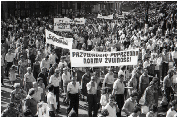
Marsz głodowy – protest przeciwko pogarszającemu się zaopatrzeniu sklepów w żywność, fot. Andrzej Moskwiak, 7 sierpnia 1981 r., 2,4 × 3,6 cm, nr inw. MHK-9681/N/16