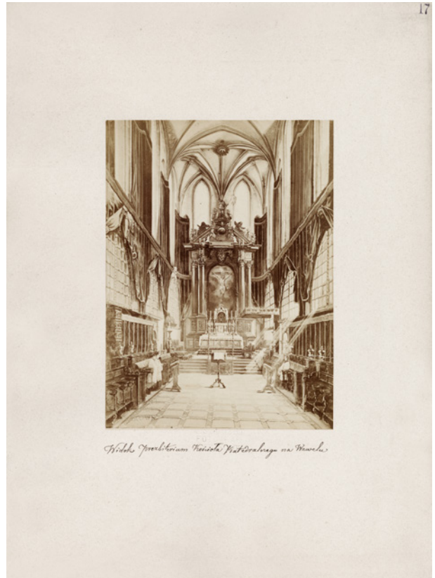
Jedna z 10 fotografii obrazów Saturnina Świerzyńskiego przedstawiających wnętrza krakowskich zabytków, wykonał Awit Szubert, 1867–1883, 17 (32) × 13 (24) cm, nr inw. MHK-Fs23018/IX/1

Wymienione powyżej prace zakupiono z dotacji Ministerstwa Kultury i Dziedzictwa Narodowego w ramach pro-