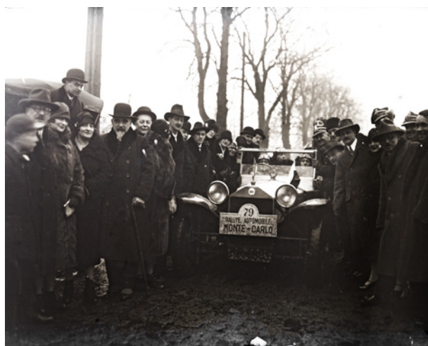
Wyjazd załóg z Krakowa na Międzynarodowy Gwiazdasty Rajd Samochodowy Monte Carlo, autor fotografii nieznan, styczeń 1928 r., 9 × 15 cm, nr inw. MHK-9664/N-1

W drugiej połowie roku przeprowadzono kolejny spis, który objął kolekcje Działu IV (Kraków Współczesny), Działu V (militaria), Działu VI, Fs VI (teatralia), KLP