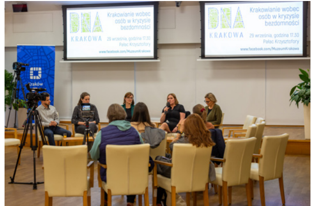
Uczestnicy spotkania z cyklu DNA Krakowa zatytułowanego Krakowianie wobec osób w kryzysie bezdomności , sala Miedziana w pałacu Pod Krzysztofory, 29 września 2022 r., fot. Bogdan Krężel