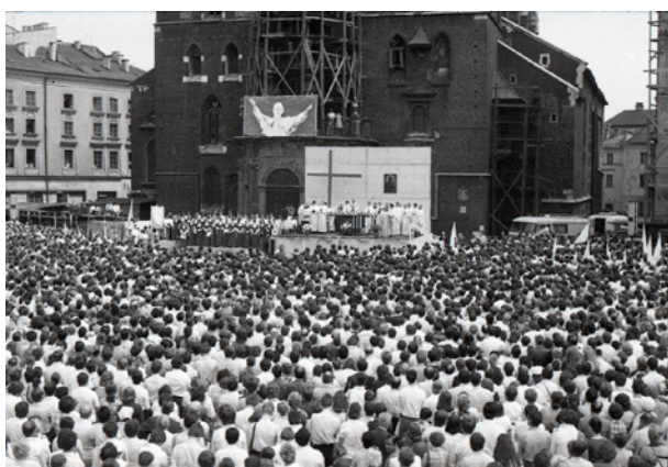
Biały Marsz – pokojowa manifestacja na Rynku Głównym po zamachu na papieża Jana Pawła II, fot. Andrzej Moskwiak, 17 maja 1981 r., 2,4 × 3,6 cm, nr inw. MHK-9675/N/18