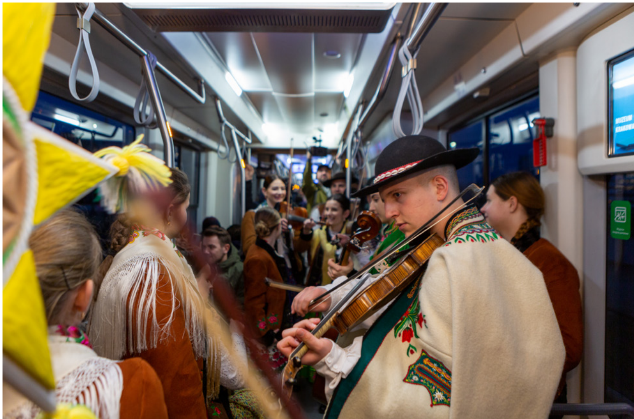
Inauguracja Roku Włodzimierza Przerwy-Tetmajera, wspólne kolędowanie na ulicach Krakowa, 29 grudnia 2022 r.