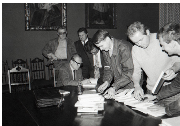
Czesław Miłosz na spotkaniu ze studentami w Collegium Novum, fot. Andrzej Moskwiak, 9 października 1989 r., 2,4 × 3,6 cm, nr inw. MHK-9687/N/13