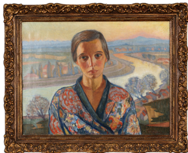
Witold Chomicz, Portret żony , Kraków, 1937, sygn. p.d. W. Chomicz , olej, płótno, 67 × 74 cm, nr inw. MHK-6278/III