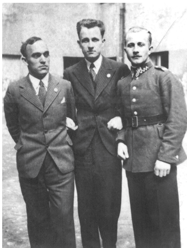
Członkowie starszoharcerskiego zastępu Wilcza Gromada z Podgórza, lata 30. XX w.