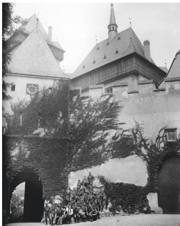
Zlot Skautów Słowiańskich w Pradze. Zwiedzanie zabytków na zamku Karola VI w Karlštejnie, 1931, autor fotografii nieznanymi; w zbiorach MHK, nr inw. MHK-648/H

Cechą charakterystyczną działalności Hufca Podgórskiego było powołanie zastępu starszoharcerskiego, później