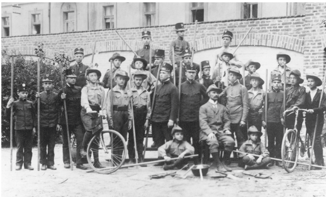
Drużyna działająca przy TS Sokół w Podgórzu, 1911–1912