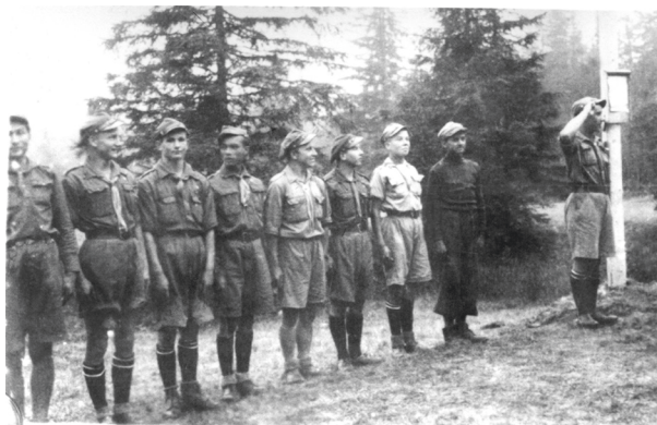
Uczestnicy obozu Hufca Podgórskiego w Podspadach, 1939, autor fotografii nieznanymi; w zbiorach MHK, nr inw. MHK-809/H

pracy śródrocznej poszczególnych drużyn 59 i zastępów 60 oraz plany obozów 61 .