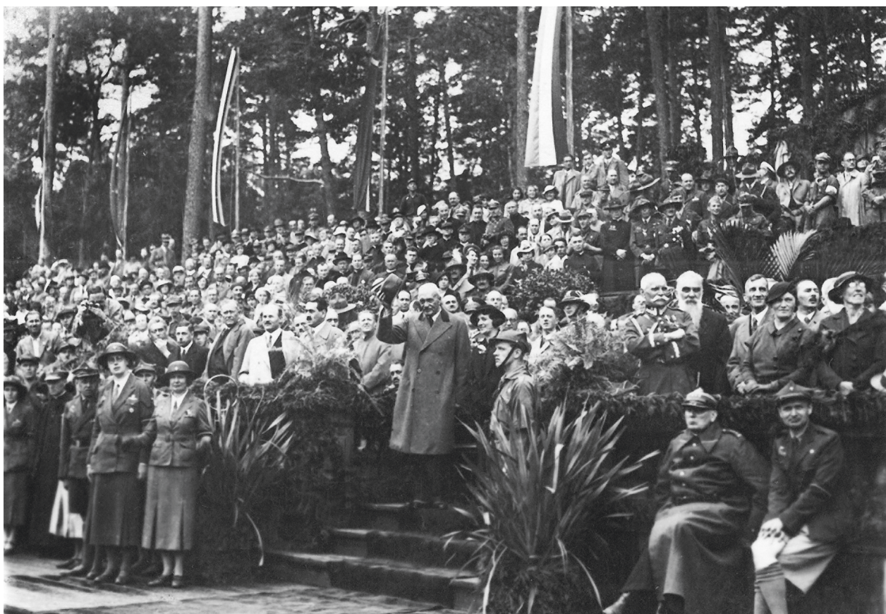
Jubileuszowy Zlot 25-lecia Harcerstwa Polskiego w Spale, lipiec 1935 r., autor fotografii nieznan; w zbiorach MHK, nr inw. MHK-360/H

Muzealia dotyczące okresu międzywojennego związane są przede wszystkim z podgóorskimi harcerzami. Opisane powyżej wybrane pamiątki są najbardziej wartościowe i reprezentatywne dla tego okresu. Oprócz nich możemy jeszcze znaleźć wiele innych materiałów dotyczących podgóorskiego harcerstwa. Dzięki ludziom, którzy na początku lat dziewięćdziesiątych XX wieku, przy okazji organizacji wystaw o tematyce harcerskiej, przekazali swoje cenne pamiątki na potrzeby tworzącej się kolekcji harcerskiej, możemy dzisiaj powiedzieć, że Muzeum Historyczne Miasta Krakowa posiada unikatowe zbiory na skalę europejską. W Polsce jeszcze tylko w Warszawie gromadzone są na taką skalę pamiątki związane z harcerstwem 75 .