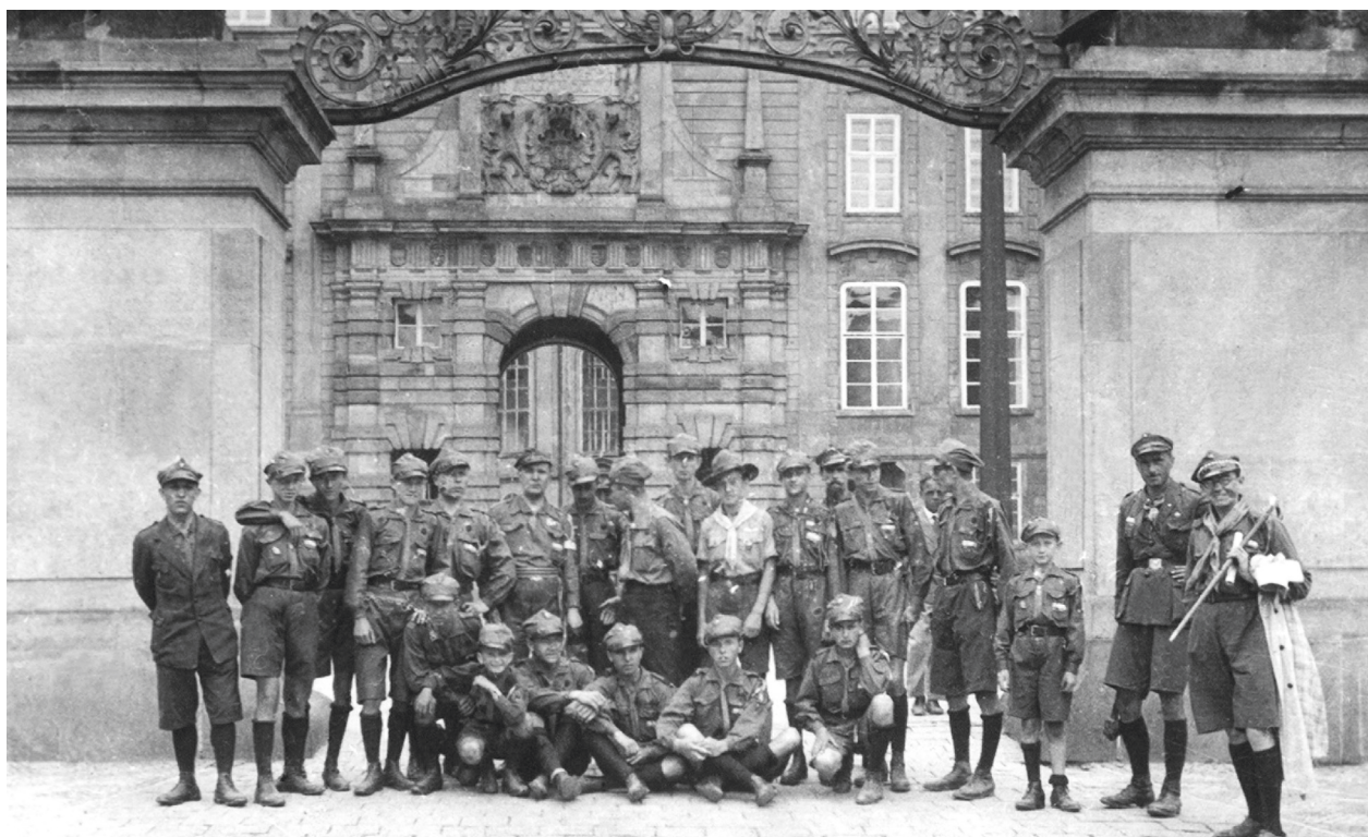
Zlot Skautów Słowiańskich w Pradze. Zwiedzanie miasta, 1931, autor fotografii nieznanymi; w zbiorach MHK, nr inw. MHK-651/H

i inni. Głównym celem zastępu była pomoc w pracy hufca przez pełnienie różnych funkcji, np. drużynowych czy przybocznych, w drużynach, które miały problemy kadrowe. Na początku działali tylko w swoim macierzystym hufcu. Spotykając się w małych grupkach, omawiali bieżącą sytuację w drużynach, starając się pomagać w trudnych sytuacjach. Pisali artykuły metodyczne, prezentowali swoje doświadczenia na spotkaniach z młodszą kadrami instruktorską 70 . W późniejszym okresie prowadzili swoją działalność korespondencyjnie, wymieniając poglądy na tematy aktualne oraz harcerskie. Wszystkie dokumenty wytworzone