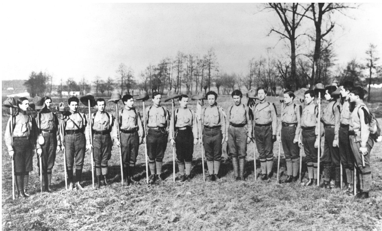
I Drużyna Skautowa im. ks. Brzózki w Prokocimiu, 1912, autor fotografii nieznanymi; w zbiorach MHK, nr inw. MHK-41/H

podgórskich harcerzy na Hali Hajdowej w Zawoi koło Makowa w 1925 roku 32 , obóz I Drużyny Harcerskiej z Podgórze w Podświlu na Wileńszczyźnie w 1927 roku 33 , obóz IV Drużyny Podgórskiej w Łososinie Dolnej koło Nowego Sącza w 1933 roku 34 , I Drużyna z Borku Fałęckiego na obozie w Mucharzu w Beskidzie Małym w 1937 roku 35 czy fotografia uczestników ostatniego obozu Hufca Podgórskiego w Podspadach na Spiszu w 1939 roku 36 .