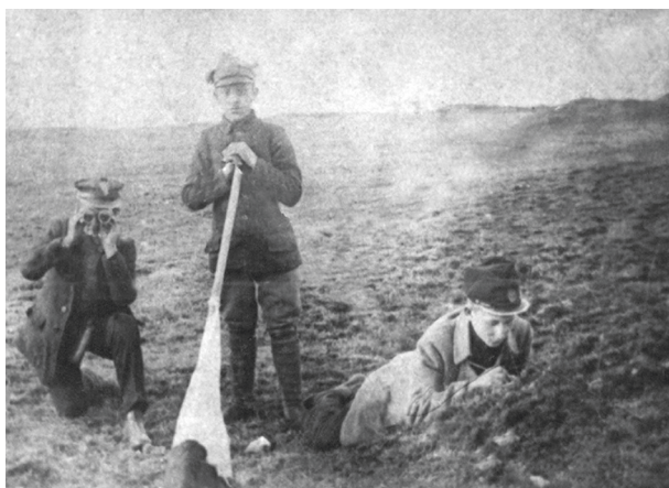
Skauci podgórscy w trakcie zajęć terenowych, 1911–1914, autor fotografii nieznanymi; w zbiorach MHK, nr inw. MHK-459/H