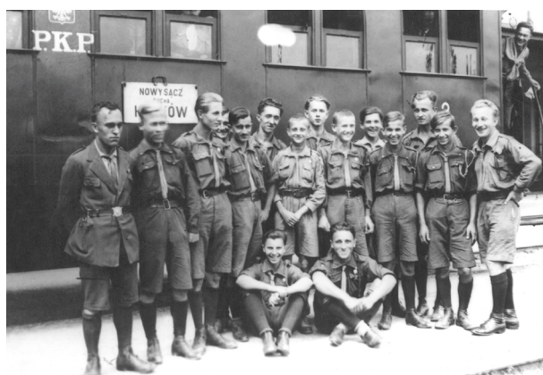
W drodze na IV Jamboree do Gödöllő koto Budapesztu, 1933, autor fotografii nieznany; w zbiorach MHK, nr inw. MHK-641/H

strowane KPH w Hufcu Podgórskim działało przy IV Drużynie Podgórskiej od 1926 roku 49 .