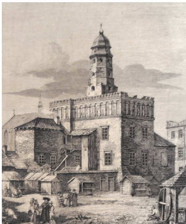
A. Gryglewski, Widok ratusza na Kazimierzu w Krakowie, drzeworyt, wycinek z „Tygodnika Ilustrowanego”, druga połowa XIX w.; w zbiorach Muzeum Historycznego Miasta Krakowa, nr inw. MHK 1646/VIII

ina, którego spory zasób znajduje się w MHK, wśród nich Widok ratusza na Kazimierzu , drzeworyt z 1863 roku, zamieszczony w „Tygodniku Ilustrowanym”. Budynek przedstawiony jest od południowo-wschodniej i jest ilustracją do artykułu Kilka słów o Przedmieściu Krakowskim Kazimierzu 56 .