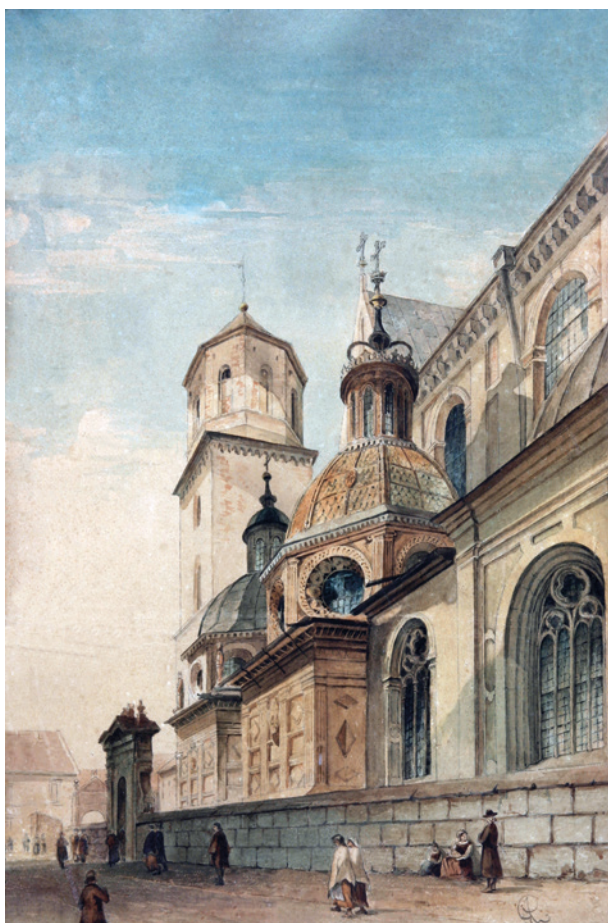
A. Gryglewski, Widok katedry na Wawelu od południa, ok. 1870 r., akwarela; w zbiorach Muzeum Historycznego Miasta Krakowa, nr inw. MHK 2604/III

obanta z 1859 roku, została wykonana przed pracami konserwatorskimi przeprowadzonymi na Wawelu przez Sławomira Odrzywolskiego w latach 1895–1905 49 . W oknach kaplic widoczne są maswerki wykonane w 1859 roku przez Edwarda Stehlika, które zostały usunięte podczas restauracji Odrzywolskiego, oraz na dalszym planie budynek wikarówki przed przebudową 50 .