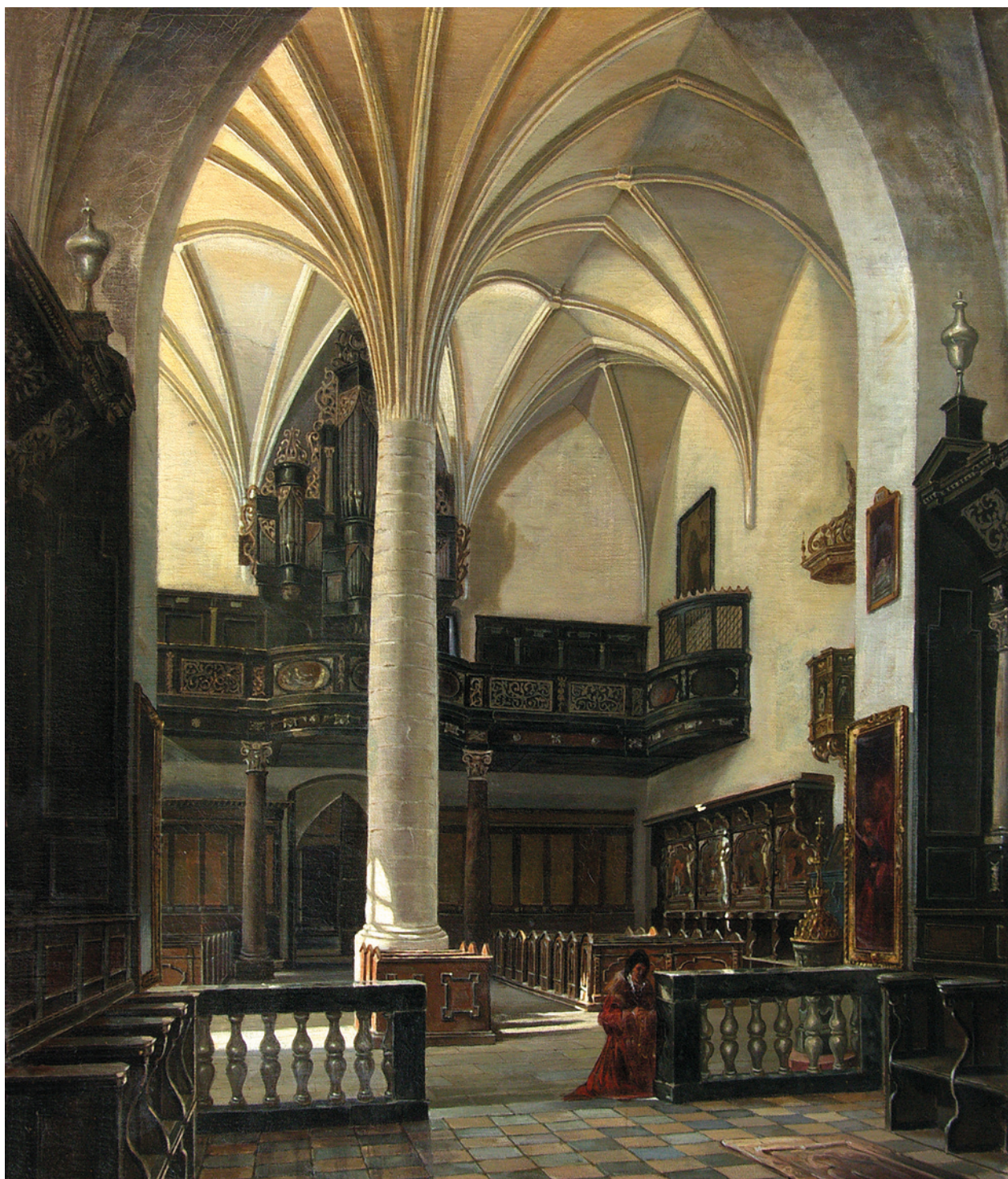
A. Gryglewski, Widok wnętrza kościoła Św. Krzyża w Krakowie, lata 70. XIX w., olej na płótnie; w zbiorach Muzeum Historycznego Miasta Krakowa, nr inw. MHK 4630/III

jeszcze przed restauracją kościoła wykonaną przez architektów Tadeusza Stryjeńskiego i Zygmunta Hendla w latach 1896–1898 oraz przed odsłonięciem przez Stanisława Wyspiańskiego renesansowych malowideł w nawie głównej 47 .