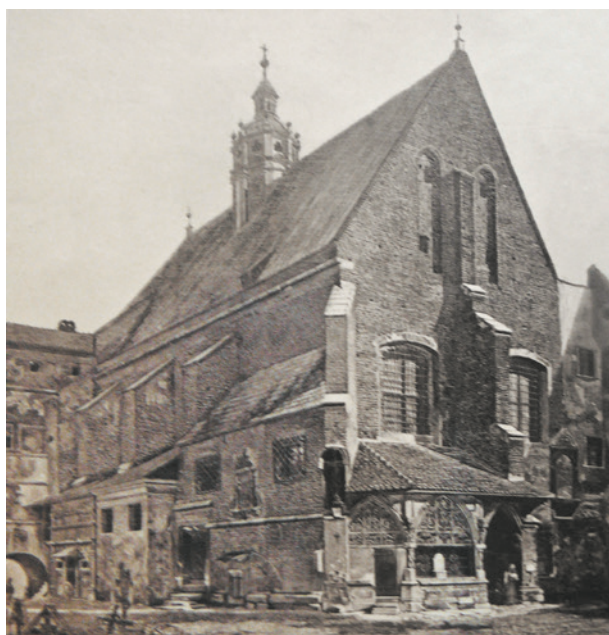
Widok kościoła św. Barbary, fot. W. Rzewuskiego wg A. Gryglewskiego, ok. 1870 r.; w zbiorach Muzeum Historycznego Miasta Krakowa, nr inw. MHK 30/VIII

riana Cynka, Gryglewskiego i Matejki, która rozpoczęła się na studiach, trwała w okresie późniejszym. Malarze pomagali sobie i wspierali w niełatwych przeciż czasach.