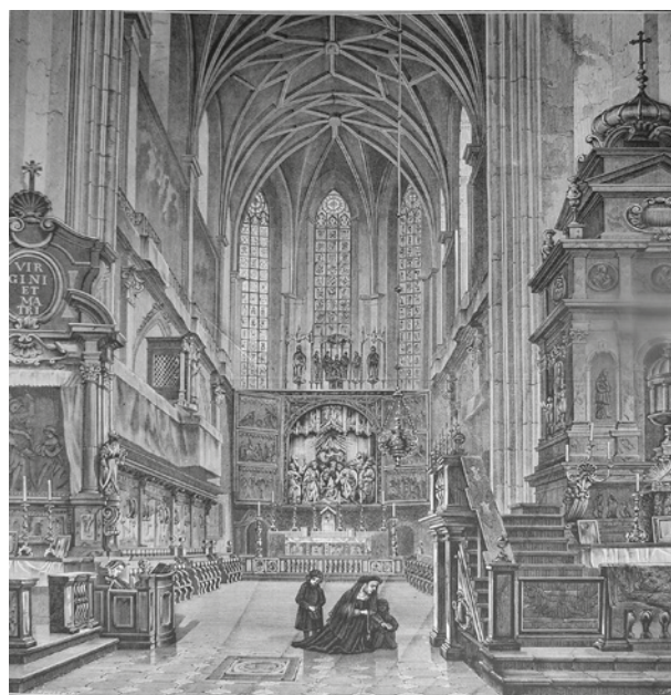
A. Gryglewski, Widok wnętrza prezbiterium kościoła Mariackiego w Krakowie, 1867 r.; w zbiorach Muzeum Historycznego Miasta Krakowa, Widoki Krakowa, nr. inw. MHK 458/VIII

Reprodukcje drzeworytowe jego obrazów zamieszczały „Kłosa”, a w latach 1863–1872 „Tygodnik Ilustrowany”. W 1869 roku wykonał widoki salin i pracy górników w Wieliczce 23 . Od 1872 do 1875 roku przebywał w War-