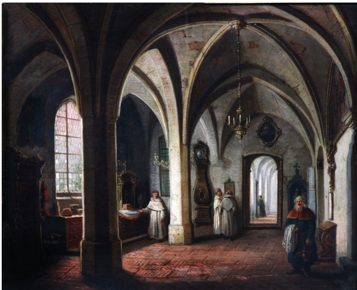
A. Gryglewski, Wnętrze sieni gotyckiej (czasowo zakrystii) kościoła Dominikanów w Krakowie, ok. 1870 r., olej na płótnie; w zbiorach Muzeum Historycznego Miasta Krakowa, nr inw. MHK 1176/III

w 2009 roku, ukazały się w lokalnych publikacjach Gdańska oraz rodzinnego Brzostka artykuły przypominające sylwetkę malarza oraz okoliczności zgonu 35 .