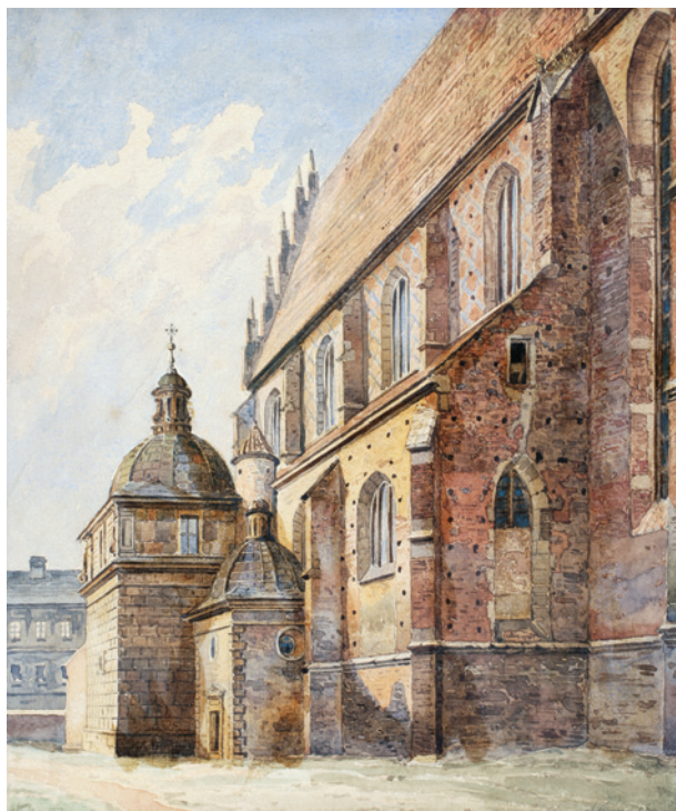
A. Gryglewski, Widok kościoła Bożego Ciała, lata 70. XIX w., akwarela; w zbiorach Muzeum Historycznego Miasta Krakowa, nr inw. MHK 528/III