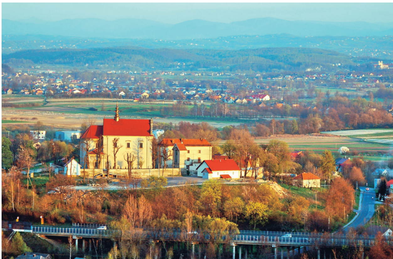
Widok zespołu zabudowań kościelnych na wzgórzu w Morawicy

i najpotężniejszych monarchów zostającej na rok 1834 25 , opakowanie papierowe z relikwii św. Urszuli, dwie monety austriackie z lat 1872 i 1885 oraz opakowanie papierowe z relikwii św. Innocentego.