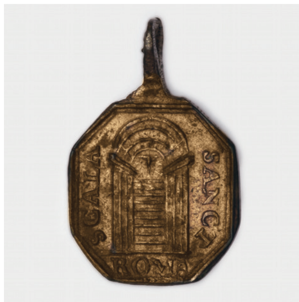
Medalik ze Świętymi Schodami, rewers