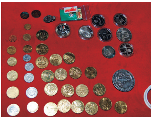
Pamiątki włożone do gałki wieży sygnaturowej kościoła w Morawicy 4 X 2006 r.