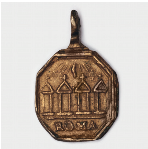
Medalik ze Świętymi Schodami, awers, fot. i wł. R. Myszkaa