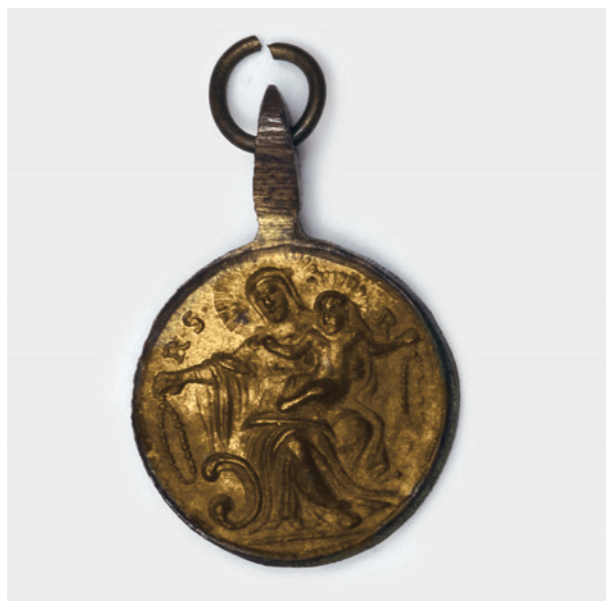
Medalik z Piusem V, rewers