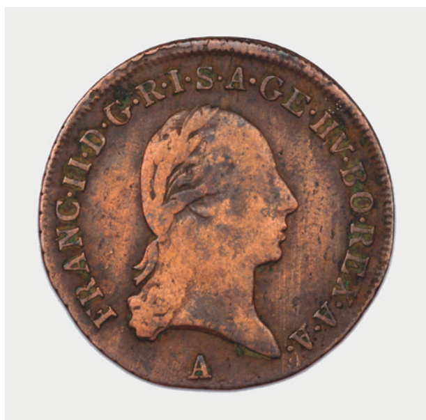
1 krajcar austriacki z 1800 r. – awers, fot. i wł. R. Myszka