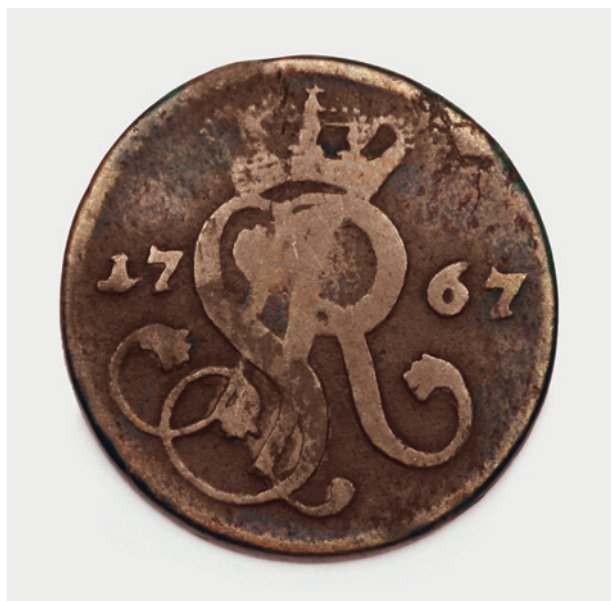
1 grosz króla Stanisława Augusta Poniatowskiego z 1767 r., awers