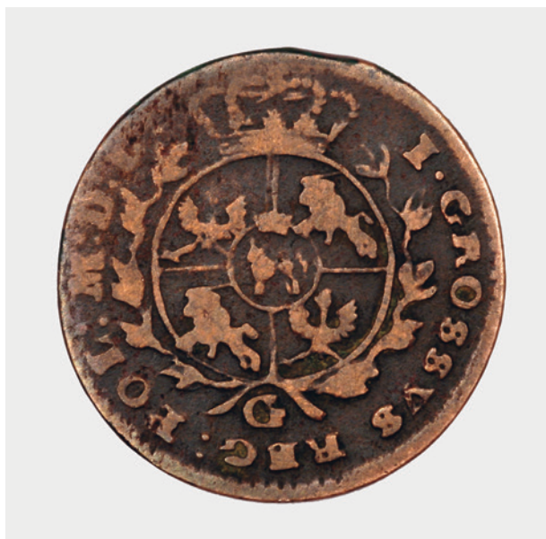
1 grosz króla Stanisława Augusta Poniatowskiego z 1767 r., rewers