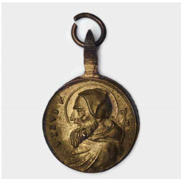
Medalik z Piusem V, awers