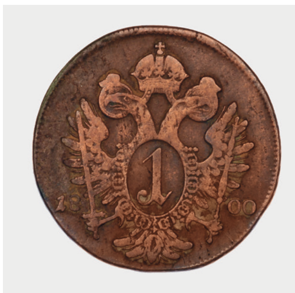
1 krajcar austriacki z 1800 r. – rewers