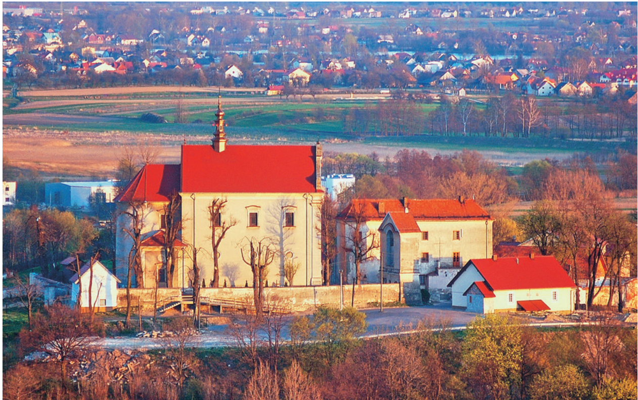
Widok zabudowań kościelnych na wzgórzu w Morawicy, w tle panorama okolic Krakowa

Pierwsza wzmianka historyczna o wsi Morawica, znajdująca się w dokumencie z 1238 roku zamieszczonym w Kodeksie Dyplomatycznym Małopolski , stwierdza, że dziedzicami Morawicy są Żegota, kasztelan krakowski i jego brat Andrzej. Kolejna wzmianka z 1286 roku informuje, że „Pleban Piotr jest kapłanem kaplicy zamkowej w Morawicy” 28 . W 1408 roku następuje budowa pierwszej murowanej świątyni w Morawicy, umieszczonej w zamku należącym do Tęczyńskich.