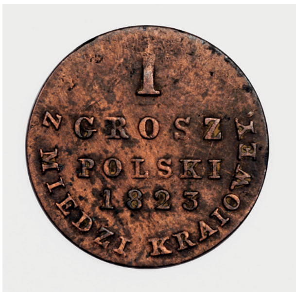
1 grosz polski z 1823 r. – rewers