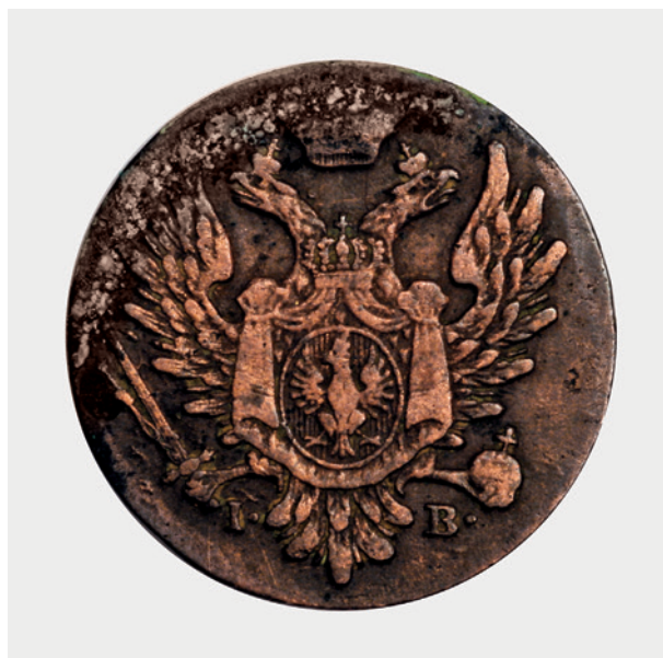
1 grosz polski z 1823 r. – awers