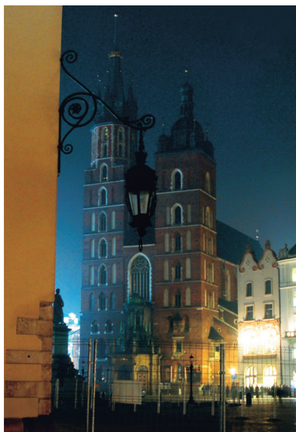
Kościół Mariacki w Krakowie

Zwyczaj umieszczania w gałkach wież budowli kościelnych i świeckich pamiątek związanych z ich dziejami poświadczony jest w źródłach od średniowiecza. Najstarszy dokument w tej sprawie, znaleziony w Krakowie, pochodzi z 1478 roku. Znajdował się on w gałce wieży kościoła Ma-