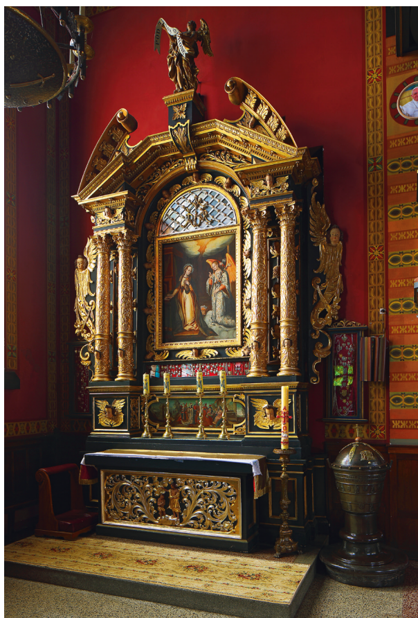
Ołtarz Matki Boskiej Pocieszenia, przełom XVI i XVII w., wykonął Baltazar Kuncz

W kościele znalazły się XV-wieczny relikwiarz św. Urszuli i Jedenastu Tysięcy Dziewic, pochodzący z połowy XV wieku, w kształcie sześciobocznej puszeki nakrytej spłaszczoną kopułą, wykonany ze srebra ze złoceniami 44 . Pierwotnie należał do Bractwa św. Urszuli, istniejącego przy kościele św. Szczepana od XIV wieku; wzmiankowany w inwentarzu z 1798 roku 45 . XVII-wieczny relikwiarz św. Piotra w kształcie puszeki na ośmiobocznej stopie, wykonany ze srebrnej, trybowanej blachy. Ponadto XVII-wieczne cyborium, monstrancja będąca być może pierwotnie relikwiarzem Świętych Apostołów (?), pochodząca z przełomu XVII i XVIII wieku, cztery XVII-wieczne kielichy, dwie pateny srebrne z XVII wieku i futerał, zapewne na monstrancję,