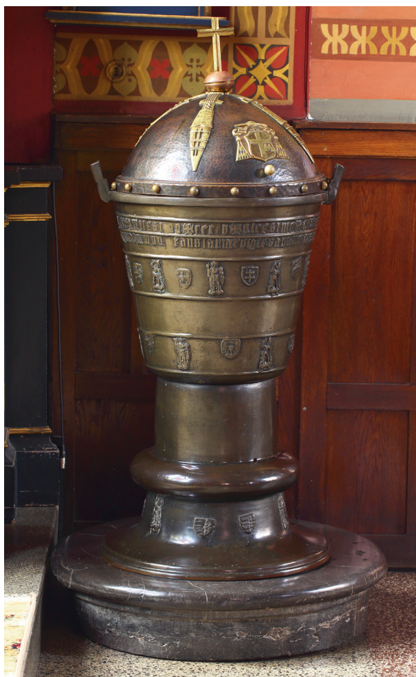
Chrzcielnica, ok. 1425 r.

Ołtarz z obrazem św. Urszuli został umieszczony w kościele „z obrazem tej świętej w sukience metalowej na płótnie malowanym we środku, a na dole z osobliwym i ładnym obrazem Najświętszej Panny, dobrej rady nazwanej, ze sieczki szklanej (...), z kościoła świętego Szczepana przeniesionym” 31 .