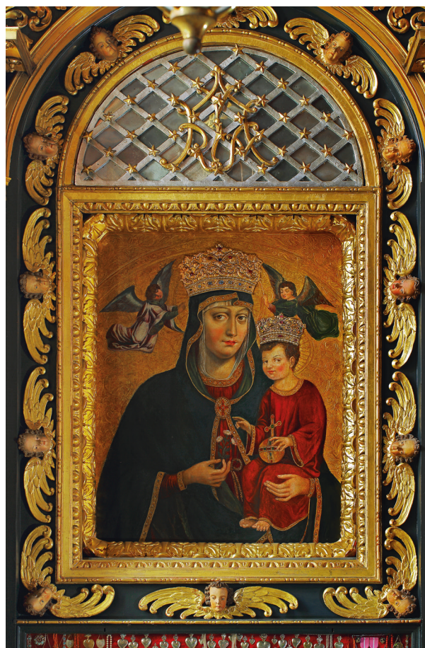
Matka Boska Pocieszenia, XVI lub początek XVII w., tempera, deska