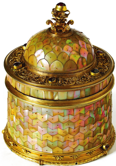
Relikwiarz św. Szczepana, Norymberga, ok. 1530 r.