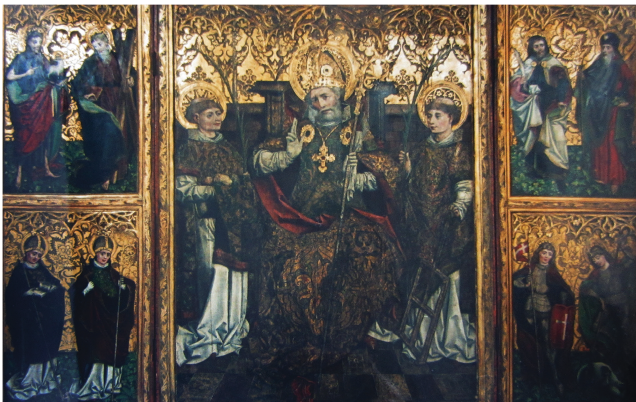
Tryptyk św. Mikołaja w kościele w Więclawicach, ok. 1470–1480

przez cech krupników 72 , niewymieniany dotąd w literaturze w związku z dawnym wyposażeniem kościoła św. Szczepana. Według dotychczasowego stanu badań, został ufundowany do ołtarza tego cechu pod wezwaniem Niepokalanego Poczęcia Najświętszej Marii Panny w nawie nieistniejącego już kościoła.