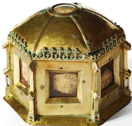
Relikwiarz św. Urszuli, połowa XV w.

O losach części wyposażenia nie ma żadnych informacji, ale wiele obiektów znalazło się u Karmelitów na Piasku, gdzie została przeniesiona parafia kościoła św. Szczepana. Ks. Stanisław Załęski pisał: „Relikwie święte, aparaty, obrazy przeniesiono do kościoła karmelickiego, część rozdano różnym kościołom, równie jak ławki, konfesjonały, które w bazylice na Piasku nie dały się pomieścić. Na wiosnę 1802 r. dokonano barbarzyńskiego dzieła; »rozebrano« obydwie kościoły, zburzono wspaniałe nagrobki Korycińskich, grobowce zaś, w których chowano Jezuitów i ich dobrodziejów, po wywiezieniu kości na nowy cmentarz zasypano rumowiskiem; dzwony, organy, ołtarze, marmury, cegłę i inne materiały sprzedano na licytacji” 28 .