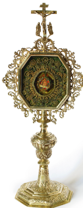
Relikwiarz św. Piotra, XVII w.