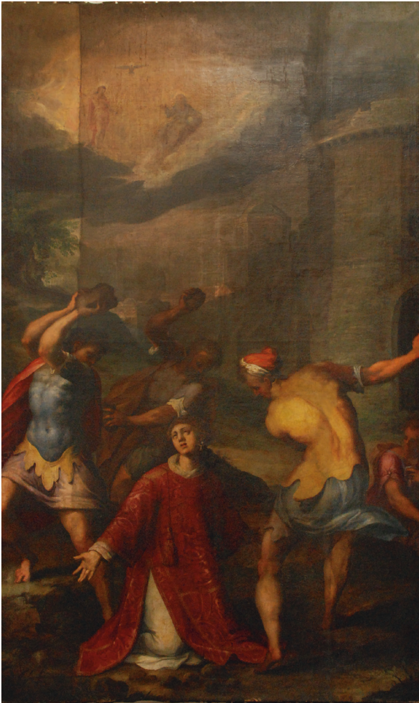
Ukamieniowanie św. Szczepana, XVII w. (?), olej, płótno, fot. Maria Sokół-Augustyńska

nym na zasuwie, o wymiarach 128,5 na 214 cm, niesygnowany. I tu pierwowzorem była grafika Cavalieriego przedstawiająca męczeńską śmierć świętego. Obraz malowany jest olejno na płótnie jedwabnym, co wskazuje, że może być starszy od płótna wiszącego na ścianie zachodniej. Być może jest tożsamy z obrazem, o którym wiadomo z kodycyła do testamentu Stefana Korycińskiego: „Ołtarz wielki, żeby był jak najpiękniejszy, poważną proporcją, kapitele i osoby złociste, a słupy i inne sztuki na kształt porfiru i in-