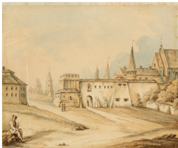
Jan Kanty Wojnarowski, Widok Bramy Szewskiej, ok. 1840 r., akwarela; w zbiorach MHK, nr inw. MHK-1068/VIII

Z kościoła św. Szczepana pochodzi Epitafium Grzegorza Nożownika , datowane na 1532 rok, przechowywane w Muzeum Narodowym w Krakowie 73 , które jest przykładem wczesnorenansowych epitafiów krakowskich, pozostających pod wpływem malarstwa i grafiki niemieckiej. Na tle surowego pejzażu górskiego zostali przedstawieni Chrystus Bolesny oraz Matka Boska i św. Szczepan w stroju diakona. U dołu dwie mniejsze postaci dramatu, klęczące przy ofierze, Grzegorzowi, wytwórcy noży. Inskrypcja w dolnej części obrazu mówi, że pogrzebany jest tu stateczny Grzegorz, nożownik, zabity na ulicy Szczepańskiej. Na górnej listwie ramy znajduje się druga tablica inskrypcyjna, którą wypełnia prośba fundatorów, by Bóg nie osądzał ich wedle nikczemności ich czynu, lecz zmiłował się nad nimi wedle swego niezmiernego miłosierdzia (na wzór Psalmu 103, 10). Dalej następuje data dzienna – 3 czerwca 1532 74 .