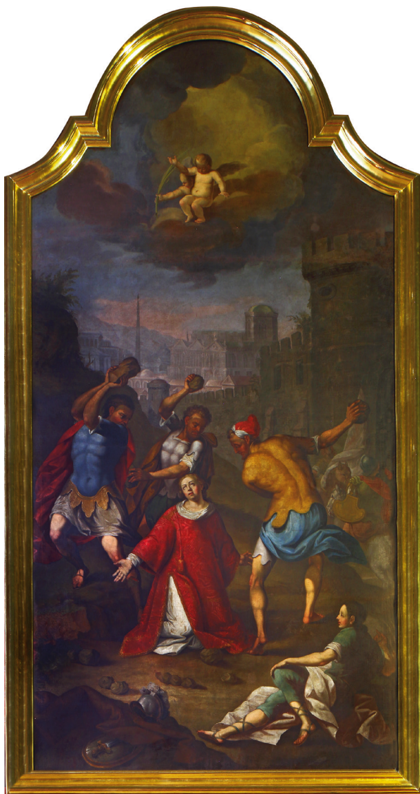
Ukamieniowanie św. Szczepana, XVIII w.

fesjonały stare i wyobrażenia Chrystusa Zmartwychwstałego. Dalszy opis dotyczył ubiorów kapłańskich w kolorach białych – kilkanaście ornatów i trzy kapy. Wśród ornatów czerwonych kapa z wyobrażeniem św. Szczepana. Dalej następują opisy ornatów zielonych i czarnych.