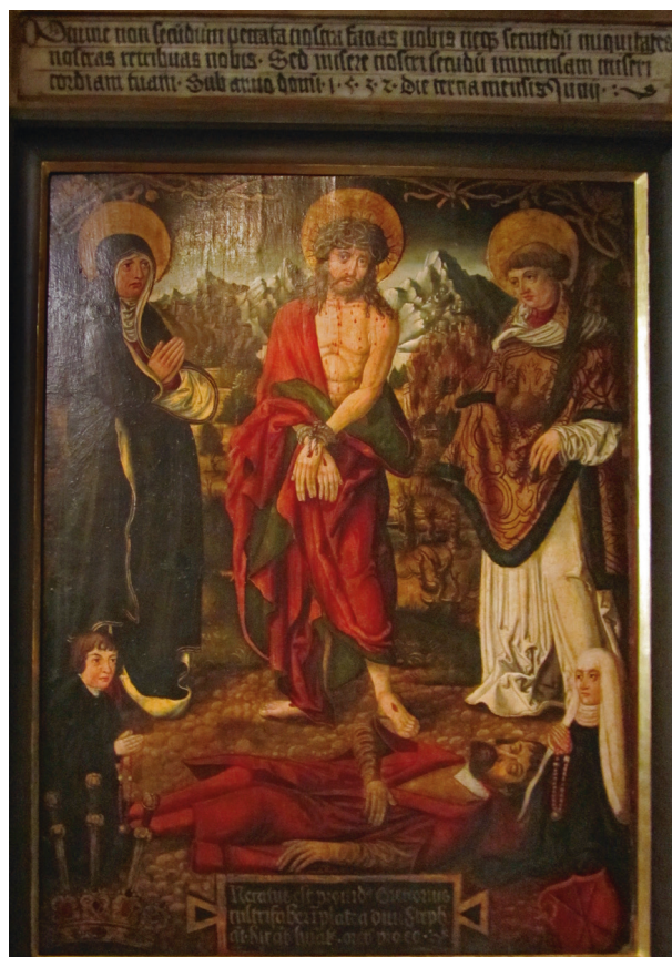
Epitafium Grzegorza Nożownika, 1532; w zbiorach MNK, nr inw. ND-1535

ter przedstawiających 19 świętych, w kwaterze środkowej tronujący święty biskup w szatach pontyfikalnych, uznawany za św. Mikołaja 68 . Według Jerzego Gądomskiego, powstał w latach 1470–1480, bliżej roku 1480 69 . W jezuickim kościele św. Szczepana był od 1585 roku jako nastawa ołtarza bocznego należącego do bractwa czerwonych garbarzy. Odnotowany w kartach wizytacji kardynała Jerzego Radziwiłła. W 1615 roku został przeniesiony w inne miejsce, prawdopodobnie do Węclawic 70 . Przekazano go do prowincjonalnego kościoła już w XVII wieku, kiedy jezuici modernizowali kościół św. Szczepana i którzy do roku 1773 byli dziedzicami i pro-