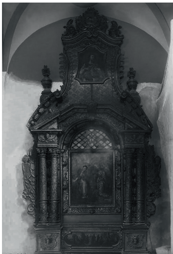
Ołtarz Matki Boskiej Pocieszenia, ok. 1890 r., fot. Ignacy Krieger, w zbiorach MHK, nr inw. MHK-2271/K

z przełomu XVII i XVIII wieku 46 , ornaty z XVIII wieku. Ponadto rękopisy i dekryty królów polskich 47 .