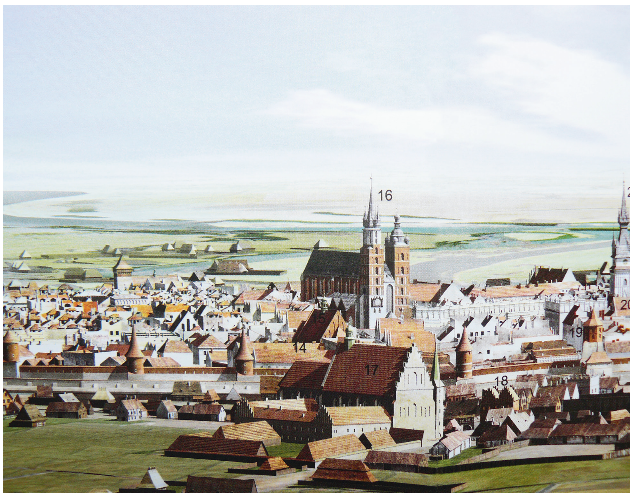
Fragment panoramy Krakowa od północnego zachodu, według stanu z około połowy XVII w., nr 14 – kolegium jezuickie, nr 15 – kościół św. Szczepana; reprod. za: Firlet E., Opaliński P.: Cracovia 3D. Via Regia – Kraków na szlaku handlowym w XIII–XVII wieku. Kraków 2013, s. nlb., oprac. graficzne Piotr Opaliński

wykonał te prace Adam Negowicz, który w 1678 roku podjął się nieokreślonych prac „ad S. Stephanum” 18 ?