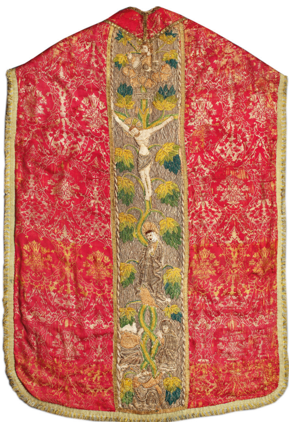
Ornat cechu krupników, ok. 1480–1485; w zbiorach MHK, nr inw. MHK-37/I

ter przedstawiających 19 świętych, w kwaterze środkowej tronujący święty biskup w szatach pontyfikalnych, uznawany za św. Mikołaja 68 . Według Jerzego Gądomskiego, powstał w latach 1470–1480, bliżej roku 1480 69 . W jezuickim kościele św. Szczepana był od 1585 roku jako nastawa ołtarza bocznego należącego do bractwa czerwonych garbarzy. Odnotowany w kartach wizytacji kardynała Jerzego Radziwiłła. W 1615 roku został przeniesiony w inne miejsce, prawdopodobnie do Węclawic 70 . Przekazano go do prowincjonalnego kościoła już w XVII wieku, kiedy jezuici modernizowali kościół św. Szczepana i którzy do roku 1773 byli dziedzicami i pro-