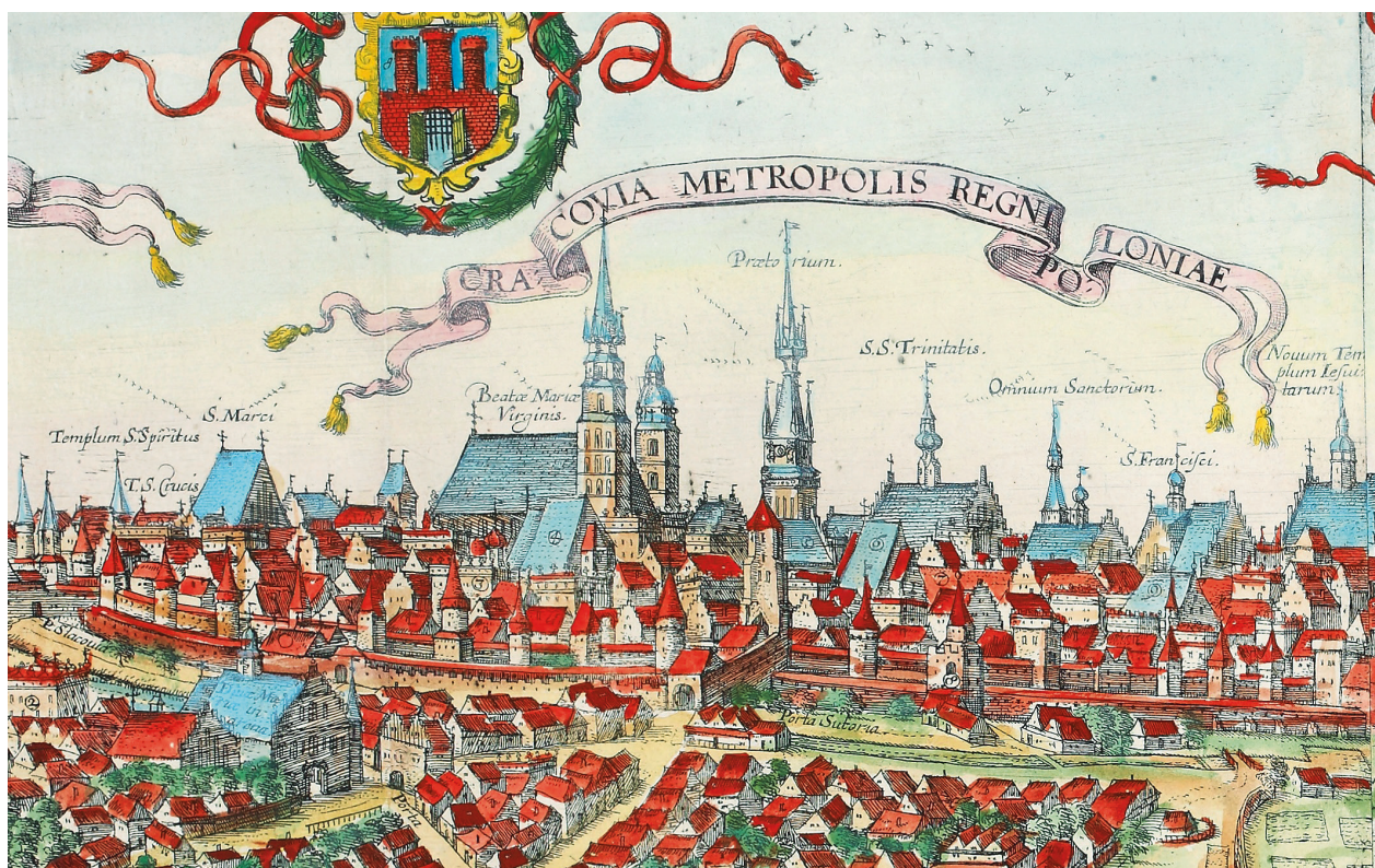
Widok Krakowa od północnego zachodu, 1618, miedzioryt; w zbiorach MHK, nr inw. MHK-3801/VIII