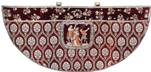
Kapa z kapturem ze sceną ukamieniowania św. Szczepana, XVII i XIX w.; reprodukcja: Wojna i pokój. Skarby sztuki tureckiej ze zbiorów polskich od XV do XIX wieku. Wystawa zorganizowana przez Muzeum Narodowe w Warszawie, Warszawa 25 lutego – 3 maja 2000 roku. Warszawa 2000 , s. 118, nr 20